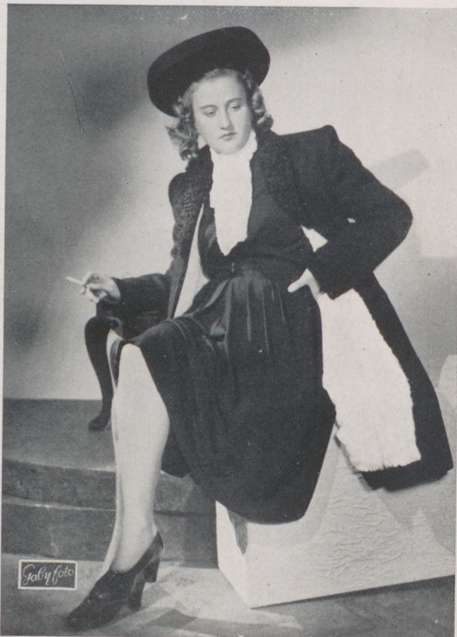
Fekete szövetruha, kabát fehér szőrmével bélelve, gallér perzsából.

A pesti társaság elegáns dámái között állandó szóbeszéd tárgya mostanában, hogy milyen kitűnően sikerült Gács Rózsa új őszi és téli kollekciója. Gács Rózsát nem kell felfedezni a divat iránt érdeklődő pesti hölgyek számára. Régi,