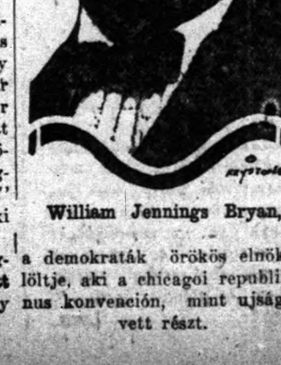
William Jennings Bryan