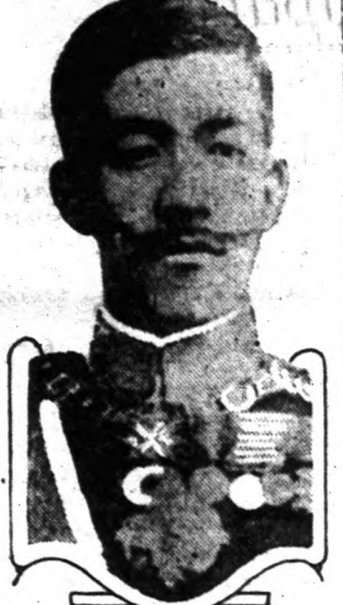
Yoshihito japáni császár.