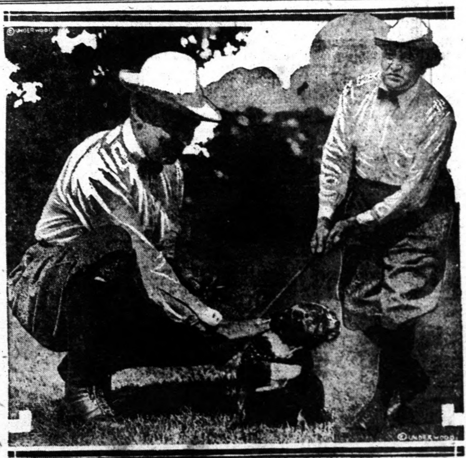
Harding szenátor a golf-pályán.

Egy tekintetben mégis hasonlít Wilson elnökös, a republikánuspart reménye: Warren G. Harding szenátor, az elnökjelölt. Ő is szenvedélyes golfozó.