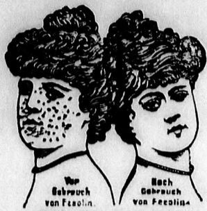
Millió hölgy használja a