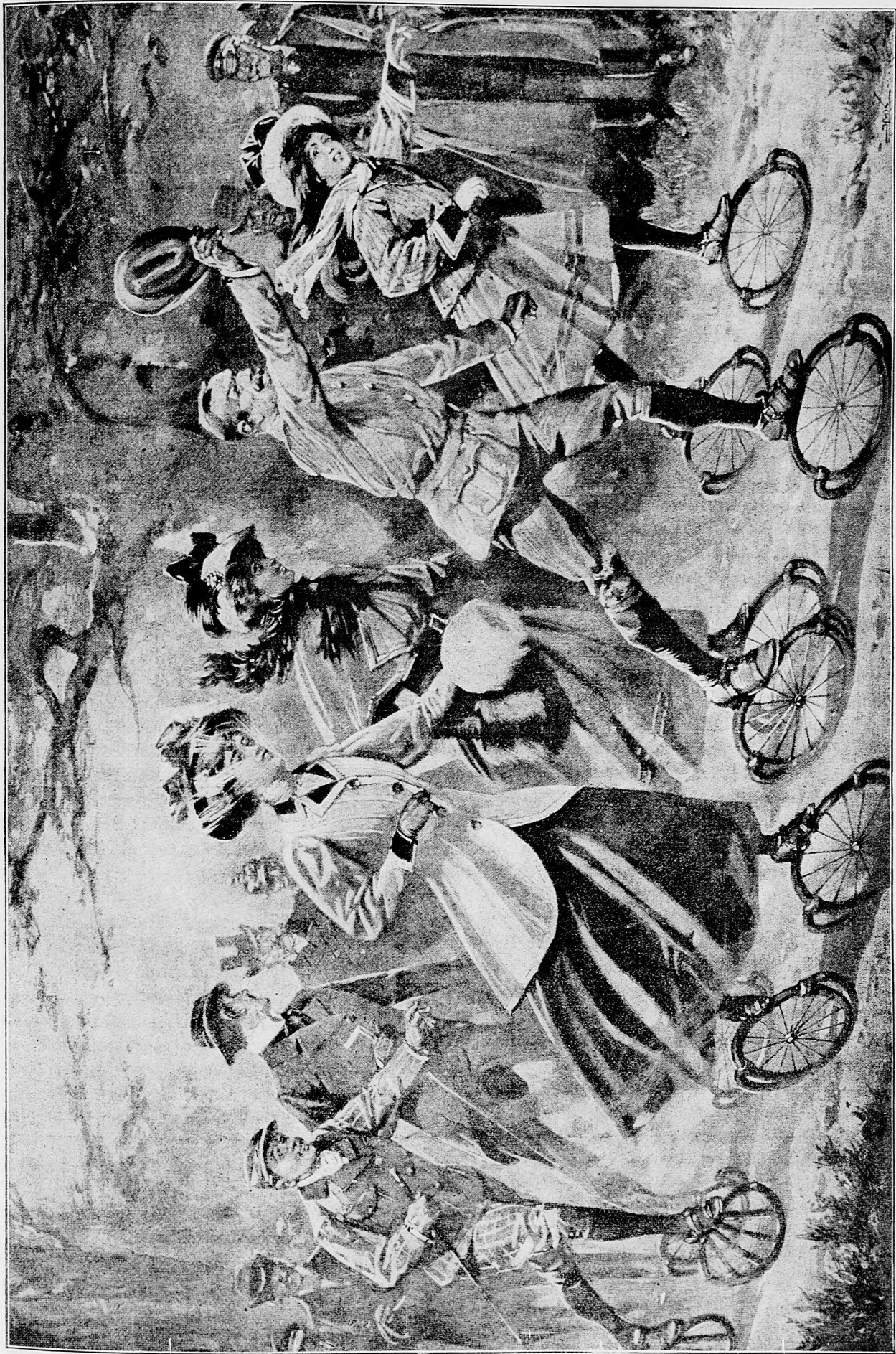
Nové dielo umenia.