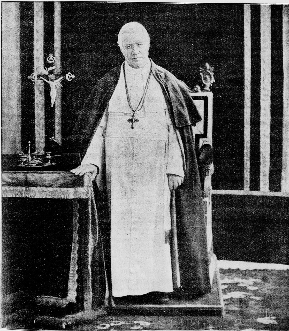
Jeho svätosť pápež Pius X. z príležitosti zlatej omše.

Budapest, IV. ker., Ferencz-József-rakpart 27. szám. Sem sa majú posielat' predplatky, jako dopisy do novin ohlásky a náhodné reklamácie. Cena jedného 5 stípcového nonpareill riadku 80 hl. Rukopisy sa naspak nedávajú.