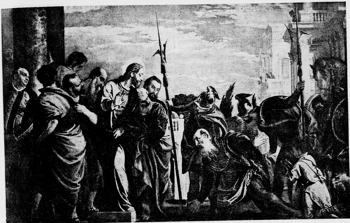
Ježiš a kafarnaimský stotník.

— Pán majster, prosím vás, dajte mi pokoj s takými rečami. Ja som sa katolíkom narodil, bol by som