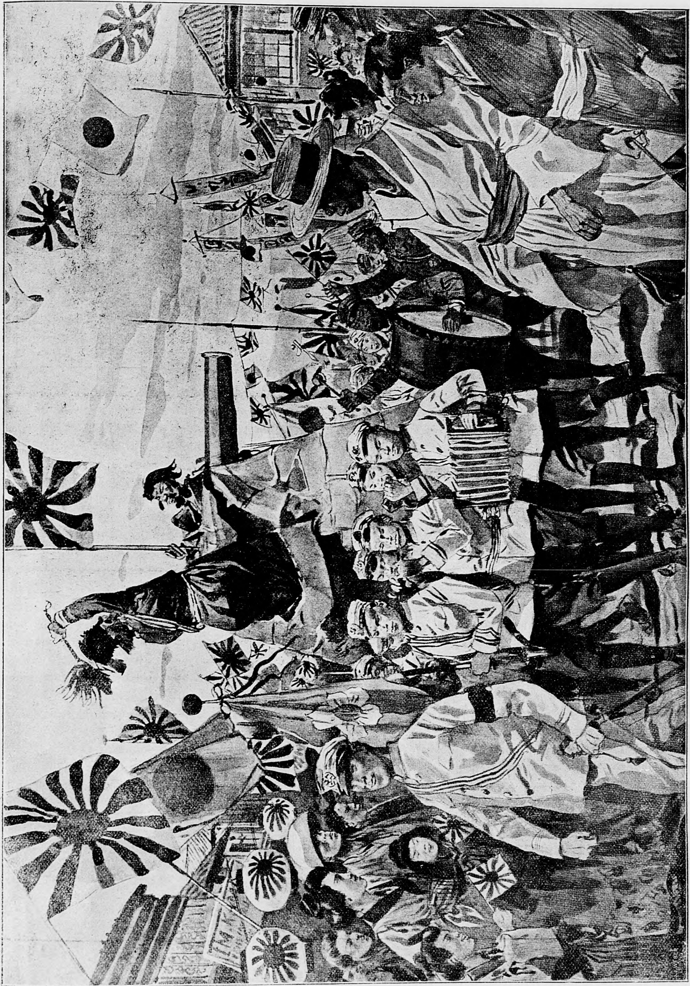
Vítězoslávny pochod Japonců.