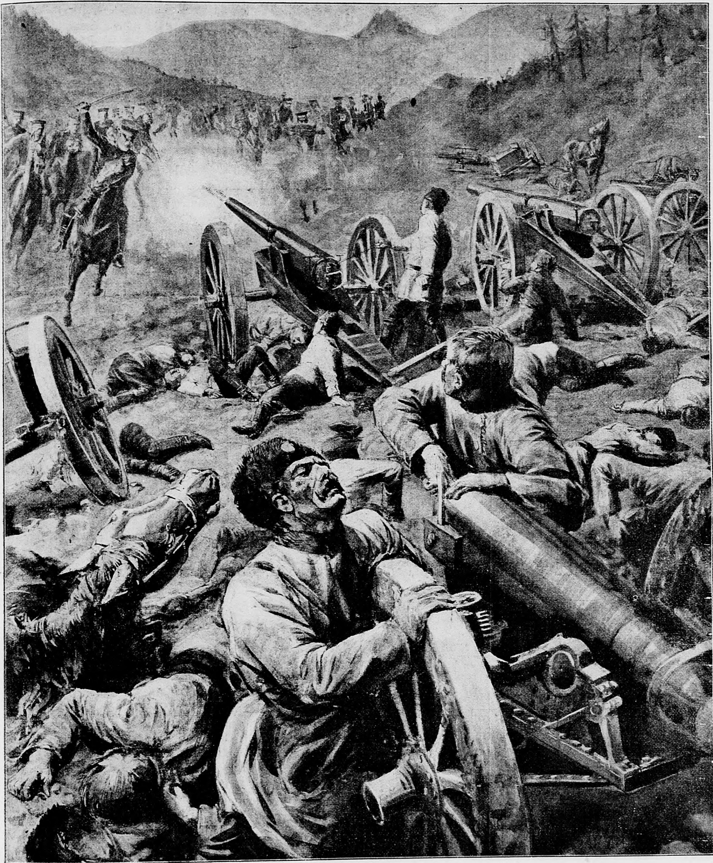
Z rusko-japonskej vojny. Útok japonských husárov proti ruským delám.

podívať. Nuž jakže? Vezmite ju?» — «Ona je nie pre mňa.»