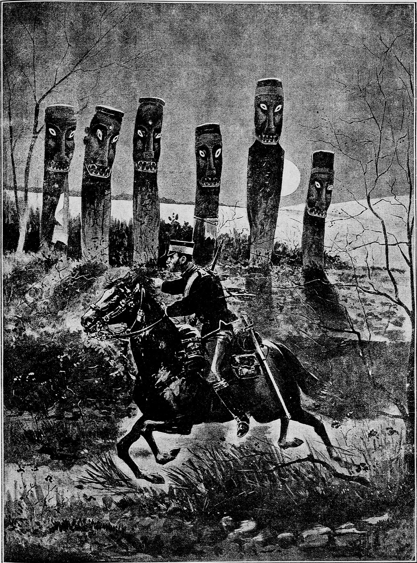
Japonský jazdec na šephúnskej ceste.