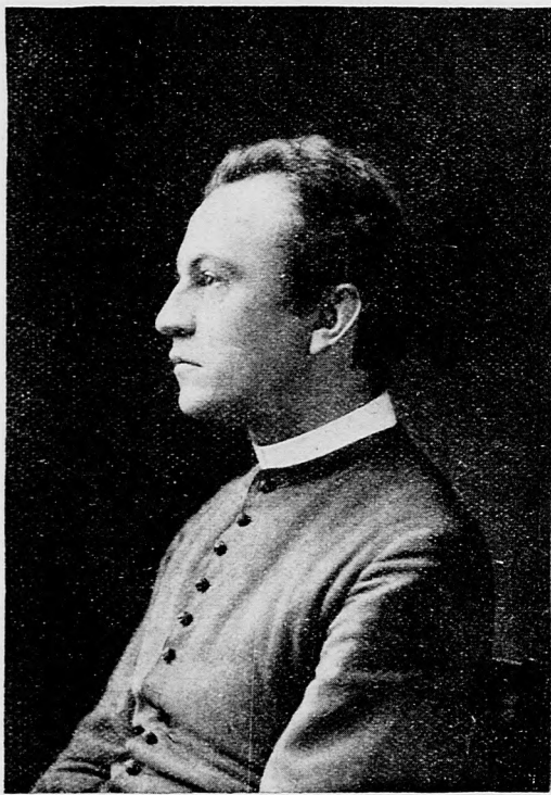
Dr. Ottokár Prohászka. professor ostrih. theologie.

Do včulku 18 millionov korún dostával kráľ náš. Polovicu my, ostatok Rakúsko platí. Tak značná summa, že zaokryť možno s ňou výdavky panovníka. Od včulku ale o 2,001.497 korún viac dostane.