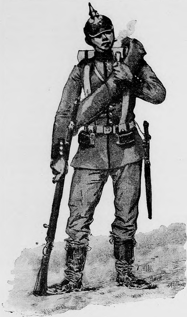
Nemecký (pruský) infanterista.

kalo od kopyta počnúc až po šidlo, a lápsik bol najviac zamestnaný a rozpajedené šidlo raz tak skočilo ujšejnej do chrbtovej lopatky, že sa jej zapichlo ako do dasky a ja som myslel, že švagor ide na ňom draťvu súkať. A veru sa mi aj to nijak neľúbilo, keď švagor na kordovanských čižmách pre sedliačky ránce robil so zubami, a pri tom vždy odplúval a ztratené sliny so slivovicou doplňoval. — Raz ma vzal švagor švec na jarmok do Seredy aj s tovarišom, ale mi aj nohy povyfahovali náležite, tak bežali; vtedy som už rozumel tomu, že: «čo tak bežíš ako švec na jarmok», aj mi vtedy prišla tá pesnička na myseľ: «vandrovali ševci z Nitry do Levíc, jeden nemal čižiem druhý nohavie» atď.