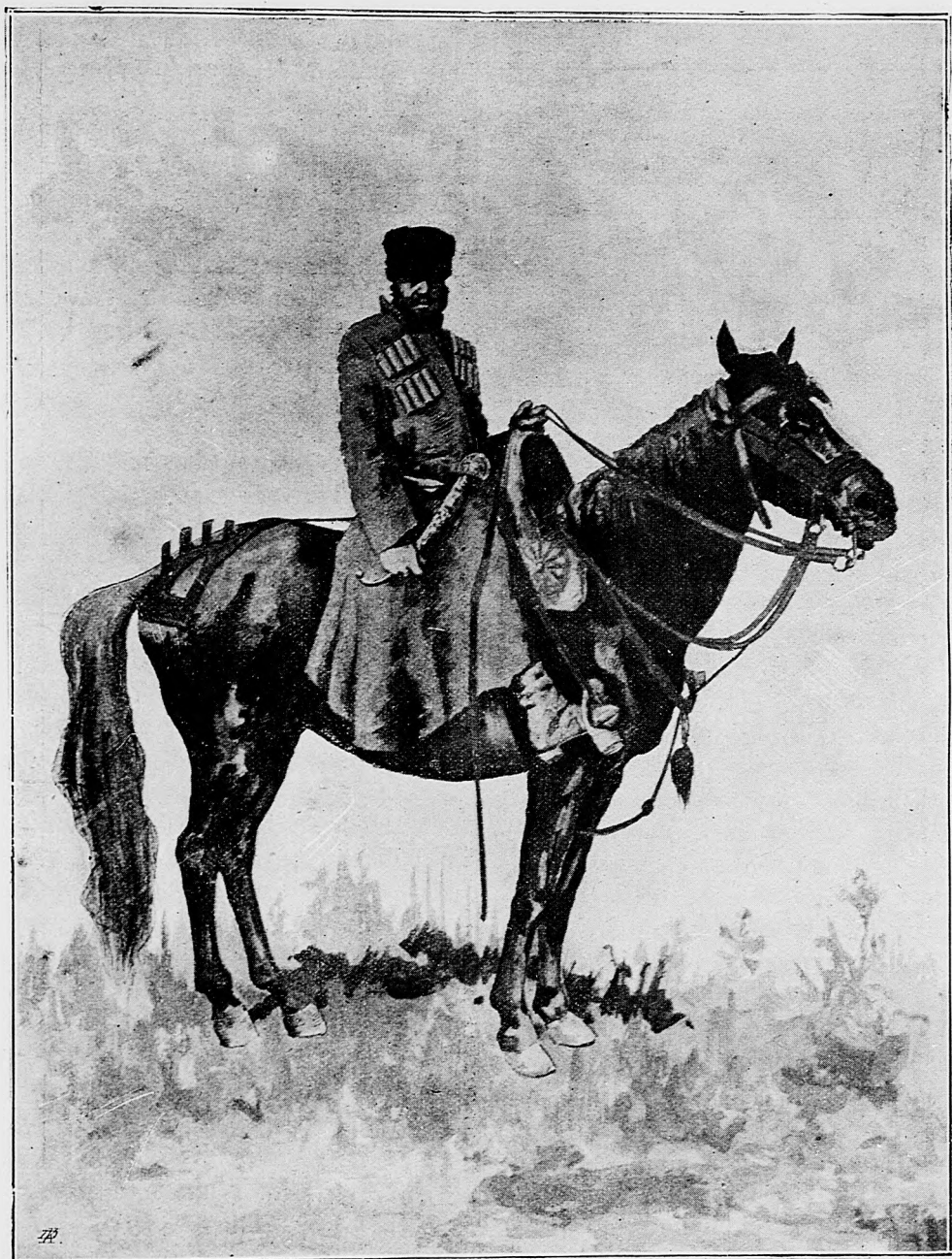
Ruský vojak na koni.

kých miest, alebo ku takým ľuďom, kde obrázaš Pána Boha, alebo keď si pyšný nielen na všeličo, ale ešte aj na tie biedné nohy, ktoré sa vláčia po blate a po hnojoch a iných smradoch: tu Boh takú spravi ruku šustrovú, že ona tebe tak úzke a krátke prikroji čižmy, že od boľasti tebe aj chuť prejde sa vláčif tam, kde ňa neni treba a máš hned aj pokánie za pýchu, si prinútený od boľasti