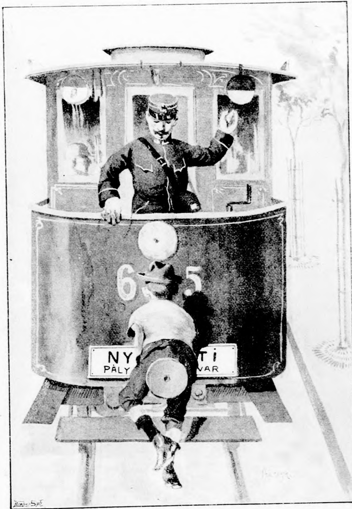
VILLAMOS KALAND. (Lásd a 103. lapon.)

1903. augusztus 16-án. Ára negyedévre 2 kor. Egyes szám ára 24 fillér. Megjelen minden vasárnap.