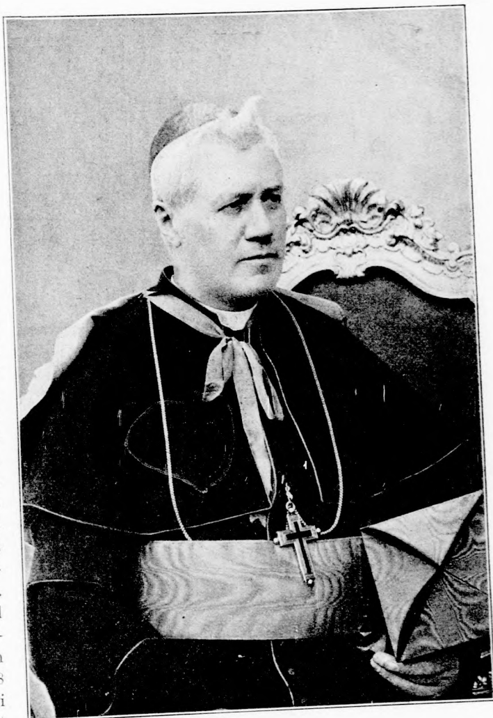
X. PIUS, AZ UJ PÁPA.