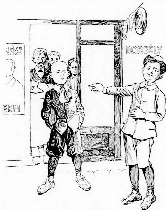
... KACZAGÁSSAL FOGADTA. (Lásd a 211. lapon.)

— Jaj de csip! Kimarja a szemem! Megvakulok!