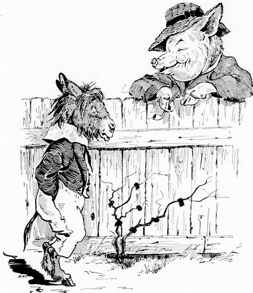
RÖFFENCS ÁTSZÓLT A KERÍTÉSEN.

le Füleske a küszöbre s keservesen sohajtozott egész estig. Még soha sem volt ilyen rossz napja, de nem is felejtette el. Jóra-