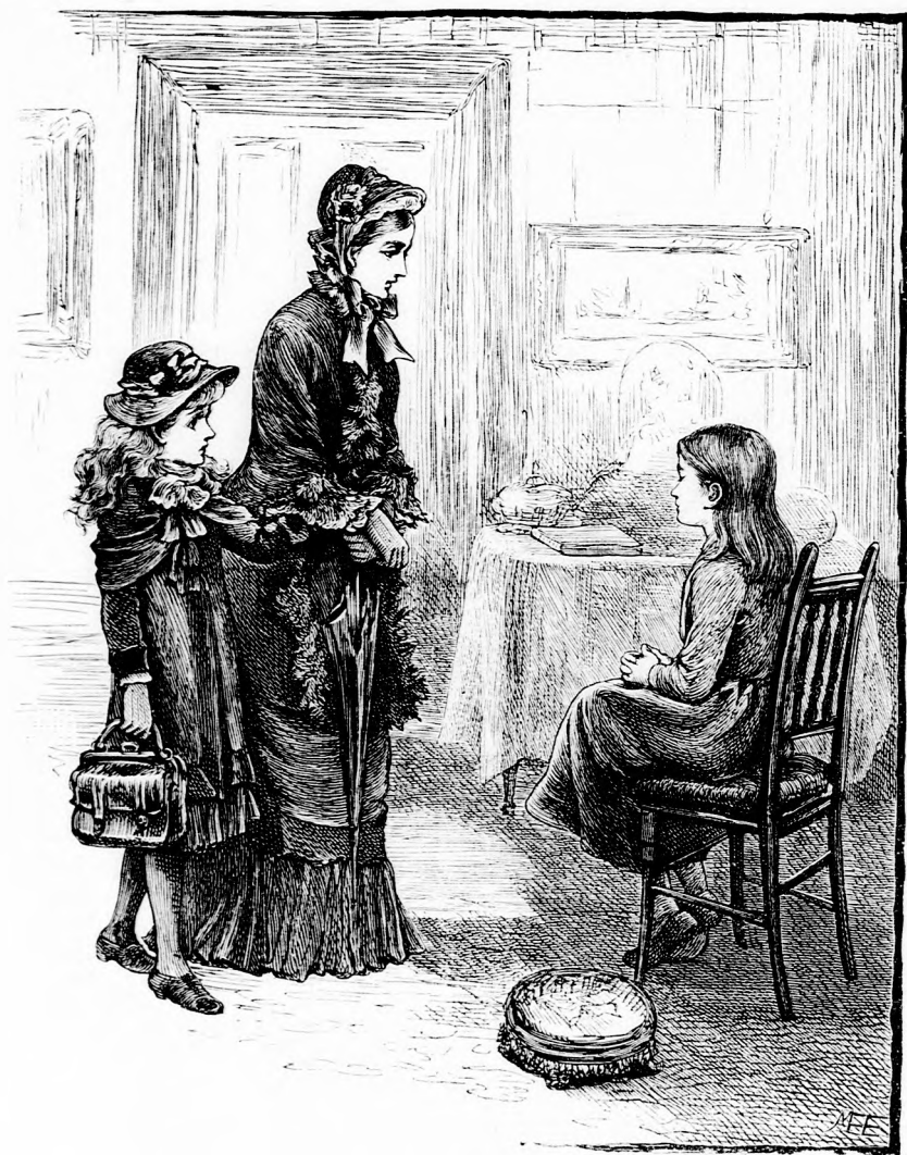
Duzzogás. (Lásd az 53. lapon.)

zán elkényeztetett leány volt s a tulságo- san gyöngé anya világért sem akarta volna megbántani.