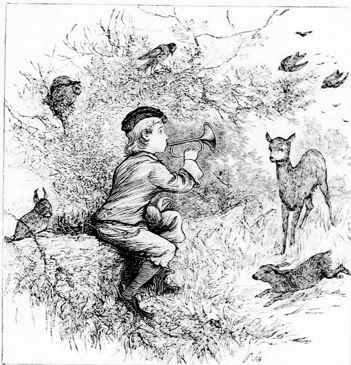
... A KÜRT HANGJÁRA HOZZÁ JÖTTEK. (Lásd az 59. lapon.)

a nagy hegy felé közeledjenek, melyet haldokló nagyatyjok mutatott nekik. Már rég elmúlt dél, mikor végre Ilonka annyira kimerült, hogy nem birt tovább menni; hiába támaszkodott bátyja kar- jára, utoljára is összeroskadt, végig feküdt a fűvön. Levente gondolkozott, mitevő