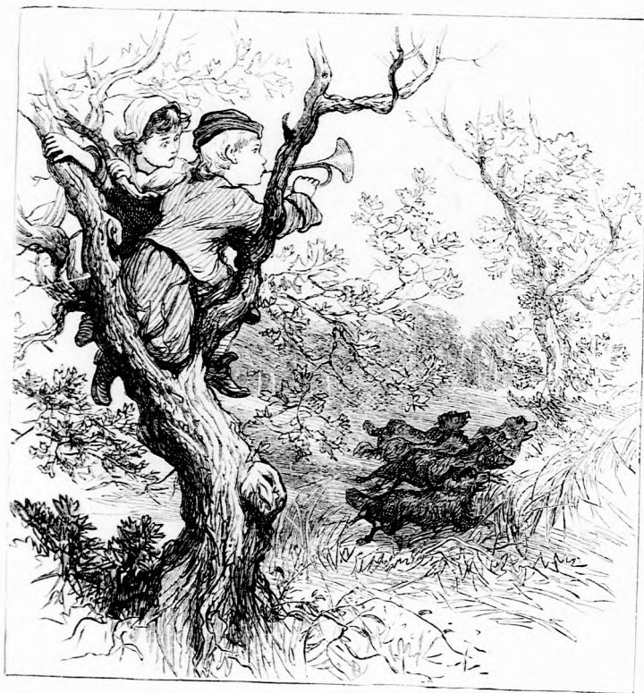
...BELEFUJT. (Lásd az 58. lapon.)

Levente átvette és keblébe rejtette az ezüst trombitát. Az öreg pedig hátradőlt és halk hangon mondá :