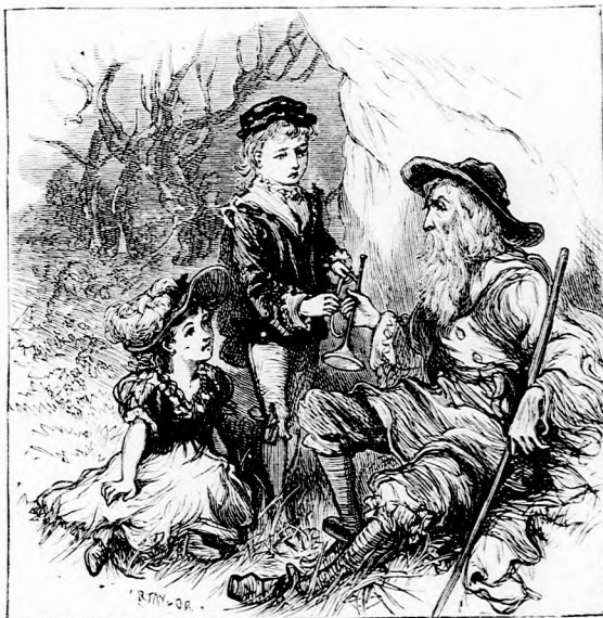
... ODANYUJTÁ A FIUNAK.

— Fogd e kis trombitát. Ez régi kincse családunknak, egyik ősrünk szerzte messze a szentföldön. Őrizd gondo-