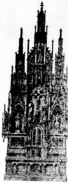
Nemetprónal templom főoltára 1907.

= képfaragó, oltárépítő és aranyozó = templom művészeti műterme