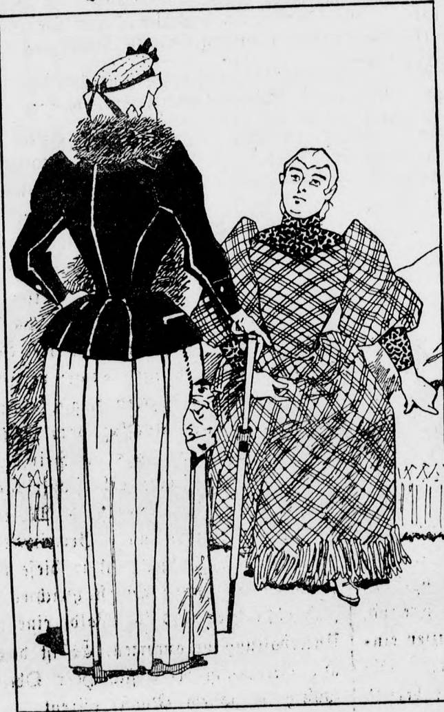
Jenseits des Niemen.

„Nun, Mamika, Du hast Dir so wohl den Nikolaus zum Mann genommen, bist Du denn glücklich mit ihm?“ „O gewiß, überglücklich! — Denke Dir nur, gestern hat er mich schon zum erstenmal geküßt.“