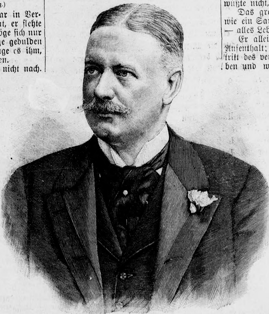
Bernhard v. Bülow.

„Ich weiß wirklich nicht, wie es kam,“ sagte sie lachend, „ich war rein aus Hand und Band vor Vergnügen — küßten Sie mich oder ich Sie? Doch wohl Sie mich . . .“