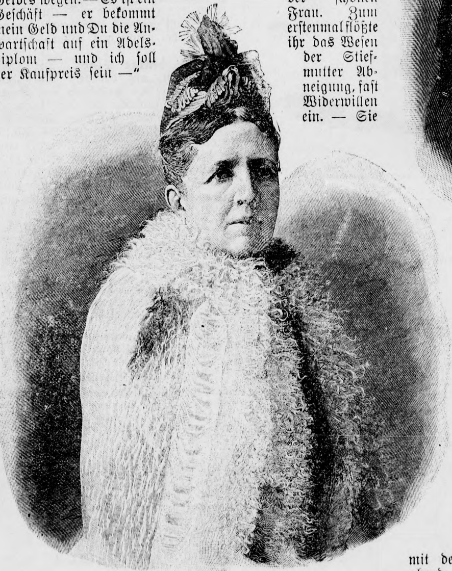
Königin Sophie von Schweden und Norwegen.

Kartoffelbrei wird bergartig aufgebäuft, glatt gestrichen, mit brauner Butter begossen und entweder mit einem beliebigen Muster von gebratenen Zwiebeln belegt, oder mit winzigen gerösteten Semmelwürfeln bestreut.