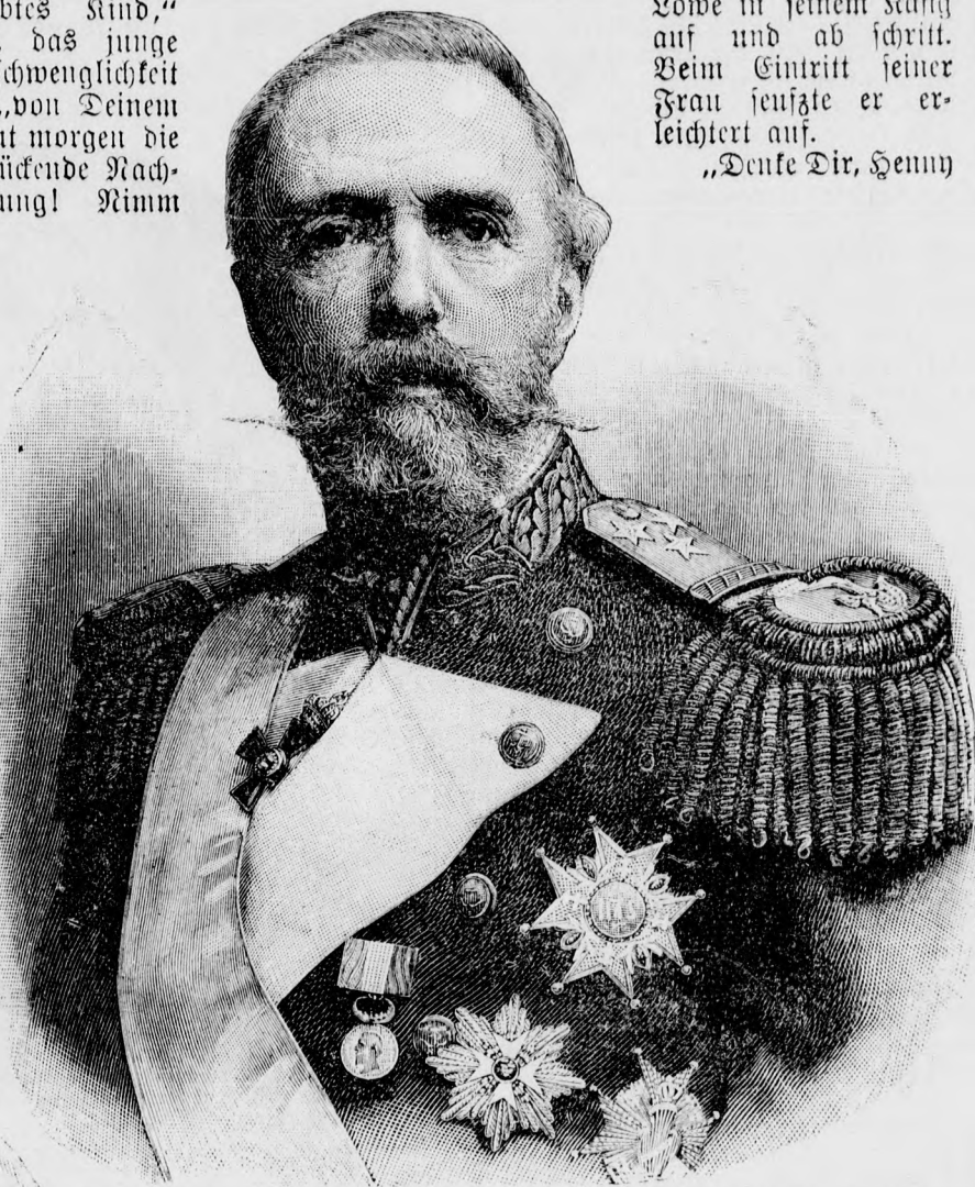
König Oscar II. von Schweden und Norwegen.

begriff plötzlich nicht, daß sie dieser Frau hatte Vertrauen und Zuneigung entgegenbringen können.