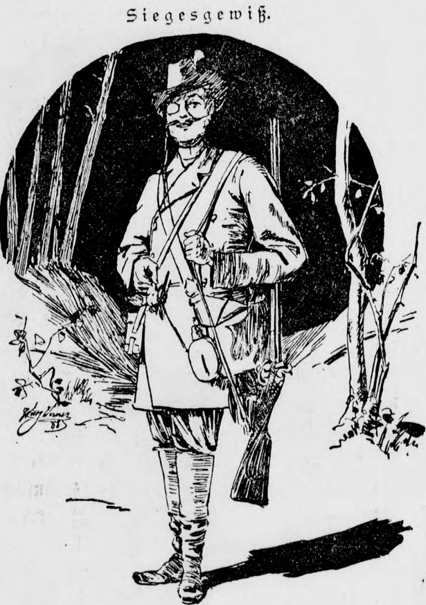
„Ich nehme gleich eine Jagdtasche mit, denn für die Herzen, welche mir heut entgegenfliegen, genügt mein eigenes Herzkammerlein ganz sicher nicht.“

Eine billige Stadt. Die Insel Manhattan, auf der jetzt die Stadt Newyork steht, verkauften im Jahre 1668 die Indianer an die Europäer für 10 Hemden, 30 Paar Strümpfe, 10 Gewehre, 30 Kugeln, 30 Pfund Pulver, 30 Beile, 30 Kessel und eine kupferne Bratpfanne, und beide Teile glaubten, einen guten Handel gemacht zu haben. Jetzt ist der Grund und Boden nach der Steuereinschätzung 1200 Million Dollars wert.