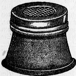
Figur 1. Preis per Stück Kronen 2.—

Patente in den Kulturstaaten angemeldet.