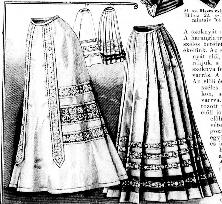
Blúzhoz vagy kosztümhöz való szoknyák.