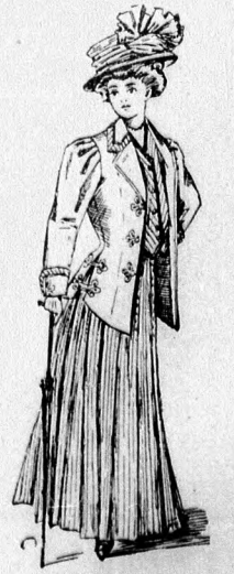
55. sz. A 80. sz. eleje.

57. sz. Kabátosruha. Anyag a szoknyához: 5 1/2 m. hosszú, 85 cm. széles egyszínű santungselyem; a kabáthoz: 5 1/2 m. hosszú, 54 cm. széles kockás santungselyem; 3 m. hosszú, 15 cm. széles csipke; 7 tuca gombforma; 1/4 m. vaszon. Csinos mintánk a legutolsó divatújdonságot mutatja be. Díszítetlen nyers santungselyemből készített harangszoknyából és egy ugyan- olyan zöld kockás reszut fektetett santungselyemkabátból áll. A divat ezen öltözettel igen sok változatosságot enged meg. Szép nyári ruhát kapunk, ha fehér vaszon, vagy pedig tarka mintázatu kretonból varrt kabátot készí- tünk a minta szerint. A kissé uszályos szoknya, mintegy 12 cm. magasán, miderszerűen nyulik fel. A nagyon lebbnyes kabát az első, erősen lekere- kitett és harangalaku előli részek, keskeny, rövid, a miderborító mellény- részekre fekszenek, a melyeket csipkezsabó takar, az előli részek alsó sar- kait visszagomboljuk. A második, rövid, előli részt láthatóan az elsőre gomboljuk, épp úgy az oldalrészt az előli részekre és a második hátrészt az első hátrésre gomboljuk. A lehajtott magas állógallért zöld vászonpánt határozza. Hasonló pánt díszíti a hosszú szűk sonkaújjakat. A végét csipke szegélyezi. A díszet gombok és finom vaszonzhengerből varrt gomblyukután- zatok egészítik ki.