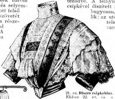
21. sz. Díszes csipkeblúz. Ehhez 22. sz. és a mintaiv 76b. fig.

két öltéssel többszörösen letűzzük. Az elől kapesos bélésderekát elől és hátul a 97. és 98. fig. szerinti betéttel borítjuk. Az előli betétet az állógallérral balra átkapcsoljuk. A betétet hosszszegélyekbe varrt batizstból készítjük és két tisztán beékelt valenzien csipkebetéttel díszítjük. Oldalt s az alsó szélén recsecsipke díszíti, ez alatt elől még egy recedisz van. A szegélybe varrt batizst állógallért valenzien csipke határolja. A mintánk felsőszövetét a barna és világoskék három árnyalatából választott zsenília és selyemhímzés díszíti, mely a belőle szabott felső ujjakon folytatódik. A derék felsőszövetét a 99a. és b. fig. szerint szabjuk, a részeket a kiszabás előtt a hasítékvonal mentén A-tól B-ig egyesítve. A felsőujjat a rövid varrás kidolgozása után, kereszt és pont szerint felnyúló ráncba rakjuk. Az előli és hátsó betét vonaljelzése szerint ráerősítjük a derék felsőszövetét s az alsó szélét elől ráncolva, a bélésderékra varrjuk. De itt ügyelnünk kell, hogy a derék felsőszövetét oldalt, az ujjak alatt