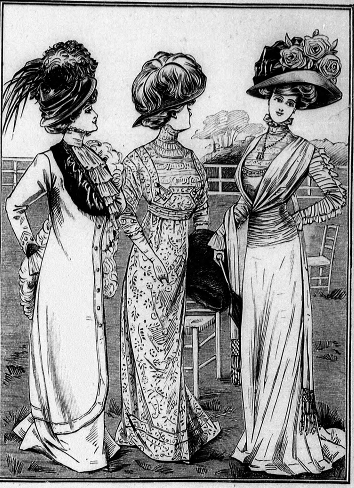
52-54. sz. Legújabb párisi öltözetek a longchamps-i lóversenyről.

szep structollak díszítenek. A magas fejrész háromszorosan bársonyszalag veszi körül, a melyet elől ostingós szőtfigura erősít meg. A 48. sz. „Charlotte” formájú kalapnak oldalt kissé felhajtott harangalaku karimáját fehér szalmafonatból készítjük. Magas tetejét barna santilli túllból készítjük, fehér sifonalapra. A díszet virágfüzér képezi, melyet oldalt fehér köcsag egészít ki. 50. és 51. sz. Látogatóruha. A világosan hűszínű fehér pettyes gyapjuszövetből varrt célszerű ruhát sötétebb hűszínű paszománt díszíti. A magas miderbe felnyúló tunikás szoknya szabadon borítja a belés-zoknyát, a melynek felső széléhez halcsonttal megerősített szerűen átnyulik balra. A szoknyát hátul kapcsoljuk, elől oldalt szövetzselű paszomántgombok díszítik. A hátul kapcsolás belés-derékát szegélybe varrt mély túll- és csipkevállpánt borítja. Ehhez hasonló az állógallér is. Hasonló anyagból készülnek a szűk, csupán sifonra dolgozott haránt ráncolt ujjak, a melyeket a belésderékba varrunk. Ezt a felső közepén húzott felső-