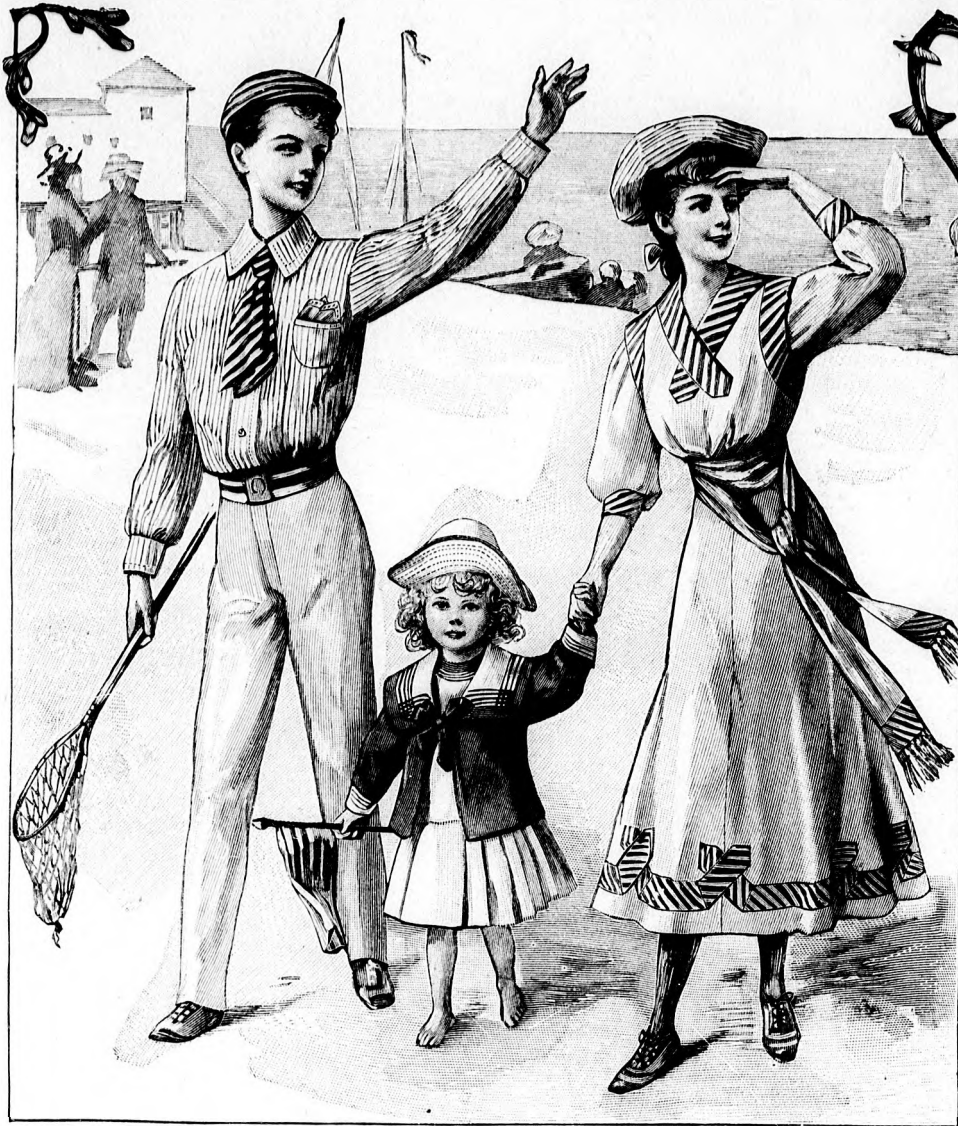
13. sz. Sportöltöny 13-15 éves fiúnak.