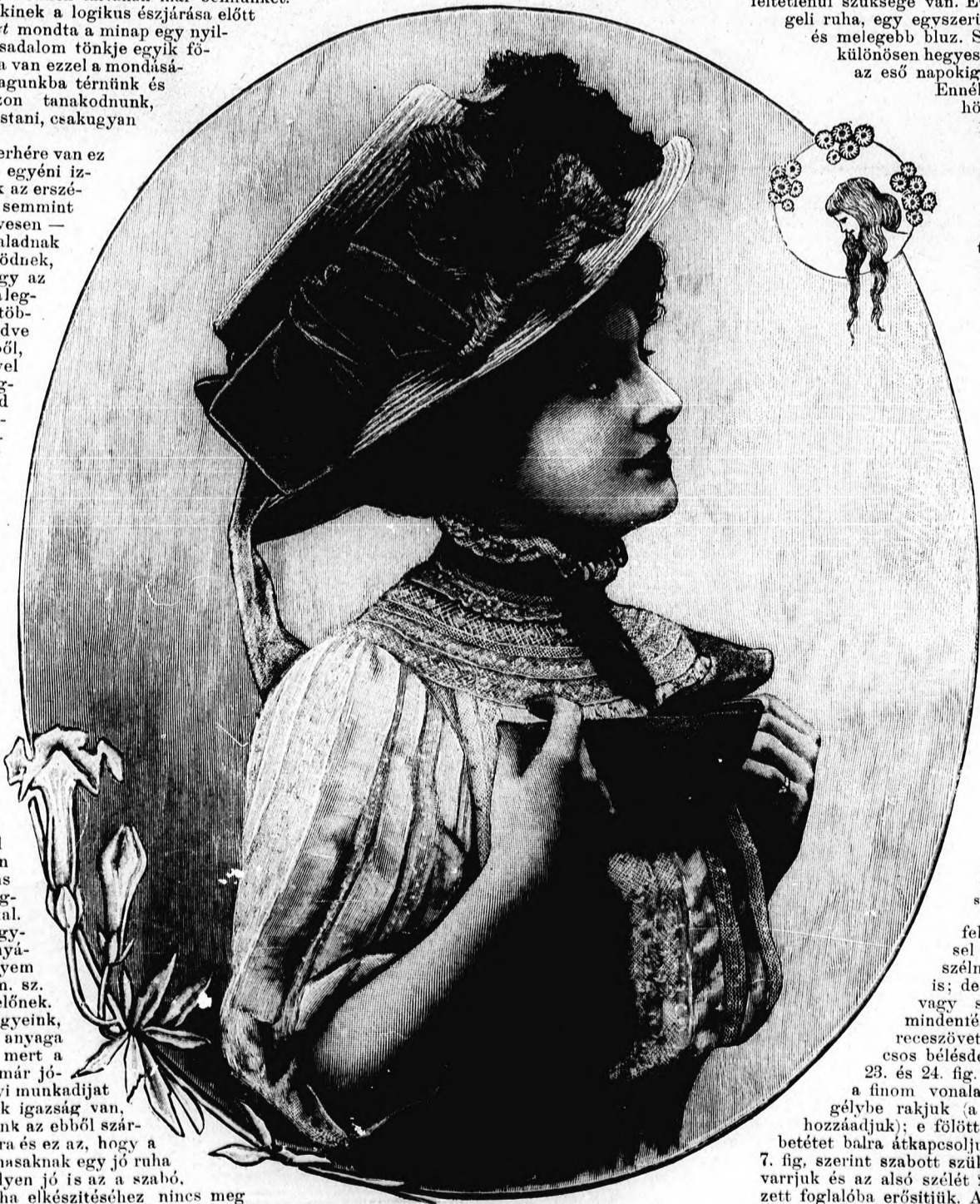
1. sz. Nyári kalap fiatal hölgyeknek.

Anyag: 9 m. hosszú, 85 cm. széles fehér batizt; 9 m. hosszú, 9 cm. széles himzett galon; 2 m. hosszú, 50 cm. széles (világos barna) libertiselyem. A nyár derekára való célszerű fehér batizstruhát angol himzés-sel díszítjük. Mintánk alkalmas szélmintás szövetek feldolgozására is; de elkészíthetjük könnyű gyapju-, vagy selyemszövetből is, a melyet mindentéle selyemhimzéssel, vagy áttört receszövettel díszíthetünk. Az elől kap-csos bélésderekát a 21. és 22. fig. adja. A 23. és 24. fig. szerinti előli és hátsó betétet a finom vonalak között három haránt sze-gélybe rakjuk (a szövetet a szabásnál ehhez hozzáadjuk); e fölött himzett galon díszíti. Az előli betétet balra átkapcsoljuk. Ezután a mai mintáivánk 7. fig. szerint szabott szűk batizszujjakat a bélésderekba varrjuk és az alsó szélét 26 cm. bő, 12 cm. széles him-zett foglalóba erősítjük. A derék felsőszövetét, a belőle vágott felsőujjakkal, a 25a. és b. fig. adja, a mely része-