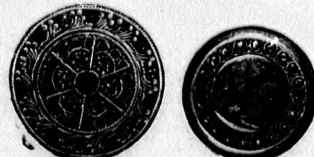
43-46. sz. Tarsoly, öv és díszgomb.