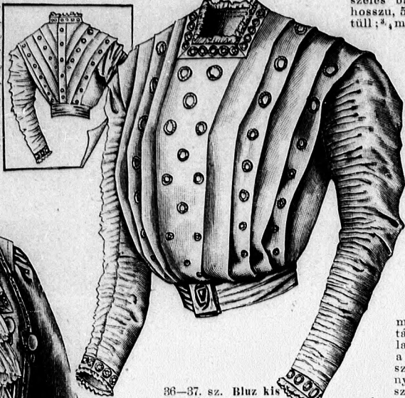
36-37. sz. Bluz kis kivágással és hosszú ujjal. Szab., magy. és a részek külön: mintáiv III. sz., 17-20a. fig.

illetve hátra és oldalt nyulva). A betétek az előli bevarráson egymást borítják, hogy a hátsó betét az előlit fedi. A betéteket géppel varrjuk egymásra s aztán a papírost könnyedén kivágjuk alóla. Hasonlóképpen készítjük el a 112. fig. szerinti ujjakat is. A betéteket a felső egyenes szélükénél fogva varrjuk fel. Minden varrást 1 cm. széles