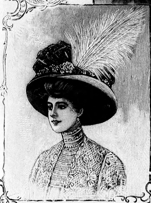
47-48. sz. Díszes nyári kalapok.

lérszerű felsőszövet elől kissé ráncolva a szoknya alá nyulik; hátul pedig díszgombokkal megerősítve borítja azt. 43-46. sz. Tarsoly, öv és díszgomb. A tarsolyt két fehér lilaszínű szőllel és hasonlószerű szőllel mintázattal díszített llinon-zsebkendőből készítjük. A 87 cm. nagyságú négyzetleves kendőket hosszában két, három és öt szegélyből álló haránt csoportba rakjuk. Főnt fehér szaruzombokon keresztül húzott lilaszínű szalag fogja össze. A japán-írósi övet, japán figurákkal tarkított fehér szalagból készítjük. A díszgombok közül a nagyobbikat oxidált ezüst utánzatból készítjük és tarka kövekkel díszítjük. A kisebbiket zománcolt zsánerkép van, szimlikövekkel körül rakva és sima aranyzólel. 47. és 48. sz. Díszes nyári kalapok.