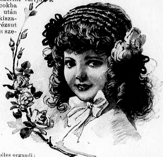
16. sz. Pántos fejkötő 2-5 éves leánynak. Szab.: mintaiv XI. sz., 76. fig.