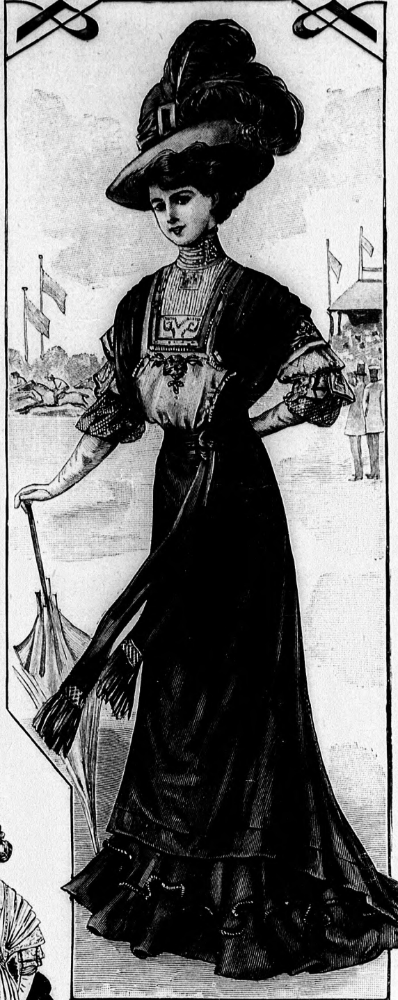
38-40. sz. Könnyű selyemruha (tunikás szoknya lüsderekek).

31. sz. Pántdíszes ruha. Anyag: 8 m. hosszú, 115 cm. széles fehér-fekete csikos markizett; 1/2 m. hosszú, 50 cm. széles fekete selyem; 3 1/2 m. h., 13 cm. széles fehér túll-csipke; 6 m. fehér és 6 m. fekete selyemsújtás; 5 m. arany sújtás; aranycsatt. A fiatalos ruhát ráncolt szoknya és bluzderék képezi. A kis rajz 82. fig. után vágott szoknyát kereszt és pont szerint ráncokba rakjuk, a melyeket a kis rajzon harant futó vonalig letűzzük, míg lefelé levasaljuk őket. Az alsó szélén két, egyenkint 4 cm. széles letűzött rézsut pant van. A 80. fig. szerint