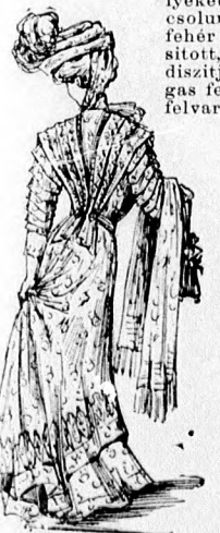
49. sz. A 32. sz. háta.

49. sz. A 32. sz. háta. Két részből álló, közepesen bő és kissé uszályos harangszoknyából vagjuk a ráncos miderrest. A szoknyát elől reszut varrjuk; ez ránc mentén egy-két haránt ráncba rakjuk, hátul kissé behuz- zuk és mell alatt a derékra varr- juk. A belésderék elől és hátul egy kis tisztán beékelte csipke vállpánt és állógallér díszíti. Csipke díszíti a könyökön alul- erő belésujjakat is. E fölött a belésujjakat két, egy szűkebb és egy bővebb csipkefodor díszíti. A fodrok szövetpántokkal végző- nek. A vállat szélesen borító gal-