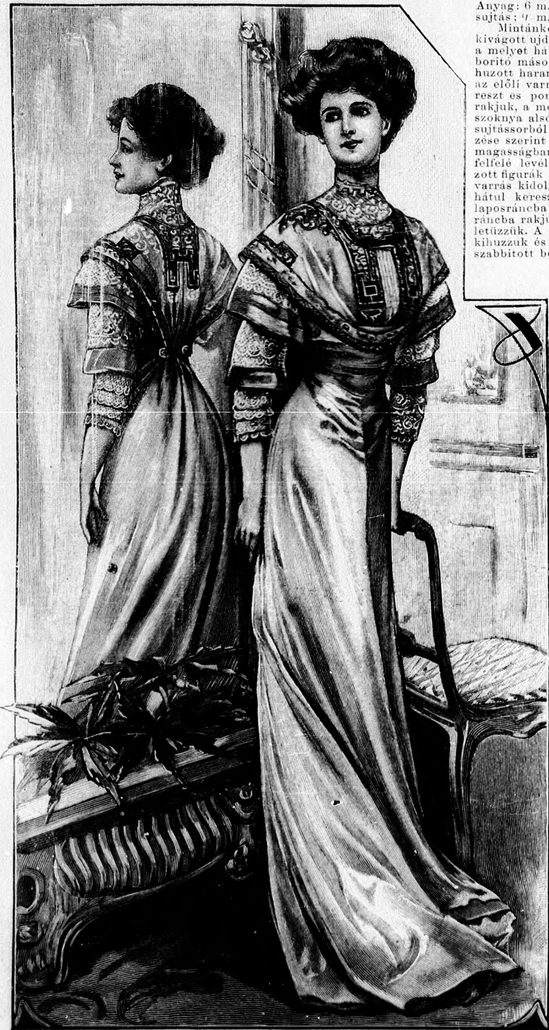
41-42. sz. Egyenszabott ruha (mideres harangszoknya, bluz derékka).

gyapjuszalag fed. 3 cm. széles gyapjuszalag-gal határolt vászonpánt a finomvonal jelzése szerint húzódik a kabát széle mentén (hátral közepen varrás nélkül). 27. sz. Ruha új divatu derékdíszszel. Anyag: 6 m. hosszú, 80 cm. széles basztelyem; 2 m. hosszú, 100 cm. széles vászon; 1/2 m. hosszú, 50 cm.