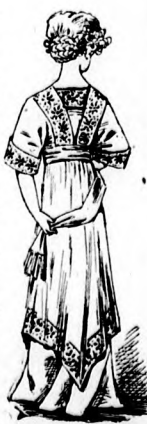
10-11. sz. Reformszabású nyári ruha. Szab.: mintái IV. sz., 21-27. fig.