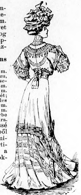
5. sz. A 25. szám hátképe.

varrunk a kis rajz 95. fig. szerint és pont szerint dupla laposráncba rakjuk, főt sűrűn egymásra illesztjük, úgy hogy négy-négy kereszt essék a közbeeső pontokra. A ráncokat az alsó jelig letűzzük, a fölösleges szövetet belülről kivágjuk. A szoknya felső szélén a ráncokat, a szoknyát meghosszabbító halsonttal megerősített s a 94. fig. után vászomból vágott miderrész felvarrásánál, kissé egymásra toljuk. Hogy a szoknyára dolgozott öv kellő hosszát, illetve csucos alakját nyerjük a 96. fig. után csupán papírból kivágott alapot a vászon miderrész alsó szélére illesztjük s az alap alsó szélét a szoknyán csak jelezzük. Ezt azután a miderrész felső szélétől a jelzett vonalig, 35 cm. széles, kissé ráncolt, az alsó szélén elől és oldalt erősen kinyújtott liberti részt csikkal borítjuk, a mely csik a zárást borítja, a hátsó közepén tul terjed és baloldalt csukódik. A ráncokat egy-