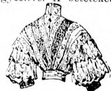
22. sz. A 21. szám hátkepe.

Nagyon csinos a betétekből készített bolero kabát, a mely a szintén betétekkal díszített tunikaszoknyával együtt szép nyári ruhát képez. Az utóbbi tetszés szerinti batiztblúzzal is viselhető. A szoknyát a kis rajz 109. fig. szerint szabjuk. A haranglapra az alsó szélétől 7 cm-nyire 6 cm. széles betétet és e fölött 3 cm. széles betétet ékelünk. Az előli varrás kidolgozása után a szoknyát elől, kereszt és pont szerint ráncba rakjuk, a ráncokat az alsó jelig letűzve. A szoknya felső szélén figyelembe veendő a bevarrás. A tunikát a kis rajz 110. fig. adja. Az előli és alsó szélé mentén tisztán beékelt, széles és keskeny betét húzódik a sarkokon, az alpnak megfelelőleg sarkokra varrva. A tunikát a hátsó szélén a pontozott vonal mentén, befelé behajtogatjuk. Az előli jobb szél kissé a balra nyulik, az előli közepet jelző vonal figyelembe vételével. Az oldalsó bevarrás kidolgozása után a tunikát a szoknyával együtt egy lényezőbe foglaljuk. A 111a. és b. fig. után vágjuk a kabát előli és hátrészét vékony, de erős papírból, a részeket a hasítékvonal mentén A-tól B-ig egyesítve. A betéteket erre ferceljük, hogy kissé takarják egymást a szabás részen áthuzódó vonaltól előre,