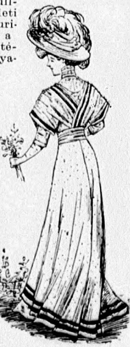
49. sz. A 32. sz. háta.