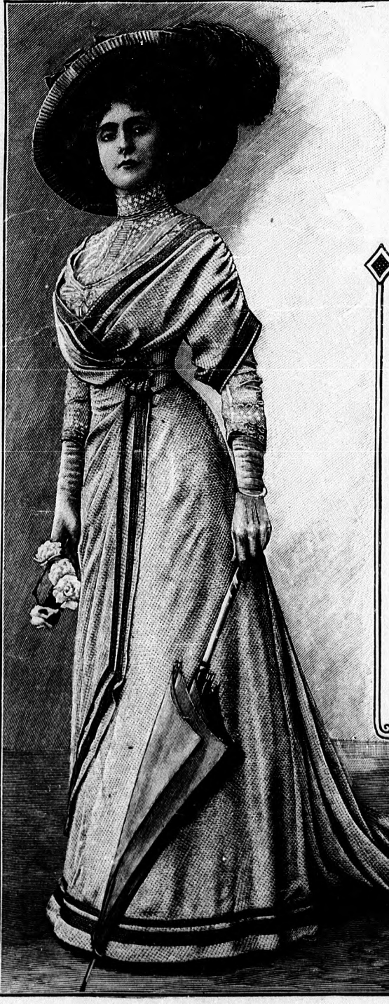
50-51. sz. Látogatóruha (tunikás mideresszoknya és bluzderék).

57. sz. Kabátosruha. Anyag a szoknyához: 5 1/2 m. hosszú, 85 cm. széles egyszínű santungselyem; a kabáthoz: 5 1/2 m. hosszú, 54 cm. széles kockás santungselyem; 3 m. hosszú, 15 cm. széles csipke; 7 tuca gombforma; 1/4 m. vaszon. Csinos mintánk a legutolsó divatújdonságot mutatja be. Díszítetlen nyers santungselyemből készített harangszoknyából és egy ugyan- olyan zöld kockás reszut fektetett santungselyemkabátból áll. A divat ezen öltözettel igen sok változatosságot enged meg. Szép nyári ruhát kapunk, ha fehér vaszon, vagy pedig tarka mintázatu kretonból varrt kabátot készí- tünk a minta szerint. A kissé uszályos szoknya, mintegy 12 cm. magasán, miderszerűen nyulik fel. A nagyon lebbnyes kabát az első, erősen lekere- kitett és harangalaku előli részek, keskeny, rövid, a miderborító mellény- részekre fekszenek, a melyeket csipkezsabó takar, az előli részek alsó sar- kait visszagomboljuk. A második, rövid, előli részt láthatóan az elsőre gomboljuk, épp úgy az oldalrészt az előli részekre és a második hátrészt az első hátrésre gomboljuk. A lehajtott magas állógallért zöld vászonpánt határozza. Hasonló pánt díszíti a hosszú szűk sonkaújjakat. A végét csipke szegélyezi. A díszet gombok és finom vaszonzhengerből varrt gomblyukután- zatok egészítik ki.