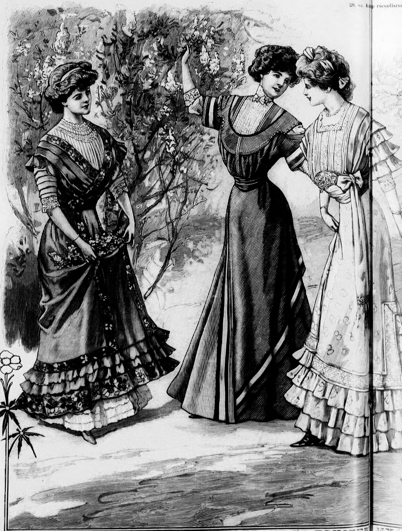
28. sz. Kép rózsaszínű

A praktikus fehér vászonruhát gyöngyfonállal kidolgozott, dús lapos és lyukacsos himzés, valamint hurkolás díszíti. Az alsószoknyát az április 1-én megjelent számunk 19. fig. szerint szabjuk s az alsó szélén három, egyenként 2-2 cm. széles szegélybe varrjuk, a szövetet (mintegy 12 cm.) hosszában hozzáadva. A tunikát a kis rajz 107. fig. adja. A szoknyát a felső szélén, hátul csillagtól behuzzuk és 3 cm. széles lényöbe foglaljuk, a melynek felső szélére varrjuk a hátul csillagtól behuzzott tunikát. A szegélybe varrt szövettől álló s a belésderekra varrt vállpántrészeket a finom vonalig a 108. és 109. fig. szerint szabjuk a belést a vállpánt alul tetszés szerint ki is vágathatjuk. Hasonló az álló-