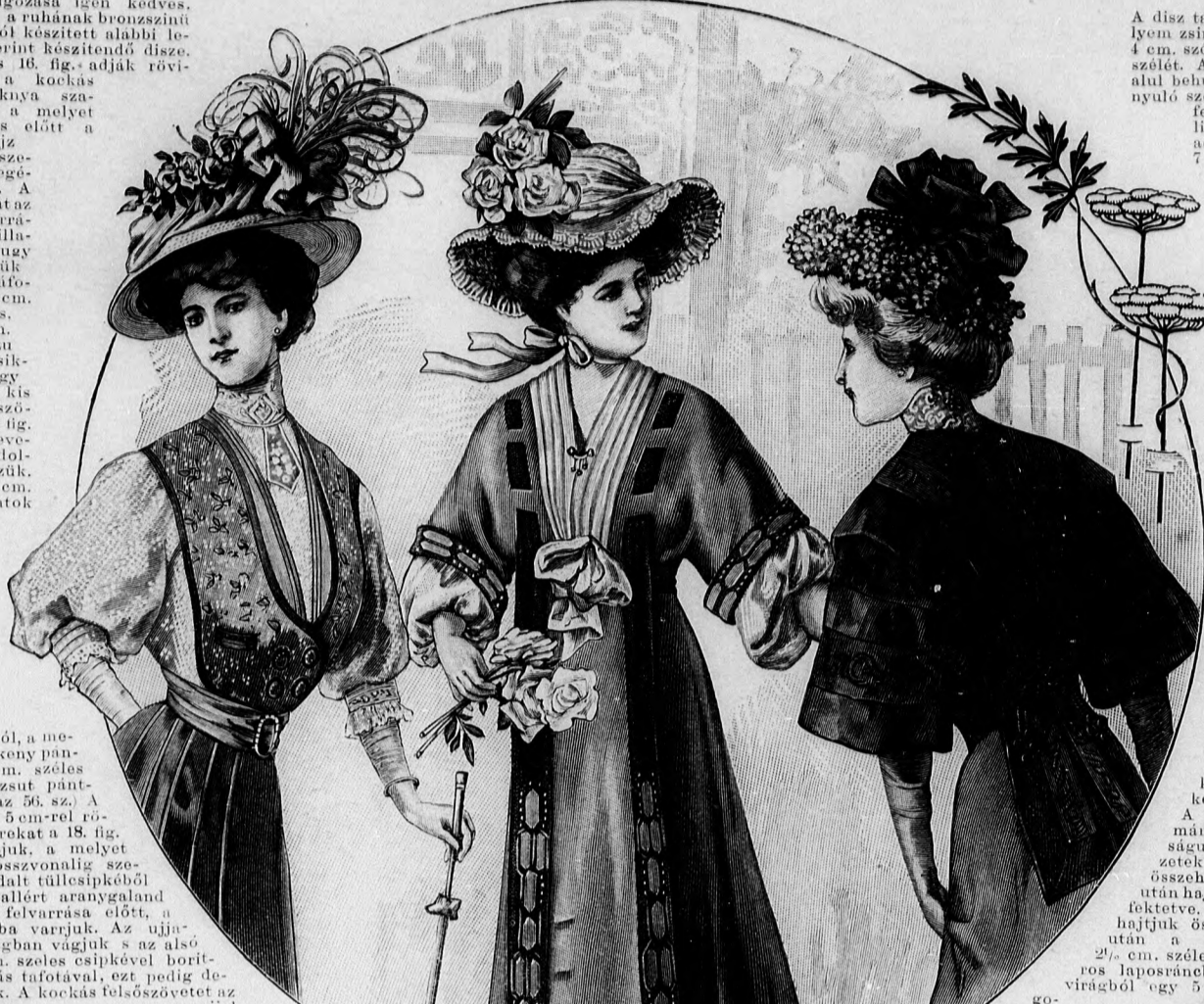
58. sz. Újszerű ruha bluzokhoz (berakott szoknya, bluz és ujjakból zsaket). A zsaket és szoknya szab.: mintaiv IV. sz., 21-23. fig.