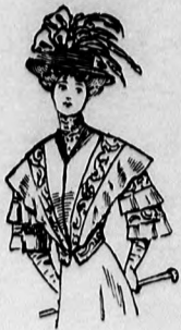
57. sz. A 60. sz. eleje.