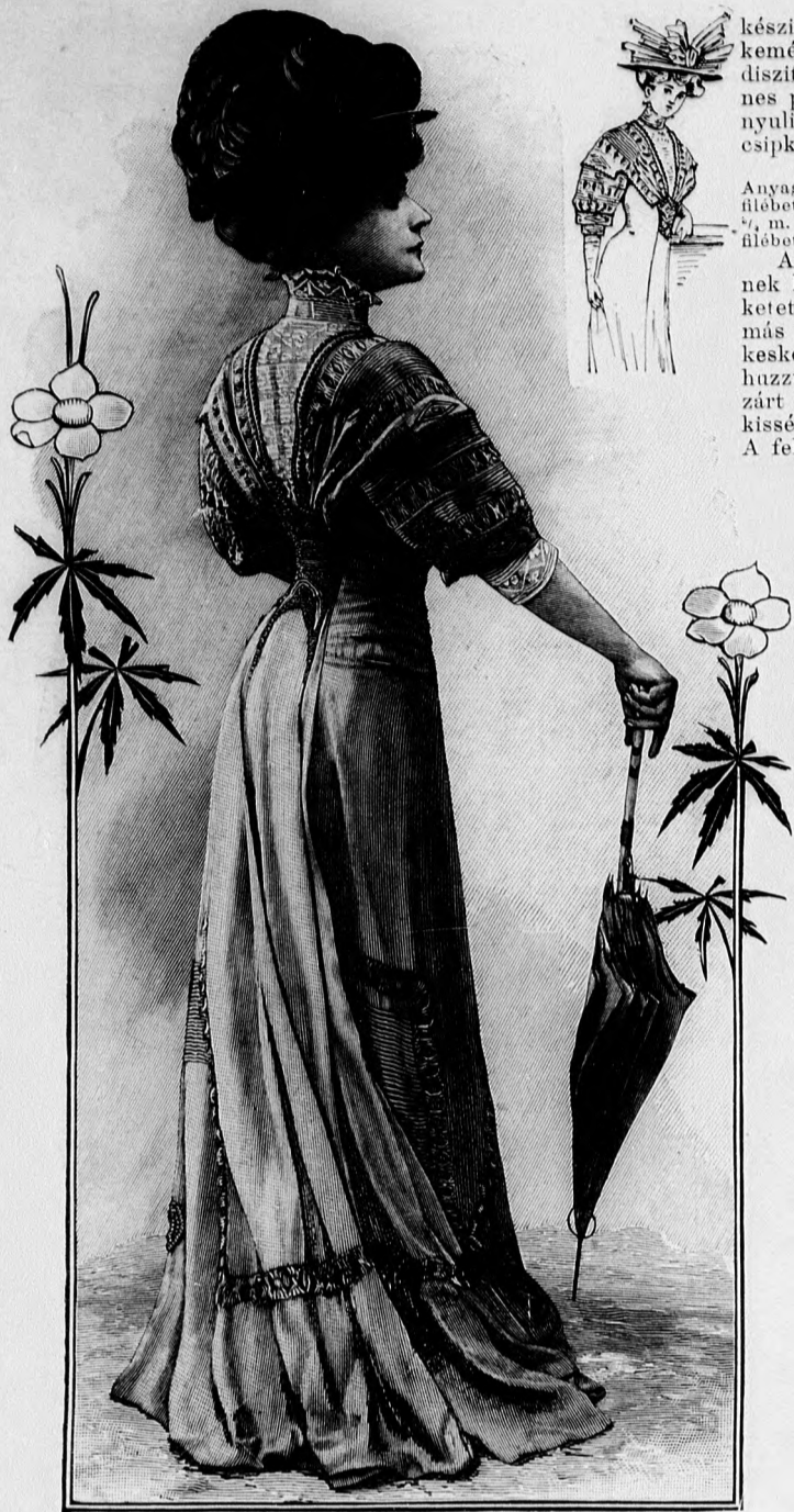
26--27. sz. Toilett különös formával.