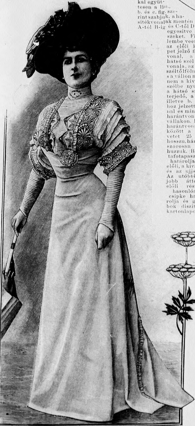
61. sz. Látozási ruha (míderes szoknya és elitőszíni bluz).