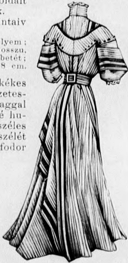
31. sz. Ruha fűdizszel fiatal hölgyeknek. Szab. és hátkép: mintáiv XVIII. sz., 94-100a. fig.