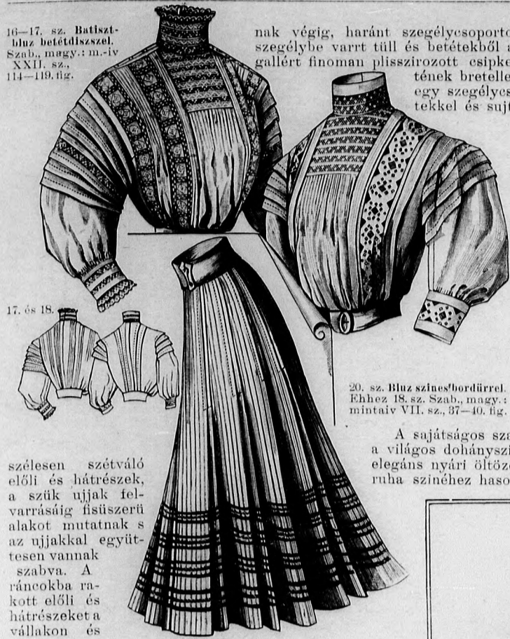
16-17. sz. Batiszt-bluz betétdíszszel. Szab., magy.: m. iv XXII. sz., 114-119. fig.

szélesen szétváltó előli és hátrészek, a szűk ujjak felvarrásúg fisűszerű alakot mutatnak s az ujjakkal együttesen vannak szabva. A ráncokba rakott előli és hátrészeket a vállakon és felsőujjakon behuzzuk s előli és hátul, hurkolt hasítékba foglaljuk. Az