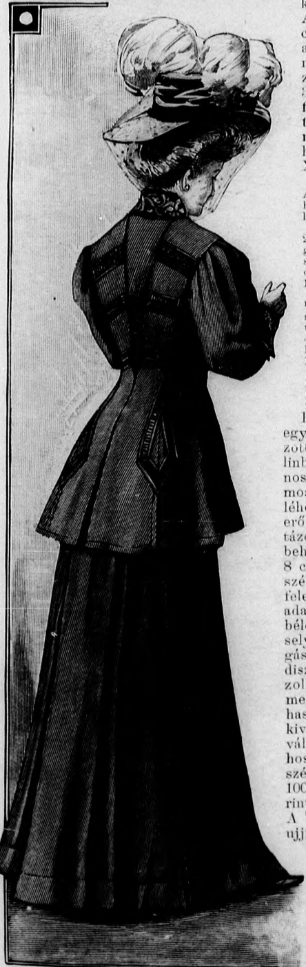
21. sz. Utazóruha (félj testhezálló zsaket és berakott szoknya). Ehhez 3. sz. Szab.: mintaiv XVII. sz., 81-93. fig.

nak végig, haránt szegélysoportokkal gazdagítva. A hátulzárt derekat szegélybe varrt túll és betétekből álló betét díszíti. Az ehhez hasonló állógallért finoman plisszírozott csipke határolja. Érdekes a derék felsőszövetének bretellenszerű díszje; a felsőszövetet a vállon egy szegélysoportba varrva, s a külső széléin betétekkel és sujtássorokkal határolva a mideres szoknyába illesztjük. A szintén szegélybe varrt csikokból és betétekből álló felsőujjakat a derékcszékkel együttesen dolgozzuk ki. A bélésderékba varrt és túlludorral kerített bélésujjak alsó szélét a betéthez hasonló, 15 cm. széles foglalóba erősítjük.