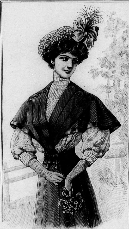
22. sz. Célszerű ruha bluzzal (berakott szoknya, bluz és vállravető). Ehhez 2. sz. A szoknya és a vállravető szab.: mintaiv IX. sz., 44. fig.

2-ig, hátul 3-tól 4-ig. A használható bélészetoknyához az alsó ruhát rozsdaszínű tafotából készítjük 5 cm. szélesszalaglénzőterősítünk, a melyet előli és oldalt, kis bevarrásokkal testhezállóra teszünk. Ehhez varrjuk a felső szélén előli, 1-től csillagig behuzott felsőszövet szoknyát. Ez utóbbit hátul baloldalt