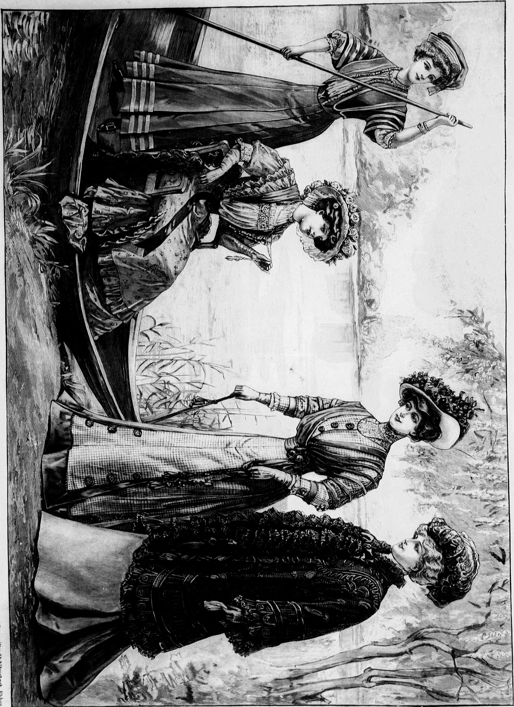
64. sz. Ötözet (berakolt szoknya, blúz és zakék) fiatal leányok. Utazásra, sporthoz stb. A szoknya és zakéké száma: mintatv VIII. sz., 41-43. fig.