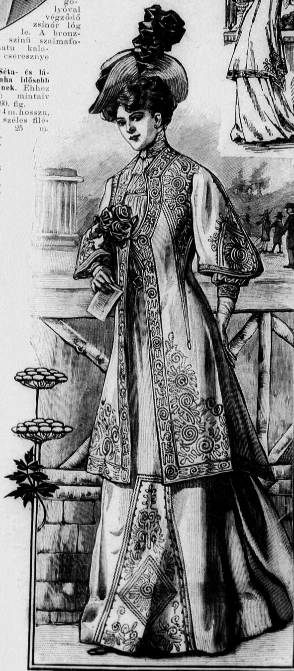
62-63. sz. Öltözet (négyrészből való harangszoknya és bő kabát) vaszonból. Gyógykúthoz való sétára, löversenyre, kirá- dulásra stb.