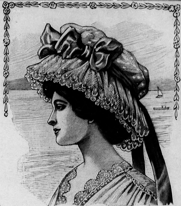
23. sz. Kerti vagy tengerparti kalap szalagdíszszel.

A sajtáságos szabása dacára egyszerű, de előkelő hatású a világos dohányszínű tafotából készített casagne. Világos elegáns nyári öltözékhez alkalmas, még pedig épp úgy a ruha színéhez hasonló, vagy ettől eltű színben. Az oldalt