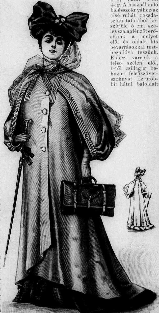
24-25. sz. Utazó- vagy porköpeny. Kis rajz és magy.: mintaiv XXVIII. sz., 157. fig.