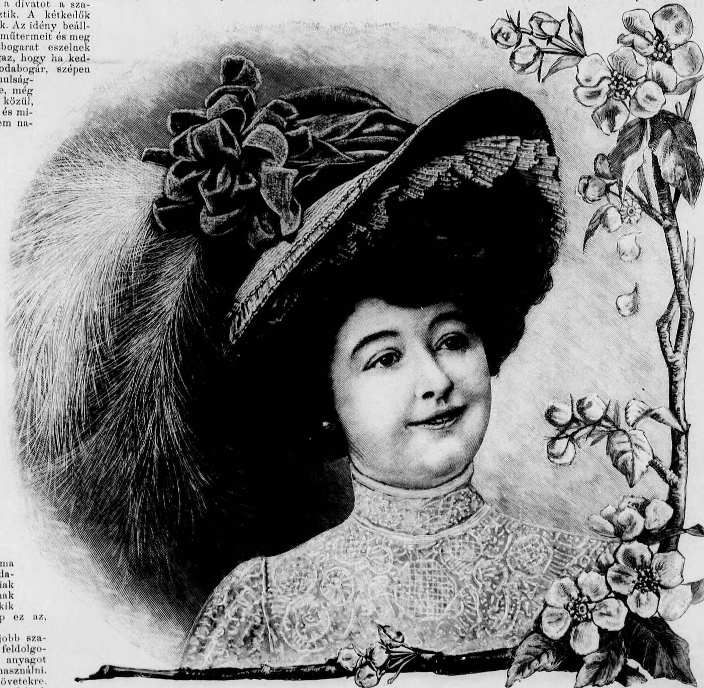
1. sz. Különös formájú nyári kalap.

Egyszóval mégis csak hűlások lehetünk a szabóinknak, mindig kieszelnek valamit, a mi szép is, tetszetős