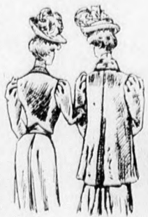
52. és 53. sz. A 36. és 38. szám hata.

panne, 15 m. hosszú, 3 szu, 5 cm. széles csipke és 6 m. hosszú, 1 1/2 cm. széles csipke.