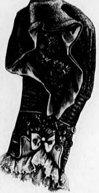
48. sz. A 33. szám ujjaküin.