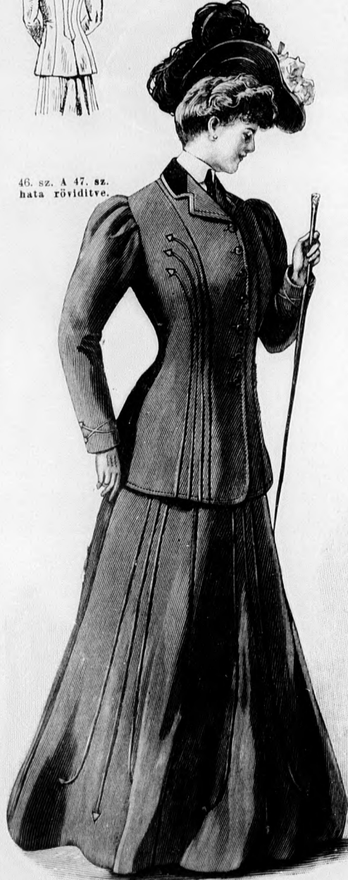
47. sz. Ötötzet erősebb hölgyeknek. (Hét lapból álló tölcésalakú szoknya és télig testhezálló kabát.) Ehhez 46. sz. Szab.: mintai XV. sz., 96-106. fig.

55. sz. Bluzos szoknya tafotadiszszel. Szab.: mintai XXVIII. sz., 171. fig. Anyag: 3 3/4 m. hosszú, 120 cm. széles fekete posztó, 1 1/2 m. hosszú, 50 cm. széles tafota. A kis rajz 171. fig. szerint szabott béleletlen szoknyából vágott ráncokat kereszt és pont szerint rakjuk.