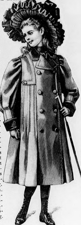
45. sz. Kabát rakotráncokkal 8-10 éves leányoknak. Szab. hátkép és magy.: mintai XIV. sz., 89-95a. fig.

65. sz. Selyembluz csipkevállpánttal. Ehhez a 62. sz. Szab.: mintai XXIV. sz., 150. fig. Anyag: 4 m. hosszú, 48 cm. széles fekete merveljőselyem, 5 m. hosszú, 2 cm. széles fekete tüllbetét és 2 m. hosszú, 10 cm. széles tüllcsipke. A bluzbélést az 52-55. fig. adja. A 100. fig. szerint szabott vállpántot betétek, selyempántok és díszöltésekből készítjük. Hasonlóképp erősítjük fel a 38. fig. szerint szabott, hátulzárt állógallért. A könnyedén bodrozott és hátul a béléshez hasonlóan, láthatatlanul zárt bluz felsőszövetét a vállpánt alsó széléhez erősítjük. A könyök alatt állóránccal behúzott, elől díszöltéssel összevarrt felsőszövetűjek megfelelő hosszát a kis rajz 59. fig. adja. Az ujjak alsó széléhez tüllcsipke határolja. A díszes rozettákkal kiverett övet ráncolt részt selyemesikből készítjük.