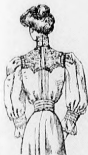
62. sz. A 65. sz. háta.

67. sz. Posztóbluz ajour-diszszel. Szab., hátkép és minta: mintaiv VII. sz., 52-59b. fig. Anyag: 1 méter hosszú, 120 cm. széles számócsaszínű posztó és 1/2 cm. hosszú, 46 cm. széles hasonlószínű selyem. A bluzt ajour-csikok és finom szegélycsoportok díszítik.