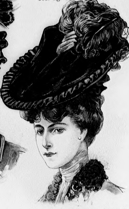
44. sz. Bársonykalap structoll-díszszel.

Anyag: 7 méter hosszú, 120 cm. széles konfekciós szövet, 15 cm. hosszú fekete bársony (részben vágva). A zöld konfekciós szövetből való mintánkon nagy figyelmet igényelnek s hengersizégelyek (részben a varrások is hengersizéren keskenyen le vannak tűzve), épp úgy mint a fekete kordonetselyemmel kidolgozott „legyek”. (A „legy” kidolgozását lásd a mellékleten.) A sima kétlapu tölcésalakú szoknyát a 96-99. fig. adja rövidítve; a részeket épp úgy, mint a hengerdísz jelző finom vonalakat a kis rajz 106a. fig. szerint egészítjük ki. Elöl baloldalt nyomos gombbal zárt hasíték van. A kabát kiszabása előtt, a 100-103. ngrán a szűk-széles meghosszabbítást kis rajz szerint dolgozzuk ki.