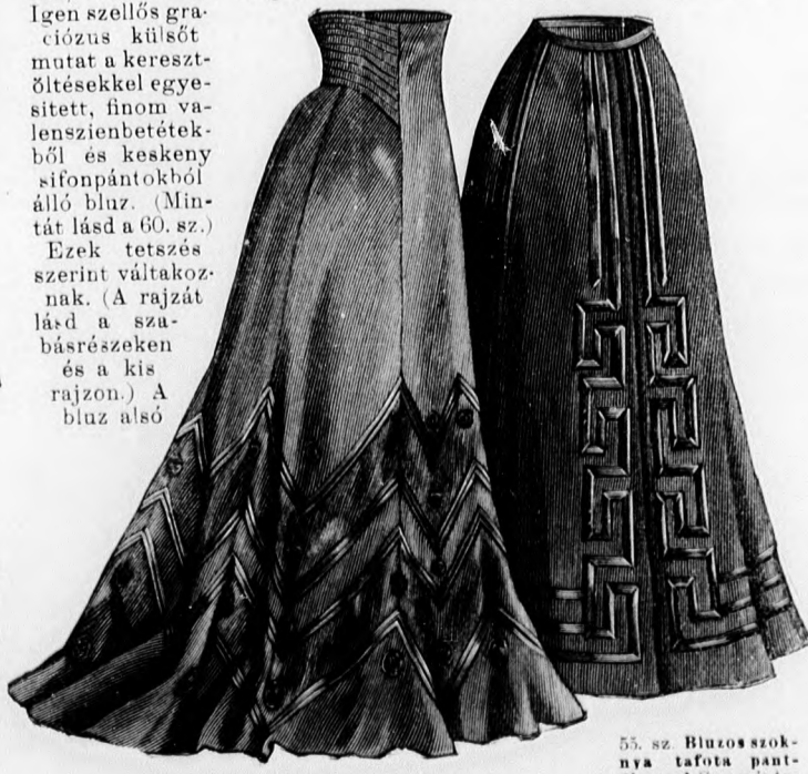
55. sz. Bluzos szoknya tafota díszszel Szab.: mintai XXVIII. sz., 171. fig.

panne, 15 m. hosszú, 3 szu, 5 cm. széles csipke és 6 m. hosszú, 1 1/2 cm. széles csipke.