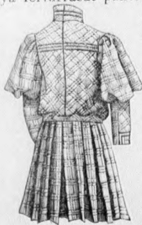
12. sz. A 6. számú háta.

zipsó laposrácba alul mint betét kandikál elő. A kereszt és pont szerint ráncolt s az alsó szélén csillagtól-csillagig behuzott felsőszövetujjakat a kis rajz 156. fig. után vágjuk s a 154. fig. szerinti belésujjakra huzunk. A hajtókával díszített állógallért a 157. fig. adja. Az utóbbira vörös selyemnyakkendő erősítünk, a mely elől a vörös két sor sujtással határolt lehajtottgallér alul bujik ki. A szoknyát 2 m. bős, 56 cm. hosszú egyenes szövetből vágjuk, a melyet 7 cm. széles laposrácba rakunk, hátul 15 cm. hosszú hasítékot hagyunk. A szoknya felvarrást pántokon áthuzott lakbőrön borítja. A belésszoknyát a mai mintaivünk 68. fig. szerint szabjuk, szükség szerint megrövidítve.