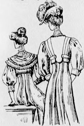
22. és 23. sz. A 18. és 19. szám háta rövidítve.

32. sz. Ruha zsaketdíszszel. Ehhez 28. sz. Szab.: mintáiv IV. sz., 31-42. fig. Anyag: 5 m. hosszú, 120 cm. széles sötétkék sevió, 325 cm. hosszú, 50 cm. széles hasonlószerű selyembársony, 50 cm. hosszú hasonlószerű merveljőselyem, 75 cm. hosszú világoszöld tafota (rézsut vágottak), 50-50 cm. szélességben, 40 cm. hosszú pettyes sárgás-tüli, 20 cm. széles gipürszövet, 5 különböző nagyságu laposhimzésű levélfigura (rátét), 180 cm. hosszú, 10 cm. széles tüll-csipke, 14 m hosszú sötétkék selyempaszománt, aranyfonál mintázattal, 3 kis bronz-boglár. A sikkes előkelő ruhának különösen tetszetős a rövid kabát formája. A kis rajz 32. fig. után vágott szoknyának mindkét előli rézsut öszszevarrt harangalaku lapját a hasiték mellett ráncba rakjuk s ezt 12 cm. hosszúan letűzzük. A szoknya szélét két 11 cm. széles egymástborító rézsutpánt díszíti, az alsó szélükön meg-