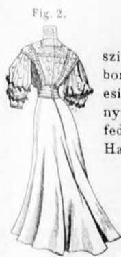
Fig. 2. 1. fig. Esti köpeny. Az eredeti alaku köpeny homokszínű posztóbból készül. A széles gallérját részben rózsabordűr, részben csipkefigurák foglalják és ezek alól esik ki az ujját utánozó széles dupla csipkefodor. A nyakkivágást ráncos csipke veszi körül és zsabószertüen fedi a nyak csukódását, ezen alul szalagozották díszítik. Hasonló szalagból készül az övszerű dísz és a hátsó csokor.

2. fig. Hangversenyruha. Az elegáns ruha sima harangalja pávakék selyembársonyból, velours-sifonból, a hátul kaptos dereka hasonlószerű chantilly-csipkéből készül. A derek felső részét himzett fehér