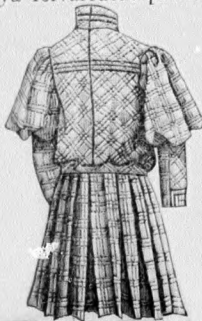
12. sz. A 6. számú háta:

zipső laposrác alul mint betét kandikál elő. A kereszt és pont szerint ráncolt s az alsó szélén csillagtól-csillagig behuzott felsőszövetujjakat a kis rajz 156. fig. után vágjuk s a 154. fig. szerinti belésujjakra húzzuk. A hajtókával díszített állógallért a 157. fig. adja. Az utóbbira vörös selyemnyakkendő erősítünk, a mely elől a vörös két sor sujtással határolt lehajtottgallér alul bujjik ki. A szoknyát 2 m. 65, 56 cm. hosszú egyenes szövetből vágjuk, a melyet 7 cm. széles laposrácba rakunk, hátul 15 cm. hosszú hasítékot hagyunk. A szoknya felvarrását pántokon áthuzott lakbőrön borítja. A belésszoknyát a mai mintáivunk 68. fig. szerint szabjuk, szélesség szerint megrövidítve.