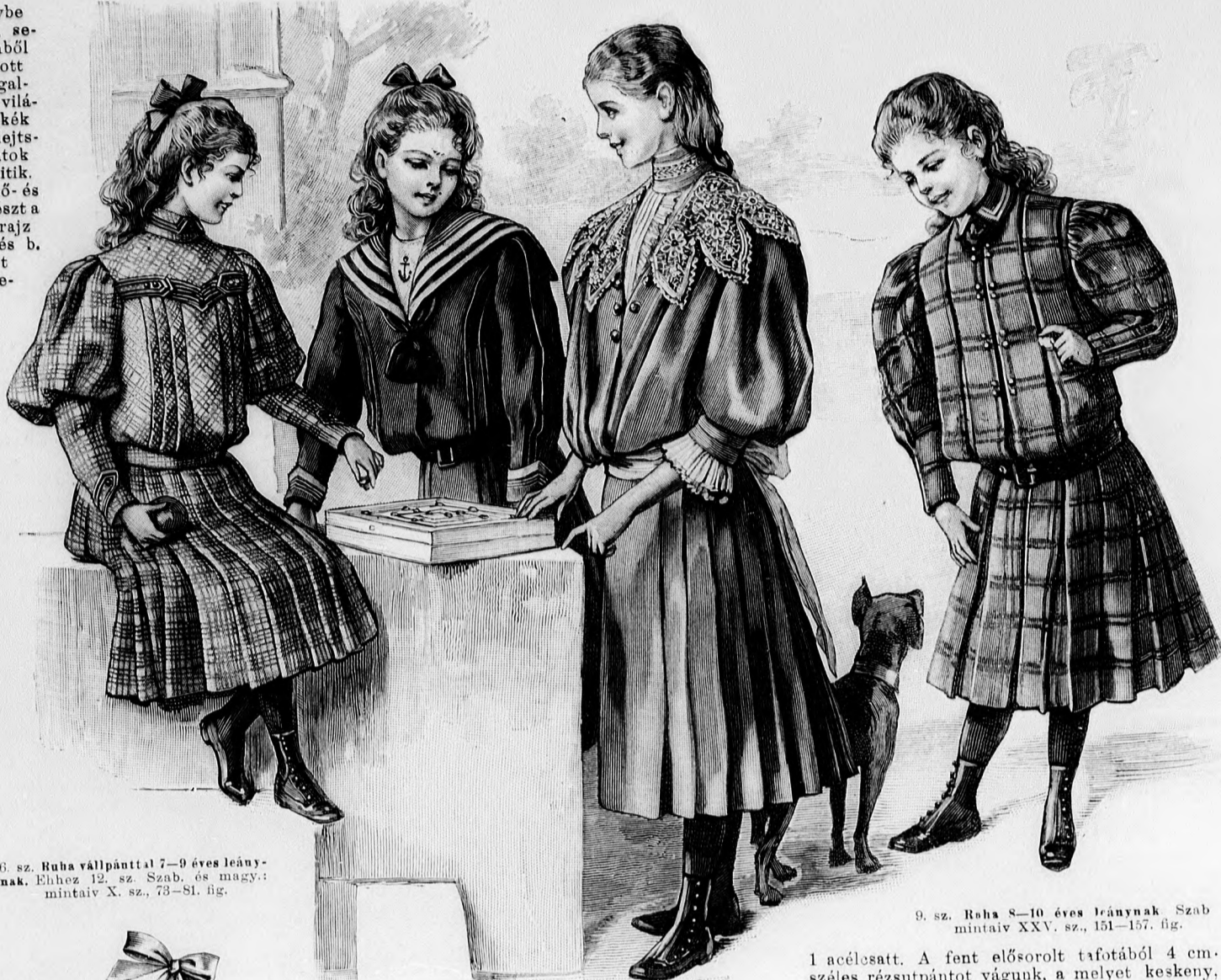
6. sz. Ruha vállpánttal 7-9 éves leány-nak. Ehhez 12. sz. Szab. és magy.: mintaiv X. sz., 73-81. fig.

pont szerint ráncoljuk. A 65. fig. után vágott spach-relgallért felső szélénél fogva balra 138-139-ig a derékre tércejjük és jobbra alágomboljuk. A 63. fig. szerinti belésujjak alsó szélét a vonalig ráncolt felsőszövetvel borítjuk és fordított varrással a kis rajz 67. fig. szerint szabott, felső és alsó szélén behuzott felsőszövetujjakra erősítjük. Az ujjak alsó szélét két 5 és 7 cm. széles fehér selyemplisszé díszíti. A derék alsó ráncolt szélét hátul simán, elől kissé leöngőleg a belésderékre erősítjük. A szoknyát 360 cm. hosszú, 55 cm. széles egyenes szövetből vágjuk. Ezt elől 20 cm. széles laposrácba, egyébként pedig hátrafelé fordított ráncokba rakjuk. A kis rajz 68. fig. szerint készített belésszoknya alsó szélét 10 cm. széles plisszé határozza. A belés és felsőszövetzoknyát a derék alsó szélére varrjuk. A felvarrást 12 cm. széles, 2 m. hosszú esarp borítja.