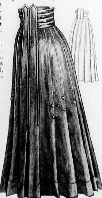
16. és 17. sz. Buzos szoknya fiatal leány-nak. Szab. és magy.: mintaiv IX. sz., 69. fig.

25. sz. Asztrakánkabát hermelingallérral. Ehhez 26. sz. Anyag: (a szőrmentázat számára: 1 1/4 m. hosszú, 140 cm.