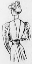
63. sz. A 68. szám háta.

Az ajour-csikok mintáját a mintaiv 59b. fig. adja. Keresztöltések és hálók egyesítik, a mintával kirajzolt bélésűcsikra tércelt tafotapántokat. Ezekből a csikokból készítjük a 38. fig. szerinti állógallért, a 26 cm. bő ujjfogalókat, a kerek vállpánt alsó részét és az előli felsőszövet közepe mentén, valamint a két szegélycsoport közé ékeljük. A bluz bélését az 52-55. fig. adja, az alsó ujj körvonalával az 55. figurán. Az 56. fig. után vágott vállpántot a nyakkivágástól a vonalig díszöltésekkel egyesített selyempántok díszítik. A vonal alatti rész az ajour-csikokat jelzi. Ehhez zárul elől és hátul a felsőszövet. Az 57. fig. szerint szabott előli felsőszöveten a főt említett díszvonal elő van rajzolva. A kereszt és pont szerint ráncolt alsó szélét a bélésnek csillagig behuzzott alsó széléhez erősítjük. A hátsó felsőszövet simán borítja, a hát- és oldalrészeket együttesen, a hátsó szélén 4 cm. széles hengersizegélyekbe varrva. A bluzt