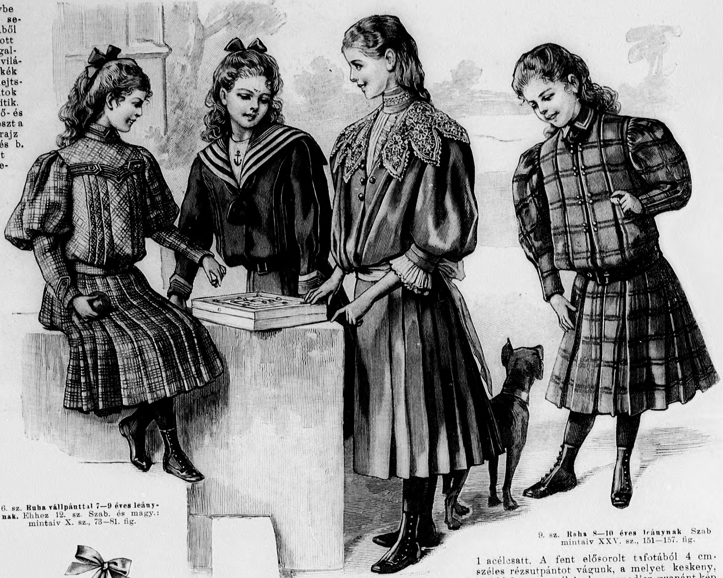
6. sz. Ruha vállpánttal 7-9 éves leánynak. Ehhez 12. sz. Szab. és magy.: mintáiv X. sz., 73-81. fig.

pont szerint ráncoljuk. A 65. fig. után vágott spachtelgallért felső szélénél fogva balra 138-139-ig a derékra térceljük és jobbra alágomboljuk. A 63. fig. szerinti belésujjak alsó szélét a vonalig ráncolt felsőszövetvel borítjuk és fordított varrással a kis rajz 67. fig. szerint szabott, felső és alsó szélén behuzott felsőszövetujjakra erősítjük. Az ujjak alsó szélét két 5 és 7 cm. széles fehér selyemplisszé díszíti. A derék alsó ráncolt szélét hátul simán, elől kissé leelőgőlag a belésszövetekre erősítjük. A szoknyát 360 cm. hosszú, 55 cm. széles egyenes szövetből vágjuk. Ezt elől 20 cm. széles laposrácba, egyébként pedig hátrafelé fordított ráncokba rakjuk. A kis rajz 68. fig. szerint készített belésszoknya alsó szélét 10 cm. széles plisszé határozza. A belés és felsőszövetzoknyát a derék alsó szélére varrjuk. A felvarrását 12 cm. széles, 2 m. hosszú esarp borítja.