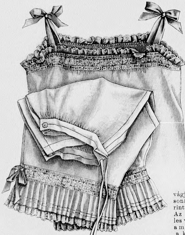
10. és 11. sz. Balling és nadrág hölgyeknek Szab. és magy.: mintáiv XI. sz., 81-85. fig.

zipső laposrác alul mint betét kandikál elő. A kereszt és pont szerint ráncolt s az alsó szélén csillagtól-csillagig behuzott felsőszövetujjakat a kis rajz 156. fig. után vágjuk s a 154. fig. szerinti belésujjakra húzzuk. A hajtókával díszített állógallért a 157. fig. adja. Az utóbbira vörös selyemnyakkendő erősítünk, a mely elől a vörös két sor sujtással határolt lehajtottgallér alul bujjik ki. A szoknyát 2 m. 65, 56 cm. hosszú egyenes szövetből vágjuk, a melyet 7 cm. széles laposrácba rakunk, hátul 15 cm. hosszú hasítékot hagyunk. A szoknya felvarrását pántokon áthuzott lakbőrön borítja. A belésszoknyát a mai mintáivunk 68. fig. szerint szabjuk, szélesség szerint megrövidítve.