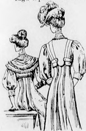
22. és 23. sz. A 18. és 19. szám háta rövidítve.

32. sz. Ruha zsaketdiszszel. Ehhez 28. sz. Szab.: mintáiv IV. sz., 31—42. fig. Anyag: 5 m. hosszú, 120 cm. széles sötétkék sevio, 325 cm. hosszú, 50 cm. széles hasonlószerű selyembársony, 50 cm. hosszú hasonlószerű merveljőselyem, 75 cm. hosszú világoszöld tafota (részut vágottak), 50—50 cm. szélességben, 40 cm. hosszú pettyes sárgás túll, 20 cm. széles gipürszövet, 5 különböző nagyságu laposhimzésű levélfigura (rátét), 180 cm. hosszú, 10 cm. széles túll-csipke, 14 m. hosszú sötétkék selyempaszománt, aranyfonál mintázattal, 3 kis bronzboglar. A sikkes előkelő ruhának különösen tetszetős a rövid kabát formája. A kis rajz 32. fig. után vágott szoknyának mindkét előli részut összevarrt harangalaku lapját a hasiték mellett ráncba rakjuk s ezt 12 cm. hosszan letűzzük. A szoknya szélét két 11 cm. széles egymástborító részutpánt díszíti, az alsó szélükön meg-