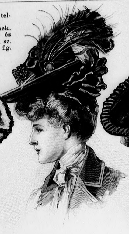
43. sz. Bársonykalap szalag- és pávatoll-díszszel.