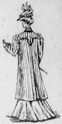
41. sz. A 37. szám hata.

44. sz. Bársonykalap structoldisszszel. Az oldalt magasan felhajtott kalapot ráncolt fekete tükörbársonnyal borítjuk, előli 3, oldalt 9 cm. magasan kengyellel alátámasztva. A felső fejszél alá szalagplisszédiszt foglalunk, a mely a zseniliabordűrrel borított, előálló szélre nyulik. Oldalt a kalapra sztrasz üveggombbal megerősített