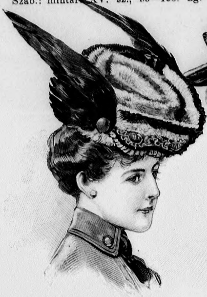
42. sz. Kalap oldalsó toll-díszszel.

47. sz. Ruha erősebb hölgyeknek. (Hétlapu tölcésalakú szoknya és télig testhezálló kabát.) Ehhez 46. sz. Szab.: mintai XV. sz., 96-106. fig.