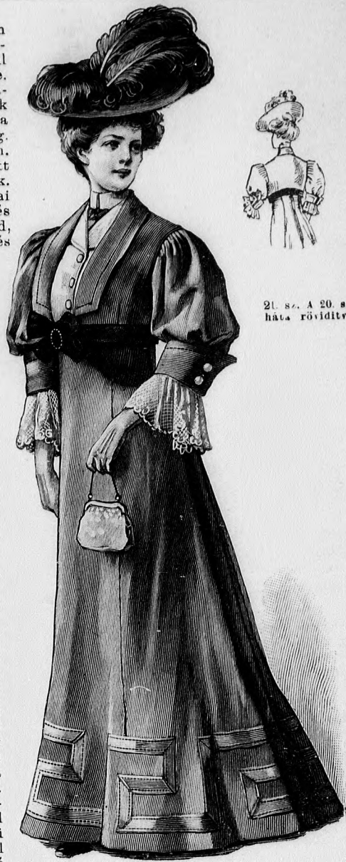
21. sz. A 20. sz. háta rövidítve.

nyitva s a látható módon elől keskeny bársony háromszöggel, köröskörül pedig paszomántalékvite. A 33-36. fig. szerint szabott. Hátul zárt bélésderék a szoknyára fekszik, a mely alá a 31a-c. fig. szerint készített, 12 cm. széles fodorral ellátott bélészkönyvet illesztünk. A 33. és 36. fig. vonalai szerint felvarrt előli és hátsó betétdíszít rövid, ívezett gipürvállpántból és behuzott hozzáillesztett tüllből készítjük. Az előli három, hátul két hirtelt levéllel ki- varrt betét alól a bélést tetszés szerint kivághatjuk és sifon- vagy tüllrészszel helyettesíthetjük. Az állógallért a 38. fig. adja. A 33. és 36. fig. az elő- rajzolt hátsó vonalig a beté- ten át erősítjük fel a 39a. és b. fig.-on szerint szabott bluz- részeket, a melyeket a hossz- széleiken kereszt és pont szerint ráncolunk, elől és hátul rézsut egymásra fektetve, hátul a záráson át a bélésderékre kap- csoljuk. Minthogy a bluzrészek a kabát alul csupán mint kes- keny ráncdíszek láthatók, ter- szésszerint megfelelő ráncokkal is helyettesíthetők. Az övdíszít 22 cm. széles merveljőselyem-