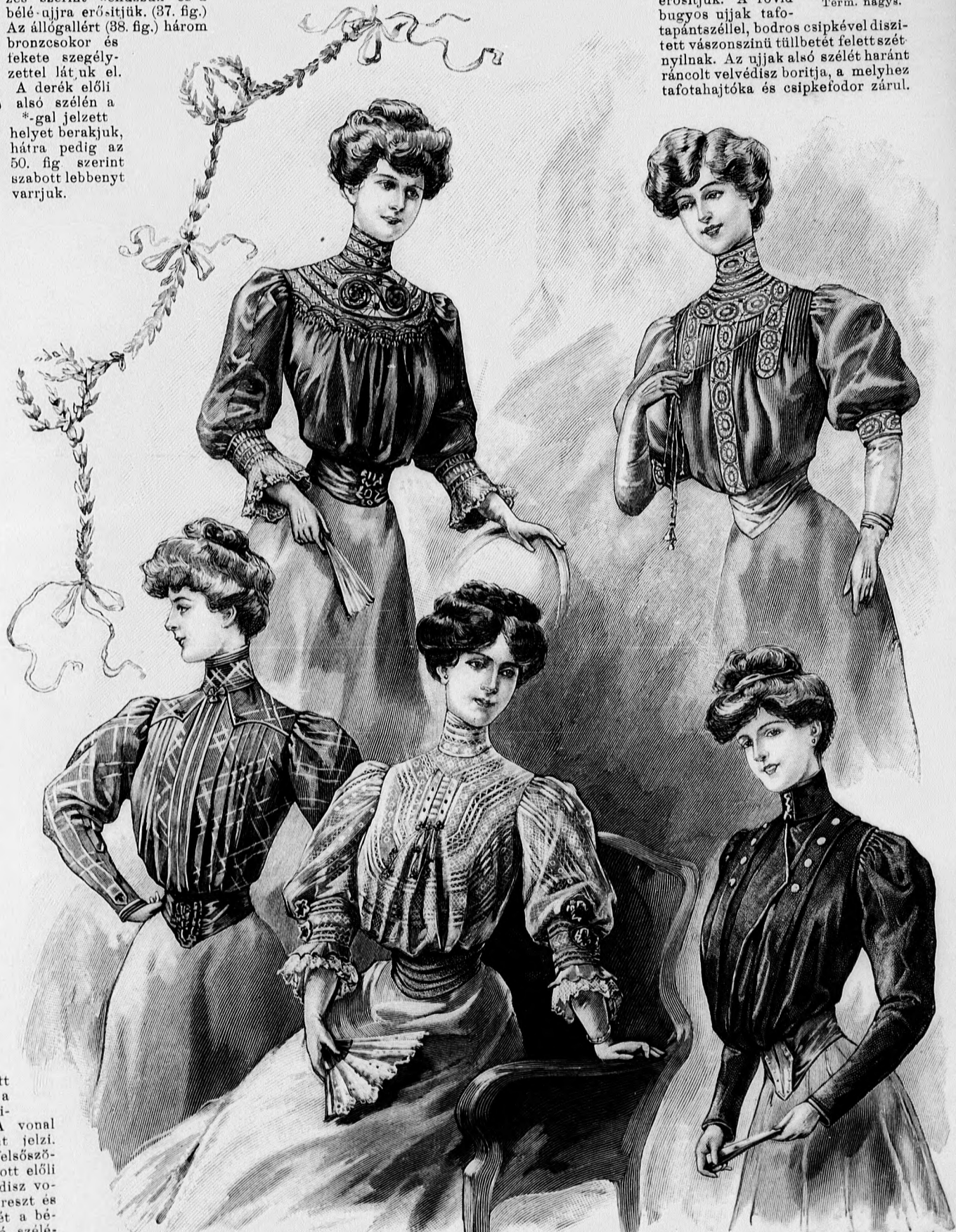
64. sz. Skótselyembluz kis vállpánttal. Szab.: mintaiv V. sz., 43-46. fig.

Az ajour-csikok mintáját a mintaiv 59b. fig. adja. Keresztöltések és hálók egyesítik, a mintával kirajzolt bélésűcsikra tércelt tafotapántokat. Ezekből a csikokból készítjük a 38. fig. szerinti állógallért, a 26 cm. bő ujjfogalókat, a kerek vállpánt alsó részét és az előli felsőszövet közepe mentén, valamint a két szegélycsoport közé ékeljük. A bluz bélését az 52-55. fig. adja, az alsó ujj körvonalával az 55. figurán. Az 56. fig. után vágott vállpántot a nyakkivágástól a vonalig díszöltésekkel egyesített selyempántok díszítik. A vonal alatti rész az ajour-csikokat jelzi. Ehhez zárul elől és hátul a felsőszövet. Az 57. fig. szerint szabott előli felsőszöveten a főt említett díszvonal elő van rajzolva. A kereszt és pont szerint ráncolt alsó szélét a bélésnek csillagig behuzzott alsó széléhez erősítjük. A hátsó felsőszövet simán borítja, a hát- és oldalrészeket együttesen, a hátsó szélén 4 cm. széles hengersizegélyekbe varrva. A bluzt