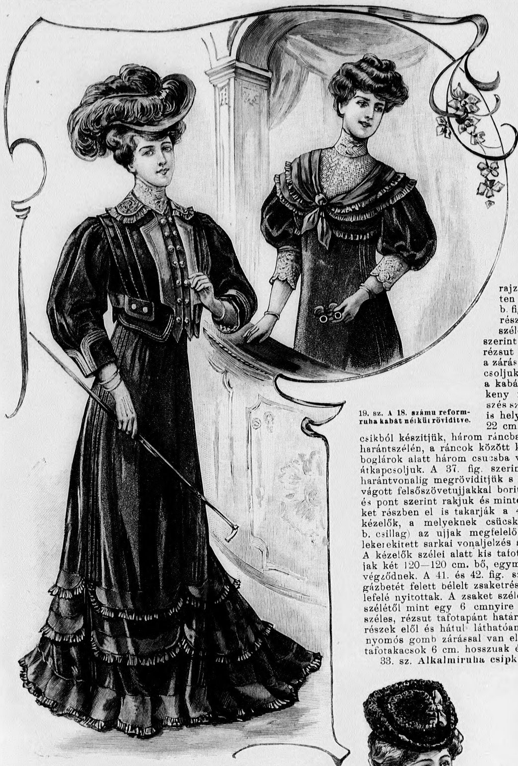
19. sz. A 18. számú reformruha kabát nélküli rövidítve.

csikból készítjük, három ráncba rakjuk és hátul a jobb harántszélén, a ráncok között kétszer behasítjuk és kis boglárók alatt három csucsba vágott pánttal a derékon átkapcsoljuk. A 37. fig. szerinti bélésujjakat az adott harántvonalig megrövidítjük s a kis rajz 40. fig. után vágott felsőszövetujjakkal borítjuk; a ráncokat kereszt és pont szerint rakjuk és mintegy 6 cm.-re letűzzük. Ezeket részben el is takarják a 40a. fig. szerint készített kézelők, a melyeknek csücskös sarkait (a. csillag és b. csillag) az ujjak megfelelő jeleire illesztjük, míg a lekerekített sarkai vonaljelzés szerint egymásba nyulnak. A kézelők szélei alatt kis tafotacsokrok láthatók. Az ujjak két 120-120 cm. bő, egymást borító csipkefodorral végződnek. A 41. és 42. fig. szerint szabott és könnyű gazbetét felett bélelt zsaketrészen a vállvarások 91-től lefelé nyitottak. A zsaket széleit elől és hátul, az alsó szélétől mint egy 6 cm-nyire kezdődő, két 1 és 2 cm. széles, rézsut tafotapánt határolja paszpolként. A zsaketrészek elől és hátul láthatóan egymást borítják, hátul nyomós gomb zárással van ellátva. A hasitékon áthuzott tafotacsok 6 cm. hosszúak és 10 cm. szélesek.