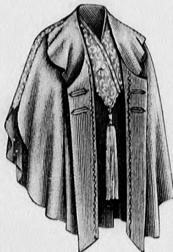
58. sz. Az 56. és 57. szám nyitva.

68. sz. Bársonybluz rézsut gombolva. Ehhez 63. sz. Szab.: mintaiv VI. sz., 47-51. fig. Anyag: 4 méter hosszú, 48 cm. széles bársony, 8 drb. bronzgomb és 3 drb. bronzsokor. A csinos sötétkék bársonybluzt rézsut gomboljuk. A szövetet a 47-51. fig. szerint szabjuk, az elő- és hátrészen a jelzett vonal mentén 1 cm. széles