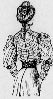
59. sz. A 66. szám háta.

A felvarrását pompadurszalagból való ráncolt öv borítja. A szoknyacsinosdíszét három 6-6 cm. széles, 2 1/2 cm. széles tafotapaszpallal határolt velvépánt adja. A hátulzáródó bélésderekát elől és hátul az állógallérral együttesen egyformaszínű csipkével és sítonnal borítjuk betétszerűen. Az állógallér szélét tafotahenger és paszpol határolja. Az elől tafotacsokor alatt egy-