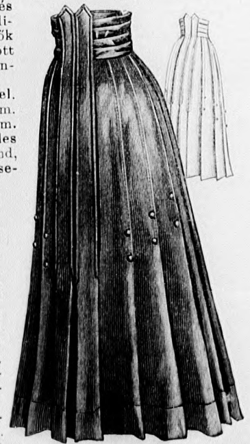
16. és 17. sz. Buzos szoknya fiatal leánynak. Szab. és magy.: mintáiv IX. sz., 68. fig.

25. sz. Asztrakánkabát hermelingallerral. Ehhez 26. sz. Anyag: (a szőrmeutáztat számara: 1 1/4 m. hosszú, 140 cm.