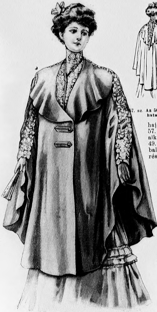
56. sz. Elegáns estélyi köpeny giprbetáttal. Ehhez 57. és 58. sz., Szab. és magy.: mintaiv XXI. sz., 139-144. fig.