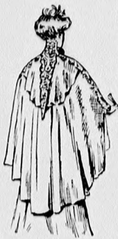
57. sz. Az 56. szám háta.

hátul láthatatlanul gomboljuk. Az 58. fig. szerint szabott lebbenyrészt szám szerint varrjuk az alsó szélé ellen. A kis rajz 59. fig. után vágott felsőszövetujjakat a bélésujjakra erősítjük.