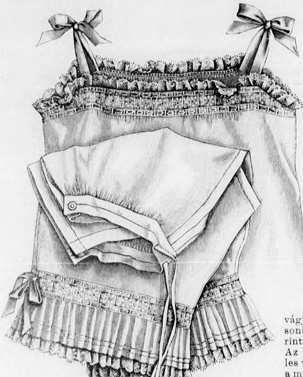
10. és 11. sz. Ballinéz és nadrág hölgyeknek. Szab. és magy.: mintaiv XI. sz., 82-85. fig.

zipsó laposrácba alul mint betét kandikál elő. A kereszt és pont szerint ráncolt s az alsó szélén csillagtól-csillagig behuzott felsőszövetujjakat a kis rajz 156. fig. után vágjuk s a 154. fig. szerinti belésujjakra huzunk. A hajtókával díszített állógallért a 157. fig. adja. Az utóbbira vörös selyemnyakkendő erősítünk, a mely elől a vörös két sor sujtással határolt lehajtottgallér alul bujik ki. A szoknyát 2 m. bős, 56 cm. hosszú egyenes szövetből vágjuk, a melyet 7 cm. széles laposrácba rakunk, hátul 15 cm. hosszú hasítékot hagyunk. A szoknya felvarrást pántokon áthuzott lakbőrön borítja. A belésszoknyát a mai mintaivünk 68. fig. szerint szabjuk, szükség szerint megrövidítve.