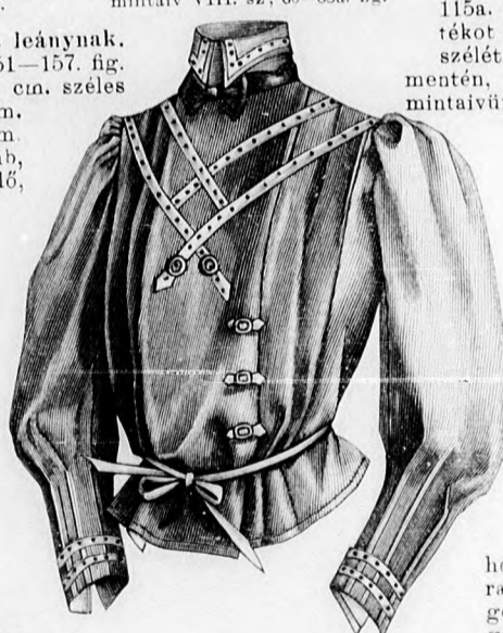
15. sz. Blúz fiatal leány-nak. Szab. hátkép és magy.: mintaiv IXa. sz., 70-72a. fig.

7. sz. Matrózruha 9-11 éves leány-nak. Ehhez 2-5. sz. Szab.: mintaiv XXVI. sz., 158-167. fig. 9. sz. Ruha 8-10 éves leány-nak. Szab.: mintaiv XXV. sz., 151-157. fig. Anyag: 4 1/4 m. hosszú, 90 cm. széles gyapjú, 1 1/4 m. hosszú, 85 cm. széles vörös selyem, 3/4 m. fehér sujtás, 16 aranygomb, 1 vörös selyemnyakkendő, 1 vörös lakbőrön. A hátul záródó ruhát a 151-157. fig. szerint kockás gyapjuszövetből vágjuk. A belésderéket a 151-153. fig. szerint szabjuk s a nyakkivágásnál a kis bevarrást dolgozzuk ki. A felsőszövetrészeket a 155a. fig. adja. Az a. fig.-át az előli közepén végig egészben vágjuk s a b. fig. hoz hasonlóan kereszt és pont szerint laposrácokba rakjuk. Az előli közepre 4 cm. széles vörös szaténcsikót tűzünk, a mely a két kö-