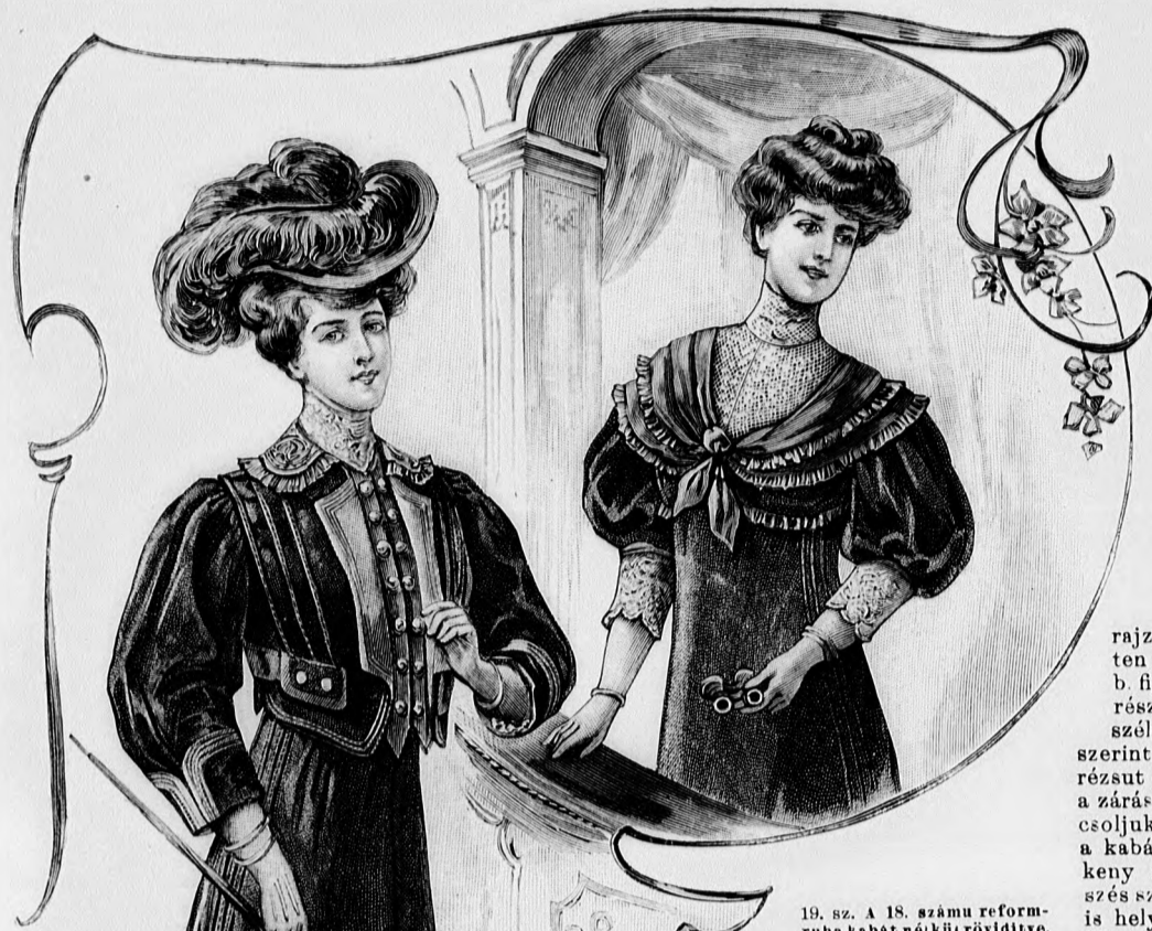
19. sz. A 18. számú reformruha kabát nélkül rövidítve.

csikból készítjük, három ráncba rakjuk és hátul a jobb harántszélén, a ráncok között kétszer behasítjuk és kis boglárók alatt három csucsba vágott pánttal a derékon átkapcsoljuk. A 37. fig. szerinti bélésujjakat az adott harántvonalig megrövidítjük s a kis rajz 40. fig. után vágott felsőszövetujjakkal borítjuk; a ráncokat kereszt és pont szerint rakjuk és mintegy 6 cm.-re letűzzük. Ezeket részben el is takarják a 40a. fig. szerint készített kézelők, a melyeknek csücskös sarkait (a csillag és b. csillag) az ujjak megfelelő jeleire illesztjük, míg a lekerekített sarkai vonaljelzés szerint egymásba nyulnak. A kézelők szélei alatt kis tafotacsokrok láthatók. Az ujjak két 120—120 cm. bő, egymást borító csipkefodorral végződnek. A 41. és 42. fig. szerint szabott és könnyű gázbetét felett bélelt zsaketrészen a vállvarások 91-től lefelé nyitottak. A zsaket széleit elől és hátul, az alsó szélétől mint egy 6 cm.-nyire kezdődő, két 1 és 2 cm. széles, részut tafotapánt határolja paszpolként. A zsaketrészek elől és hátul láthatóan egymást borítják, hátul nyomós gomb zárással van ellátva. A hasitékon áthuzott tafotakacsok 6 cm. hosszúak és 10 cm. szélesek.