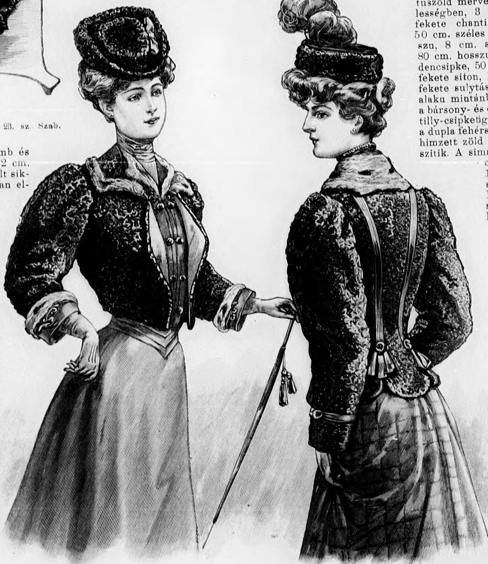
24. sz. Asztrakánkabát hermelindiszszel. Ehhez 27. sz.