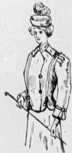
26. sz. A 25. szám eleje.