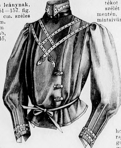
15. sz. Bluz fiatal leánynak. Szab. hátkép és magy.: mintáiv IXa. sz., 70-72a. fig.

9. sz. Ruha 8-10 éves leánynak. Szab.: mintáiv XXV. sz., 151-157. fig. Anyag: 4 1/2 m. hosszú, 90 cm. széles gyapjú, 1/4 m. hosszú, 85 cm. széles vörös selyem, 3/4 m. fehér sujtás, 16 aranygomb, 1 vörös selyemnyakkendő, 1 vörös lak bőrön. A hátul záródó ruhát a 151-157. fig. szerinti kockás gyapjuszövetből vágjuk. A belésszöveteket a 151-153. fig. szerinti szabjuk s a nyakkivágásnál a kis bevarrást dolgozzuk ki. A felsőszövetrészeket a 155a. fig. adja. Az a. fig.-at az elől középen végig egészen vágjuk s a b. fig. hoz hasonlóan kereszt és pont szerint laposrácokba rakjuk. Az elől középre 4 cm. széles vörös szaténecsköt tűzünk, a mely a két kö-