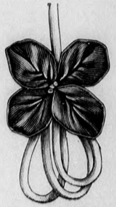
61. sz. A 66. sz. dísz egyes része. Term. nagys.

hajtást tűzünk, azután az 52-57. fig. után készített bélésre alkalmazzuk. A jobb előrészt a 49. fig. szerint megtoldjuk és balra átkapcsoljuk. Ez utóbbi részt közvászonnal béléljük és 1/2 cm. széles fekete selyemmel szegélyezzük. Az 51. fig. után vágott szövetujjat jelzés szerint behuzzuk és a bélés-ujjra erősítjük. (37. fig.) Az állógallért (38. fig.) három bronzsokor és fekete szegélyzettel látjuk el. A derék előli alsó szélén a *gal jelzett helyet berakjuk, hátra pedig az 50. fig. szerint szabott lebbenyt varrjuk.