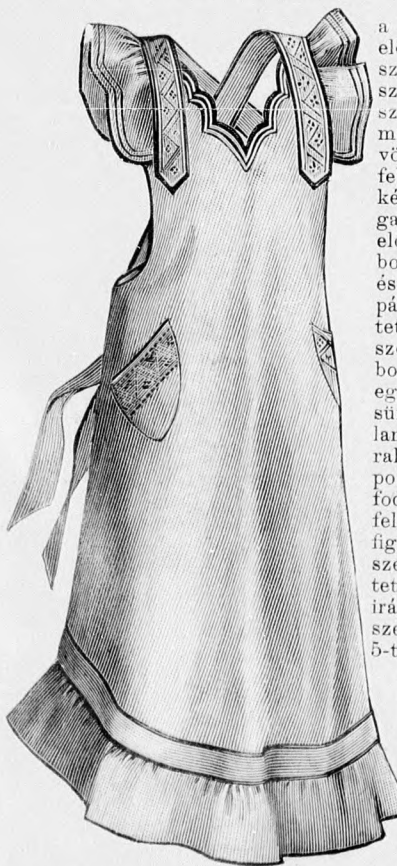
6. sz. Reformkötény keresztöltésdíszszel. Szab., hátkép és a keresztöltés mintája: mintáiv XXVIII. sz., 173-173b. fig.

a 81. fig. szerint szabunk és éppen úgy, mint az előli felsőszövetrészeket, alul behuzzuk. A derék-szélét a zsinór felett haránt áttűzött s a 85. fig. szerint szabott, barna atlasz miderszerű öv borítja. A vállpántot, a melyre a belső vonalig terjedő, vörös posztó paszpollal határolt fehér posztógallért erősítünk, ezt kétsorosán 1 1/2 cm. széles gyapjugalanggal vesszük körül, a hurkait elől keresztelve nagy filigrángombokra húzzuk. Kis filigrángombok és aranyujtáshurkok ékítik a vállpánt előli szélét is. A kissé rövidített bélésujjakat a kis rajz 86. fig. szerint szabott felsőujjszövetvel borítjuk, a melyet 177-től 178-ig egybe varrunk, fönt rajzon belül sűrűn behuzzuk, alól pedig, a galanggal díszített réznél ráncokba rakjuk; ehhez fodorként kinyíró posztódudor, alól pedig csipkefodor zárul. A bélés szoknyát borító felsőszövev szoknyát a kis rajz 80. fig. adja. A felső részét, a felső szélükön, a vonalig előre fektetett ráncokba varrjuk haránt irányban s a cakkozott alsó szélére bodrozott fodrot tűzünk 5-től 7-ig. A cakkok alól a fodor szövetét elvágjuk. A fodorra, a mely csupán a vonalig van bodrozva, az alatt 7 1/2, az után pedig 2 cm. széles rézsut irányu, duplaszövetű posztópántot erősítünk. A bélés szoknyát az október 15-én megjelent számunk 45. fig. adja. Mindkét szoknyát felső szélénél fogva keskeny lénzöbe foglaljuk.