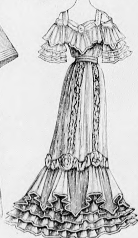
12. sz. A 37. szám háta.

11. sz. Pongyola széles vállgallérral. Szab., magy. és hátkép: mintáiv XVII. sz., 95-98a. fig.