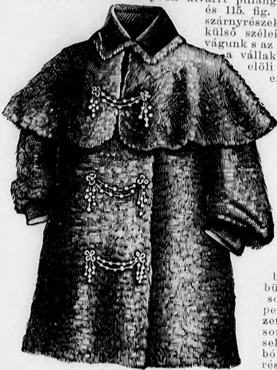
47. sz. Kabát 3-5 éves leányoknak. Szab.: mintáiv XXIV. sz., 151-156. fig.

53. sz. Altalmi ruha pillangódiszszel. Szab. és hátkép: mintáiv XX. sz., 109-118a. fig. A dohányszínű atlaszból készített elegáns ruha derekát 6,71 és hátul esinos pillangódiszszel ékítjük. Ez elől bőlet és barna atlaszból készített, hasonló zseniliával határolt és a 113. fig. szerint haránt irányban kivarrt pillangódiszszel, valamint a 114. és 115. fig. szerinti előli és hátsó szárnyrészekből áll, a melyeket a külső széleiken a sima vonalig kivágunk s az előli közepén, valamint vállakon összevarrunk. Az előli varrást a már említett pillangódiszszel borítja. A szárnyrészt részben a belső rajzig színárnyalt zseniliával himzett, a barna bársonyból, egyebütt hasonlóképpen himzett hasonló színű selyeműtől és gázból állanak. A testrészén fölfele, valamint a szárnyrésztől külső szélén zöld színezett zseniliapetytyek vannak kihimmezve. A jobb