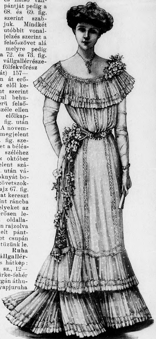
18-19. sz. Öltözethez való tüllből készített ruha plissézdiszszel, valamint virágövből való övvel és csokrokkal ékítve.

31. sz. Posztóruha bársonydiszszel. Ehhez 45. sz. Szab.: mintáiv XI. sz., 67-74. fig. A 45. számú szürke posztóruha fehér posztó mellényrészeit aranyfonál és zöld selyemből való himzés és gömbölyű bronzgombok ékítik. A kézelőket, szoknyapántokat s a derék övdíszé áttűzött fekete bársonyból valók. Hasonló bársonygaland szegélyezi a derék felsőszövetét, valamint az egymást borító, béleletlen vállgallérrészeket; ez utóbbin színes galanggal díszítve. A kézelőket hasonlóképp díszítjük. A derék előli, pántszerű posztódíszé megegyezik az előli szoknyadíszszel. A bélés-derék betétje és állógallérja fehér posztóból valók. A bélésderéket az állógallérral és ujjakkal az október 1-én megjelent számunk 9-12. és 16. fig., valamint a november 1-én megjelent számunk 17. fig. adja. A deréknek a szoknyát borító bluzszerű felsőszövetrészeit a 70. és 71. fig., az előlkapcsos mellényrészeit a