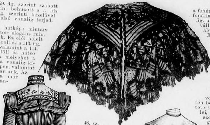
48. sz. Gyöngyvel kivarrt túll-galler szerpentin-toldással. Szab. magy.: mintáiv XXIX. sz., 173. és 175. fig.