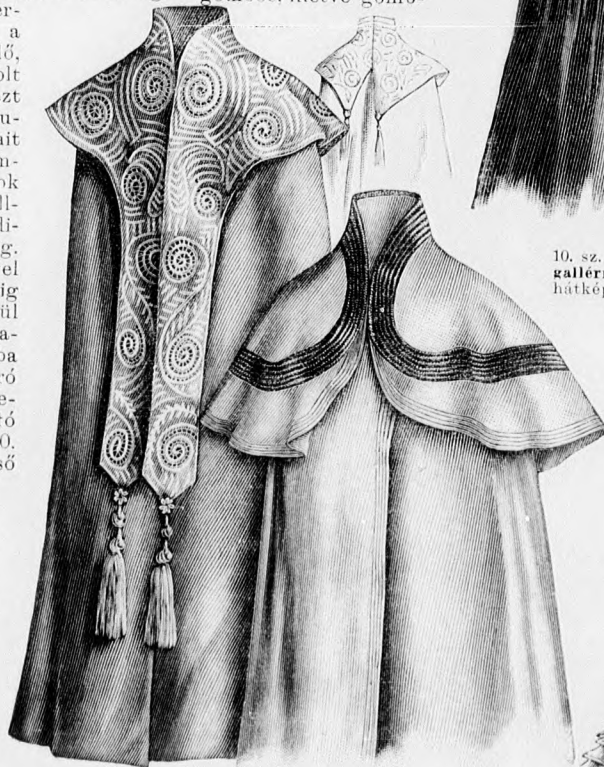
7-8. sz. Estélyi köpeny posztóapplikációval. Szab., magy.: mintáiv XV. sz., 90-91. fig.

3. sz. Sétaruha, rövid testhezálló kabáttal. Ehhez