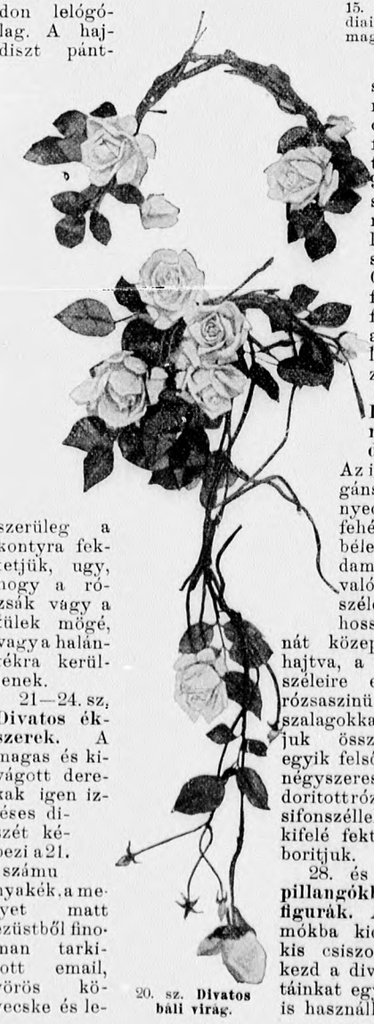
20. sz. Divatos bál virág.

15. sz. Jelmez hölgyeknek. (Hollandiai szélmalom.) Ehhez 17. sz. Szab., magy.: mintáiv XIV. sz., 87-89. fig. 16. sz. Münchener gyermekjelmez 5-6 éves gyermeknek. Szab.: mintáiv IX. sz., 59-61. fig.