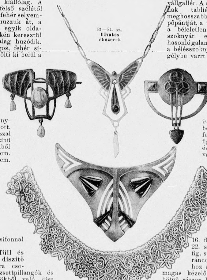
25. sz. Gallér kivágott derékhoz. Szalagmunka.

21-24. sz. Divatos ékszerek. A magas és kivágott derékak igen izlées díszét képezi a 21. számú nyakék, a melyet matt ezüsből finoman tarkított email, vörös kövecske és le-