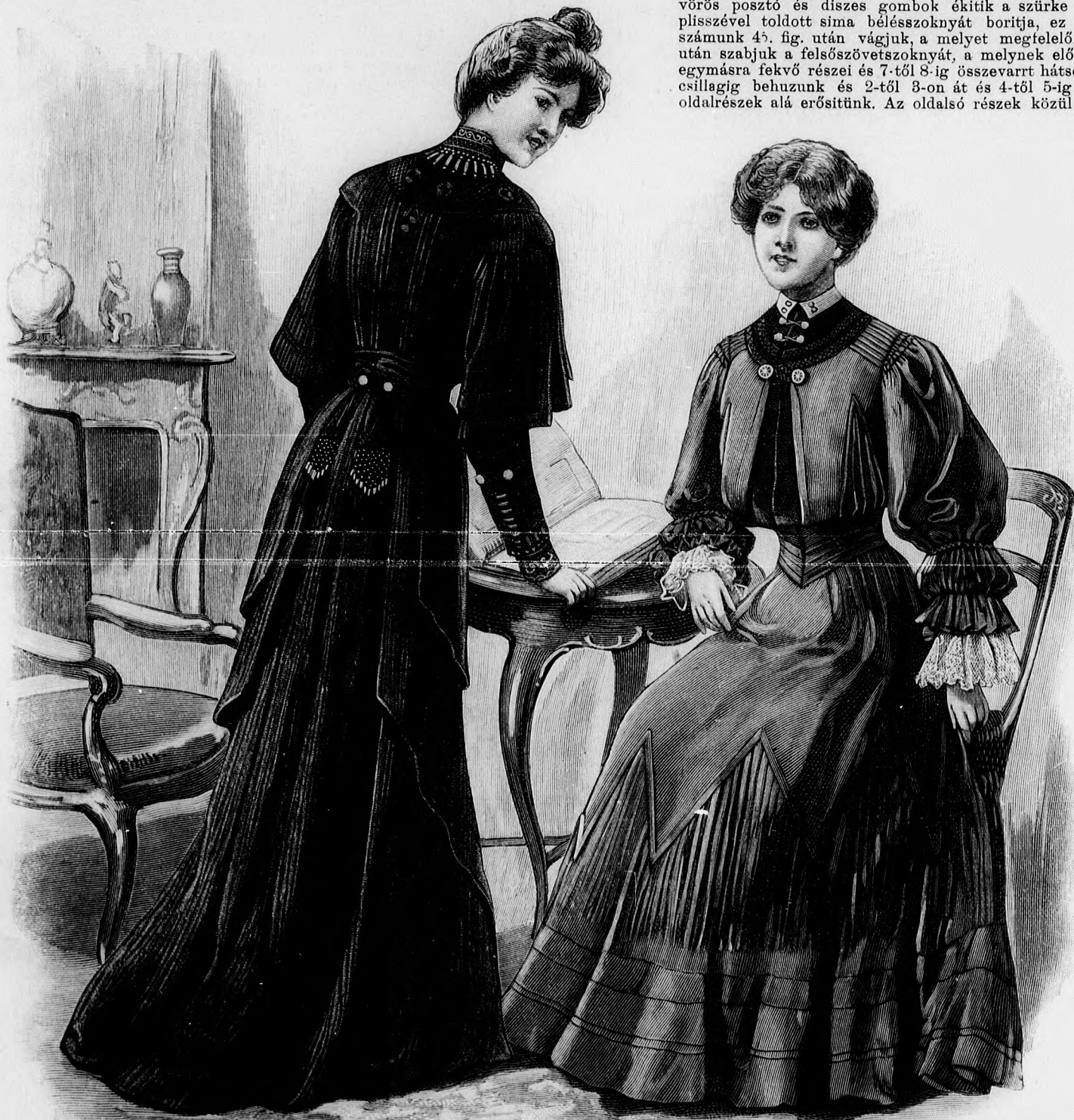
1. sz. Velvéruha galanddiszszel. Ehhez az előkép 30. sz. Szab.: mintáiv X. sz., 62-66. fig.