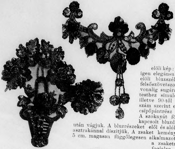
28-29. sz. Szegélyzet tüll- és pillangóval.

szerint készítjük. A 13. fig. a csipőpántot adja, a melynek hosszát a kis rajz 22. fig. szerint egészítjük ki. A csipőpánt alól, oldalt 33-tól 34-ig, a 14. fig. után vágott felsőszövet fodorka zárul, a melyen a szegélyeket rajzon belül a bélészkoknya bőségének megfelelőleg varrjuk be. A bélészkoknyát 12 cm. széles plisszé egészíti ki. A fodrot a plisszészéllel végződve erősítjük a bélészkoknyára, mindkét rész hátsó varrását 35-öt 35-re téve, önállóan dolgozzuk ki. 37-től 38-ig, a csillagon át erősítjük a duplaszkoknyát a csipőpánthoz. Ez utóbbi szabadon lóg, a fodor toldásán át, a bélészkoknyára. A csipőpánt duplapontja a bélészkoknya hasonló jelzésére esik. Mindkét szoknyát hátul hasítókkal ellátva, egy lényöbe foglaljuk.