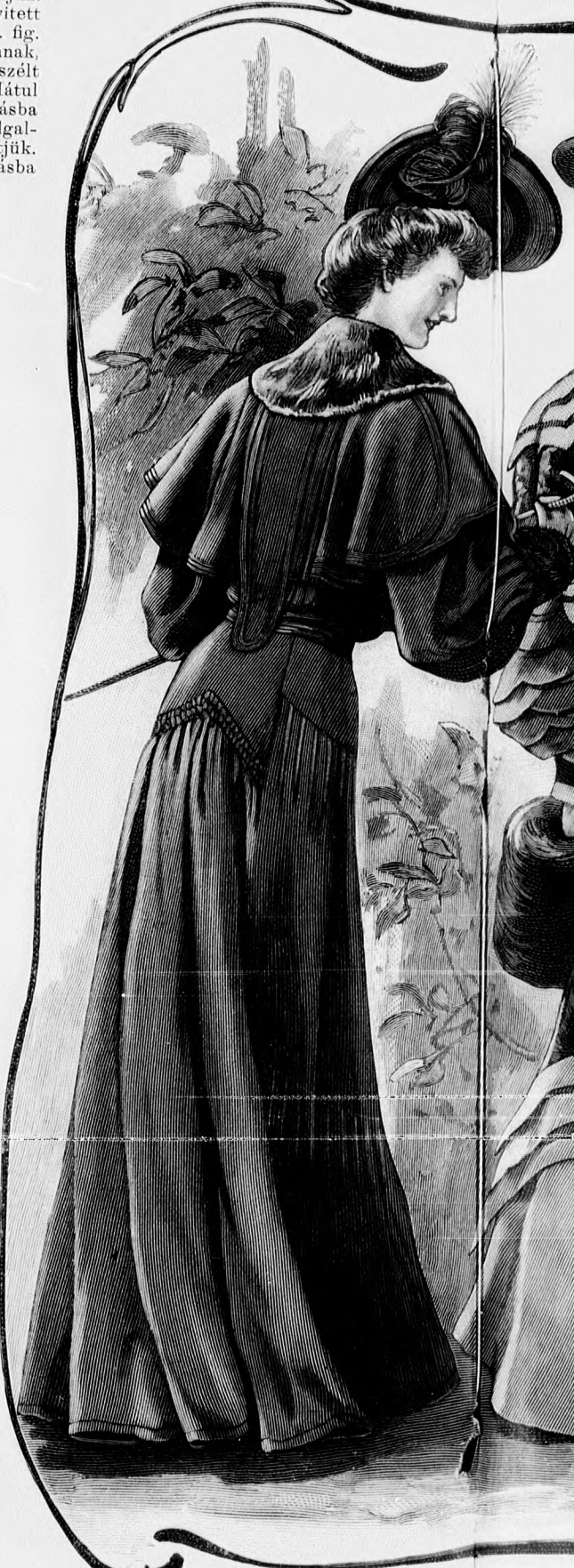
30. sz. Velvőruha galanddiszszel. Az 1. sz. eleje. Szab.: mintáiv X. sz., 92-93. fig.