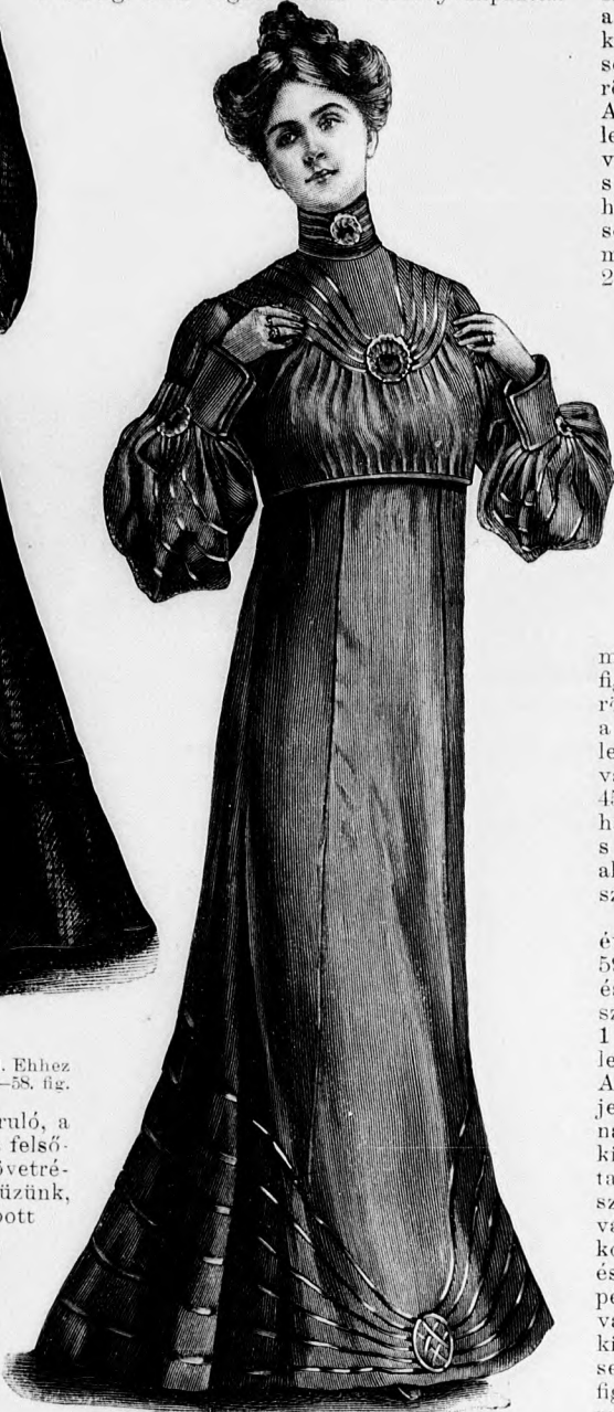
4. sz. Reformruha pávaszem-pántal díszítve. Szab., magy. és hátkép: mintáiv XVI. sz., 92-94a. fig.

2. sz. Posztóruha cakk- és plissédíszszel. Szab. és hátkép: mintáiv XIII. sz., 80-86a. fig. A csokoládészínű posztóruha elől kapcsos bélésderékát és bélésujjait az október 1. megjelent számunk 9-12. és 17. fig. adják. A bélésderékát a 84. fig. után vágott barna bársonyvállpánttal