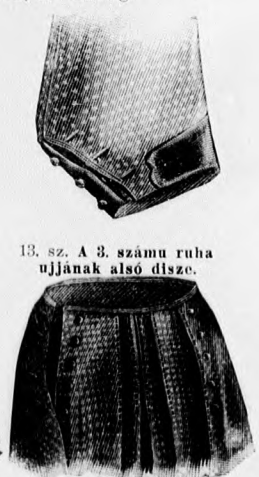
13. sz. A 3. számú ruha ujjának alsó díszje.

14. sz. A 3. szám hasitéka és a ránc elrendezése.