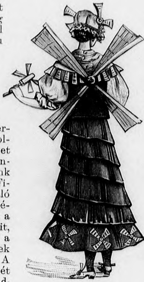
17. sz. A 15. szám háta.

25. sz. Gallér kivágott derékhoz. Szalagmunka. Az igen szép gallért 1/2 cm. széles fehér vászonszalagocskából graciózus serpentinálakban dolgozzuk ki, a melyet könnyedén és ráncosan alkalmazunk bál ruhákban. Finom cernából való hosszú pálcikaöltések fogják össze a minta körvonalait, kis pókok pedig a levélszerű részek egyes kelyheit. A gallér belső szélét medaillonos galanggal biztosítjuk. Mintánk díszes gallér- vagy zsaketdiszül is használható.