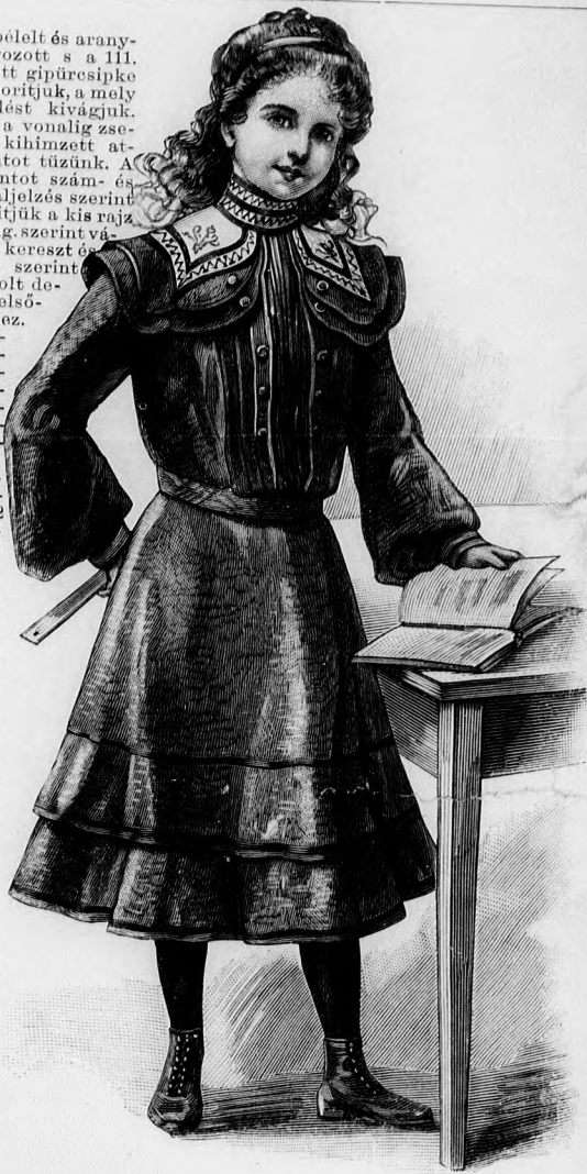
53. sz. Ruha himzett vállgallérral 8-10 éves leányoknak. Ehhez 49. szám. Szab., magy.: mintáiv XXII. szám, 129-137. fig.

A törösvonal mentén befelé fektetett előli szélei, a betétszerű, bugygyosan leülő, atlaszszalbélt, 242 cm. bő barna gázrészre fekszenek, a melyet főt és lent behuzva a belésszerű erősítünk. A derék alsó szélét miderővszerűleg zseniliával kihimzett felsőszövet takarja. A 117. fig. szerinti félhosszú belésűjűket a kis rajz 118. fig. után vágott felsőszövetujjak borítják. Az utóbbiakat a felső és alsó szélén állóránccokkal szűkítjük s azok kívül mindkét felső vonalon két, a következő két vonal között pedig négy fejcskőbe húzzuk. Alul 43-at 43-ra, duplapontot pedig duplapontra téve harangszerűleg fogjuk össze s a belésűjű alsó szélere erősítjük. Az alsó ujjszélét 18 cm. széles dupla szűfodor és egy 20 cm. széles, a belső varrás felé lekerekített himzett túllfodor határolja. A szoknyát a kis rajz 108. és 110. fig. adja. A belésszoknyát bevarrasokkal szűkítjük, az egyes szövetpántokból álló felsőszövet-szoknyát pedig kereszt és pont, valamint a kereszt és a pont szerint letüzendő ráncokkal rakjuk. Három. elől 3, hátul 4 cm. széles, háromszoros laposrácba rakott barna tafotatárussal díszíti a felsőszövet-szoknyát, a melyhez hátul még egy riss járul.