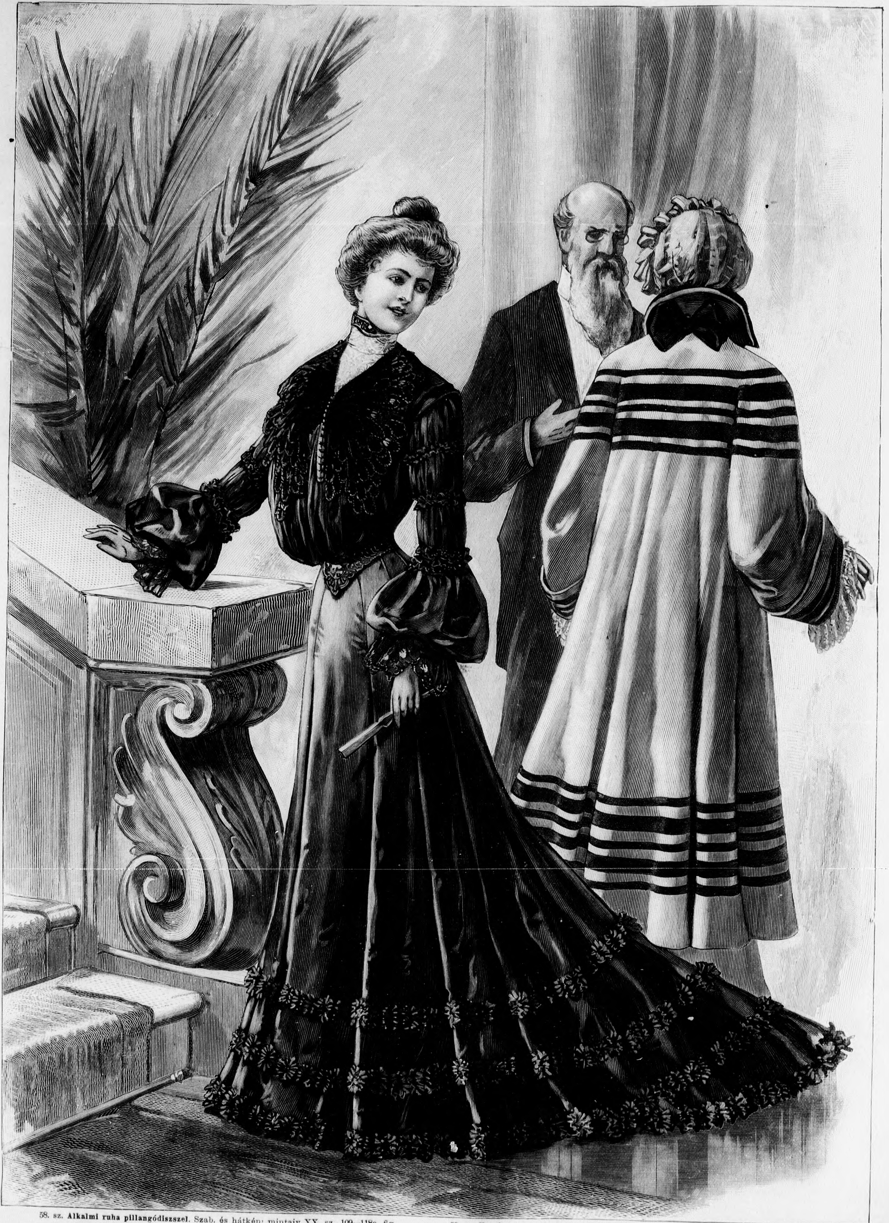
58. sz. Alkalmi ruha pillangódíszszel. Szab. és hátkép: mintaiv XX. sz., 109-118a. fig.