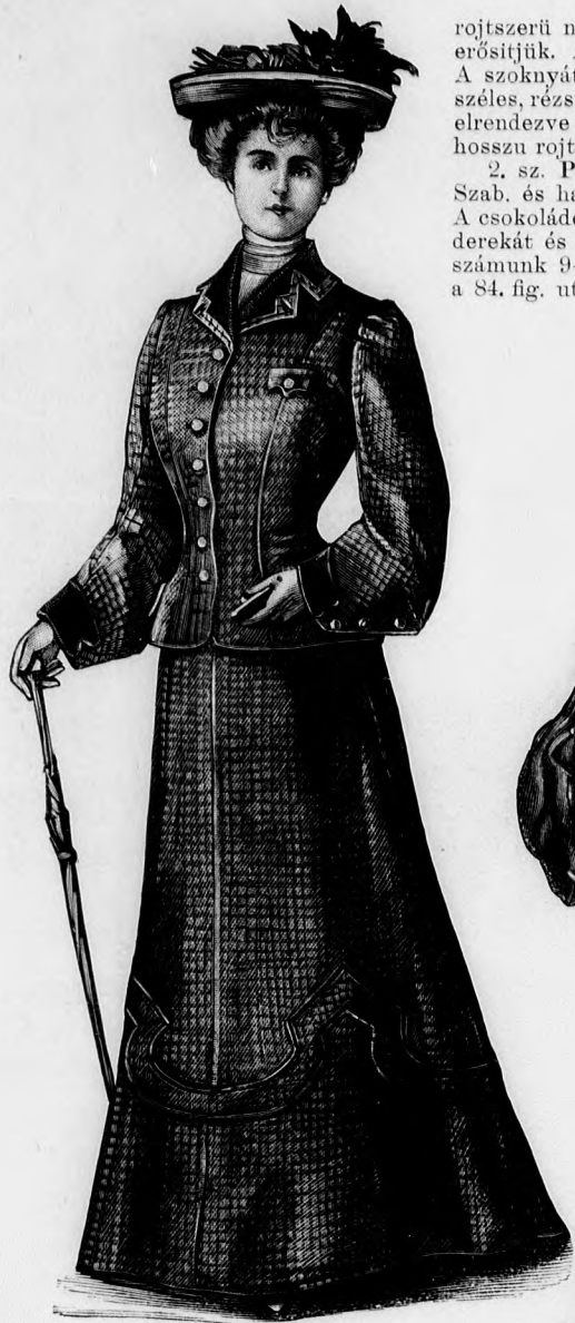
3. sz. Utcái ruha rövid testhezálló kabáttal. Ehhez 13. és 14. sz. Szab.: mintáiv VIII. sz., 51-58. fig.

s az ehhez számjézés szerint záruló, a 82. és 83. fig. szerint szabott cakkos felsőszövetrészek borítják. A felsőszövetrészekre plissirozott posztórészeket tűzünk, a melyek az elől hosszabban szabott felsőszövetrészek hosszában, elől 152, hátul 90 cm. szélesek s alul össze vannak fogva. A felsőszövetrészeket kereszt és pont szerint ráncba rakjuk és csillagig behuzzuk. Ezen részeket az ujj alatt a duplapontnál fogva, az a) duplaponttal egyesítjük. Az előli szélek alá vonal- és számjézés szerint, barna panne mellényrészeket erősítünk, a melyeket