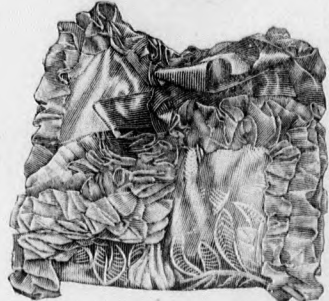
27. sz. Illatos zsákoeska.