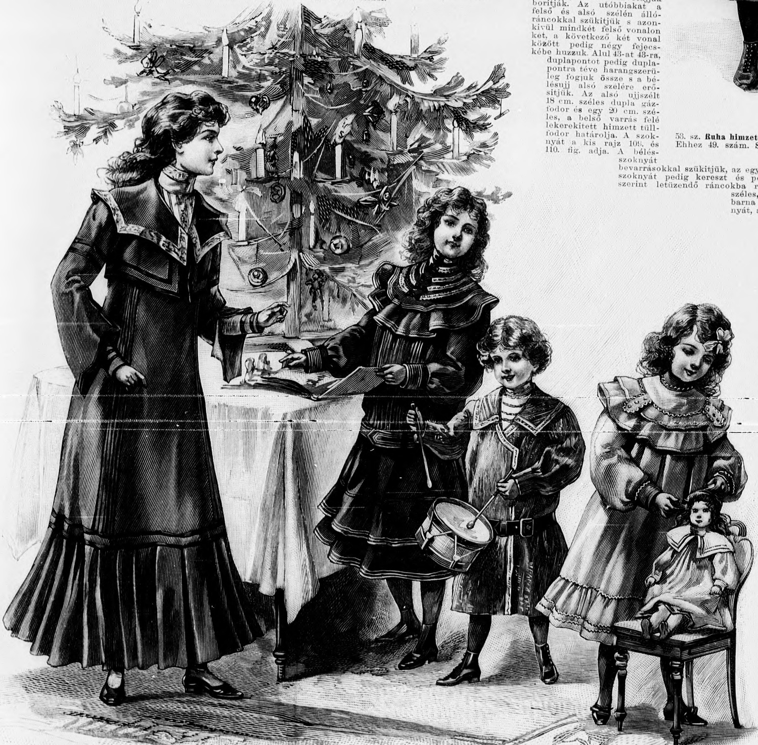
54. sz. Reformruha ujj nélkül zsakkettel serdülo leányoknak. Ehhez 51. és 52. sz. Szab. és magy.: mintáiv II. sz., 4-11. fig.