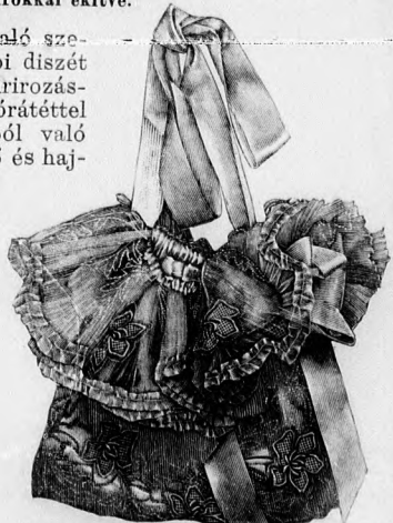
26. sz. Színházi tarsoly atlasz és csipkéből.

9-12. fig. után vágott bélésderéket hátul sima felsőszövet borítja. A 17. fig. az elől behuzott, a 18. és 19. fig. után vágott vállgallérral, a 20. fig. szerinti hajtóka alatt balra átkapcsolt felsőszövetet adja. A béleletlen vállgallér csücskös hátsó részét alul a derékre erősítjük. A hajtókát a törésvonalon kihajtjuk. A betétet és gallért a mai mintáivünk 16. s az október 1-én megjelent számunk 16. fig. adja. Az ujjakon a 22. számú kis rajzot a 21. fig. szerinti felsőrészek ellen ráncoljuk. A behuzott ujjakhoz alul 24 cm. b3. 12 cm. magas kézelőket erősítjük. A gömbölyű részen kellőleg lekerekített bélésujjakat az október 1-én megjelent számunk 17. fig. adja. A főt leirt szoknyát a 12., 14. és 15. fig. kis rajzai