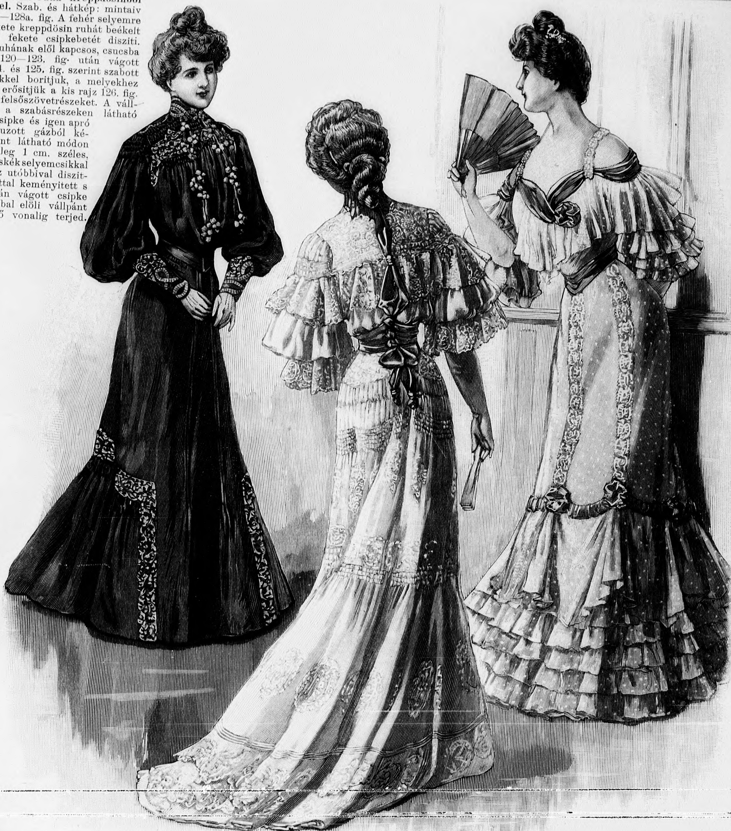
35. sz. Alkalmi ruha kreppdösinből csipkebetéttel. Szab. és hátkép: mintav XXI. sz., 119-128a. fig.