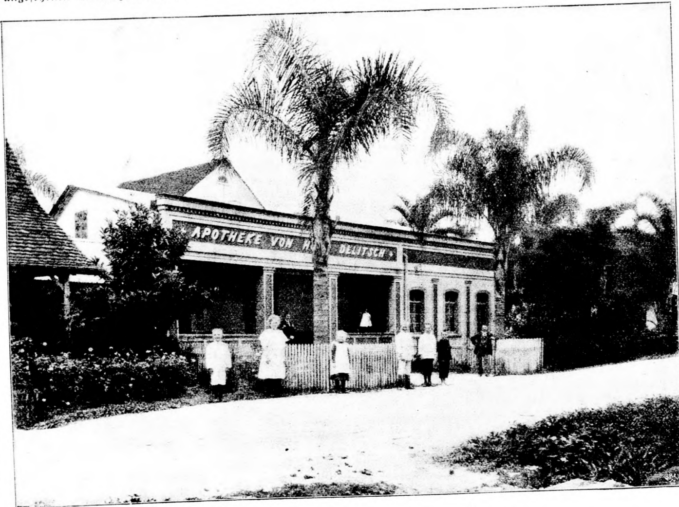
Joinville in Brasilien: Die Apotheke. (Mit Text.)

„Ach, Vater," war Friedrichs sehr niedrige Antwort gewesen, „wozu denn das alles, wenn ich es doch nicht erreichen kann, las mich ein Handwerk lernen und ich will dir zeigen, daß ich etwas kann, aber in der Schule, da wirbelt mir alles im Kopfe herum und was in der einen Stunde gelehrt wurde, habe ich in der andern vergessen. Aber ich kann nichts dazu, Vater," dat er deswils glaubte mir das, es ist weder Mühe, noch Bitterkeit, aber der Herr scheint mir das so hohl, daß ich nicht den geringsten Gedanken daran kann. Ich warte dir ja so gerne Freude machen, doch ich bin nicht imstande, den Vorlesungen der Lehrer zu folgen.“