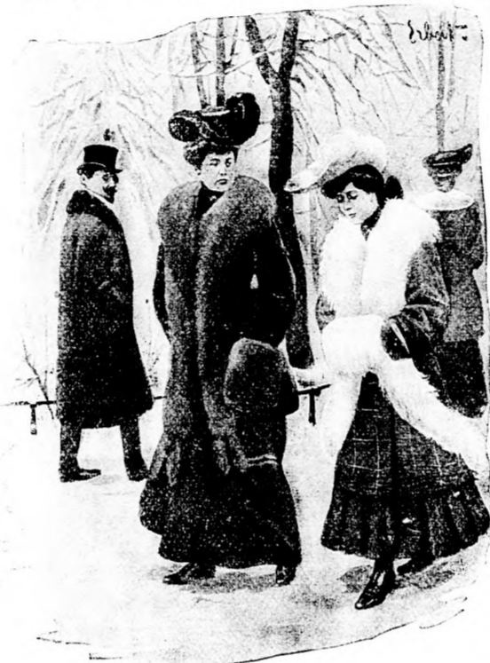
Auf der Promenade. „Aber, ich habe dir doch wiederholt gesagt, es ist unschicklich, einen Mann anzusehen, der dich auf der Straße anstarrt.“ „Aber ich muß mich doch erst überzeugen, ob er mich anstarrt.“