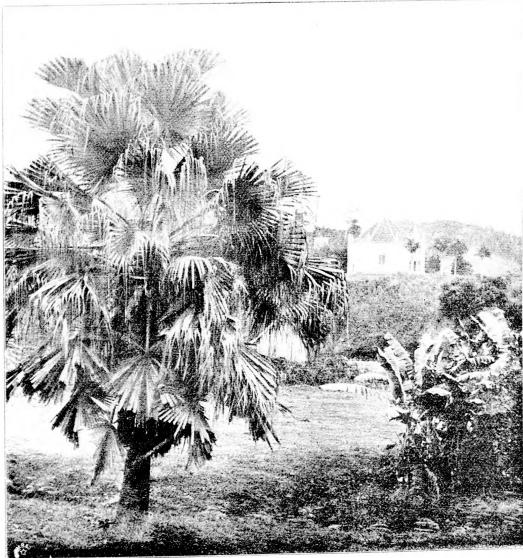
Blumenau in Brasilien: Palmenbaum, im Hintergrund die evangel. Kirche. (Mit Text.)

Das konnte nun Frau Thusnelda nicht anders sagen: pünktlich auf den Glockenschlag war Karolus immer gewesen, und so blieb ihr nichts anderes übrig, als in ihre strengen Züge ein lässiges Lächeln zu zwingen und die Korridortür zu schließen.