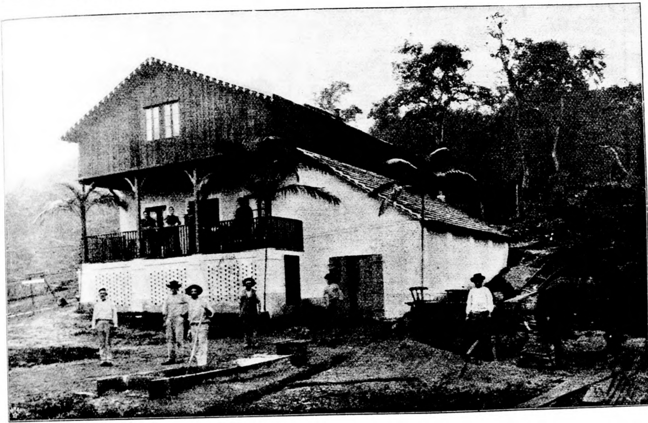
Deutsche Bierbrauerei am Itapicú (Brasilien). (Mit Text.)

„Friedrich auch nicht, lieber Mann," entgegnete die Hausfrau, „nur muß sein Können in die rechte Bahn geleitet werden.“