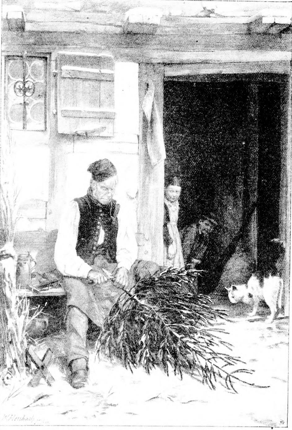
Belaucht, nach einer Originalzeichnung von W. Schuch.

„Ich sah da wie zu Stein erstarrt. Was hatte das nun wieder zu bedeuten? Sollte ich hier bleiben für immer und warum, wozu? Ich war doch mündig; wie konnte es jemand wagen, ohne meine Zustimmung so über mein Schicksal zu entscheiden?“