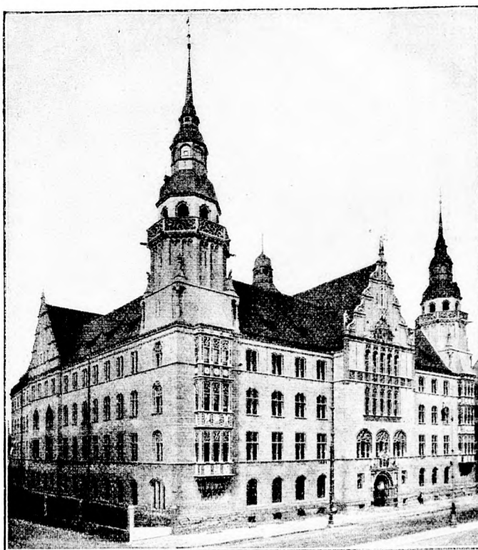
Das neue Justizgebäude in Halle a. S. (Mit Text.)

Marie, denn — abgesehen von allem andern — ich hatte Glück in den Minen von Nevada. Und nun zeigt mir den Weg, nicht wahr? Ihr kennt doch die Gegend! Ah, da fängt es an, zu dämmern!“ Marie deutete gen Süden.