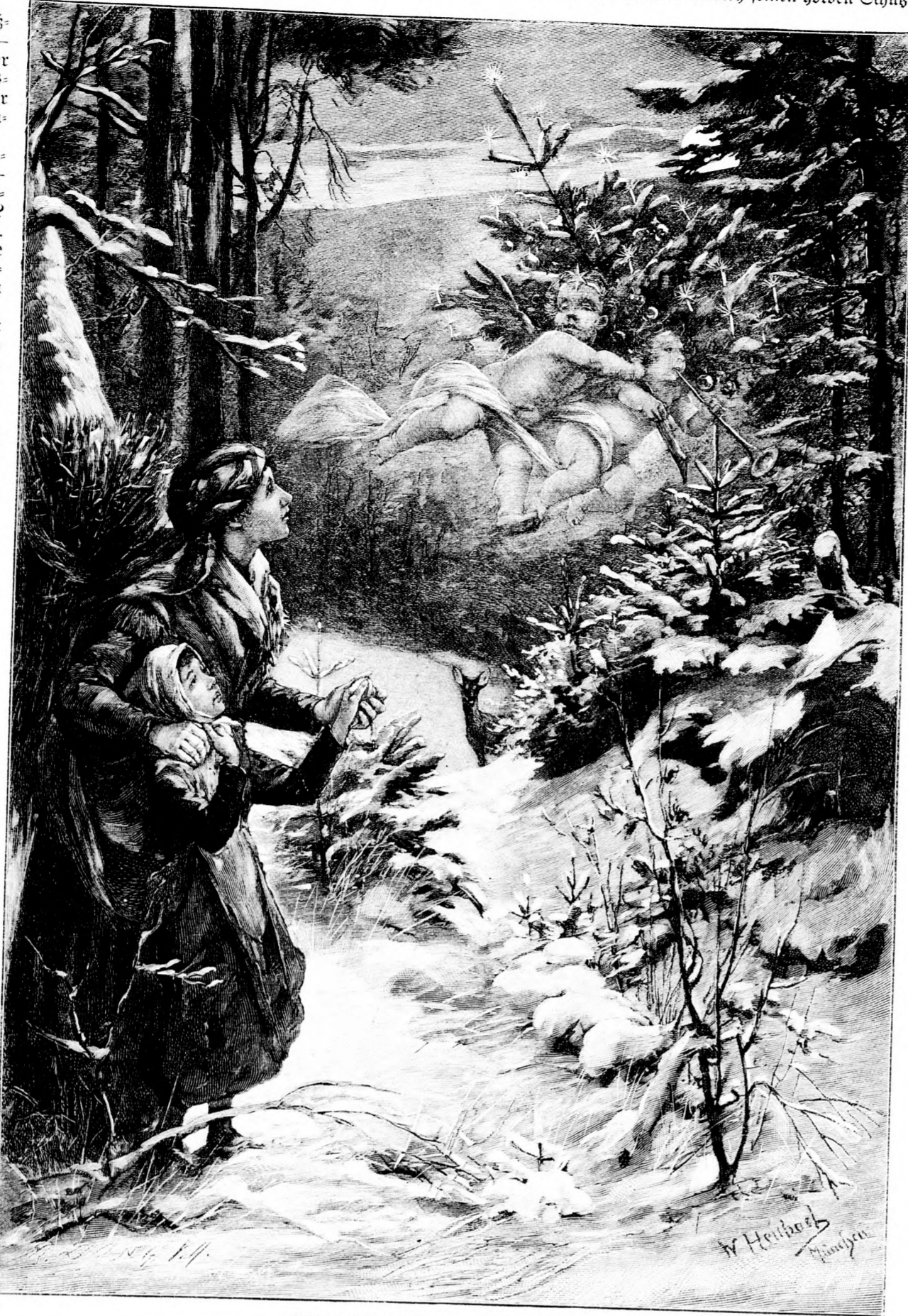
Weihnachtszauber. Von W. Heubach.

„Blanke nach und stürzte in den Gießbach, der — dreißig Fuß breit — die zerbrochenen Trümmer dahinwirbelte vor den Augen der wahnwitzigen, erst halb munteren Verfolger, die absolut machtlos vom jenseitigen Ufer aus das Nachsehen hatten. Ihre Klänge verhallten in leerer Luft, denn schon hatte Madley seinen holden Schützling abermals aufs Ross gehoben und war mit ihr davongaloppiert.“