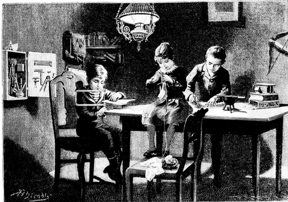
Weihnachtsarbeiten. (Mit Text.)

„Gott sei Die Worte während sie hinunter, die hinunter, die Noch sehr bedecktes Kopf des Red Ford Wie der nach sprühte form einen schmalen, w schmalen, w an einer Zeit les Geländes Andley ra gen, tiefen Würden die chen Manen Er hob Mar „Geht hin er. „Ich mit den folgen, a — und dann Marie geht und überdrie über die klein Moritz folgte am Hügel für lagere zitterte aber ohne im zu scheuen. De stand jaht das während sie den Übergang beobachtete m der Mitte de trachten und Aber sie trug Reiter und Ma sicher am and „Und nun i Soratius Coel chen die Brück Andley, seiner blühenden Dol „Und wenn die Hügel uns vor den, so muß i blauen, ehe sie men. Mit ein einten Kräfte dies mühe Ma fort zusammen Er kniete an der und begam beit. — Das morisch, wo es Anfall des Sa geist geweien, glücklicher über ein Wunder er arbeitete aus ten, schnitt, bra die Bretter an das Geschrei drü lauter und laut Stämmen der war jetzt ganz nehmbar. Noch Brett. Näher f Verfolger — je ler Sicht — wil anstehend beim von dem, was „Dalt, sag i Dalt! Oder wir schrie Garwey, wehr erhebend, würschäumend den Abhang ran welche ebenio f in demselben Au