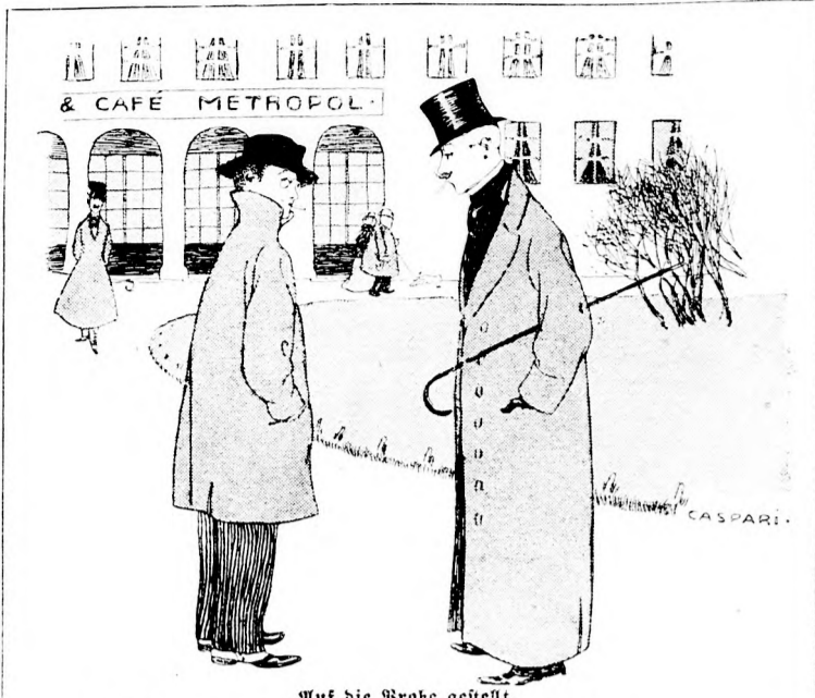
Auf die Probe gestellt. A.: „Sagen Sie mal, lieber B., haben Sie Courage?“ B.: „Na, ob und wie!“ A.: „So?“ — dann pumpten Sie mir doch jetzt einmal fünfzig Mark.“

des Diebes blickte er in dessen Gesicht und sagte ganz gelassen: „Mein junger Freund, Sie haben sich da eine Beschäftigung gewählt, die Sie über kurz oder lang an den Galgen bringen wird.“ — „O, Herr Fox, vergeben Sie mir! Ich darbe, hungernde Familie trieb mich zu dieser Tat“, jammerte der Dieb höchst, mit Thränen in den Augen. — „Fox, ohne ein Wort weiter zu verlieren, reichte dem Diebe ein Goldstück, und dieser verhielt sich leuchtend im Gedächtnis.“ — Als der Ballon aufgestiegen war, vermisste Fox seine Uhr. „Mein Himmel! man hat mir meine Uhr doch gestohlen!“ rief er aus. — „Ja“, erwiderte der General lachend, „ich habe wohl gesehen, wie der Diebe die Uhr einsteckte, aber du schienst mit ihm auf so gutem Fuß zu stehen, daß ich nichts dazu sagen mochte. Übrigens gabst du ihm ja auch eine Guinee als Belohnung dazu.“