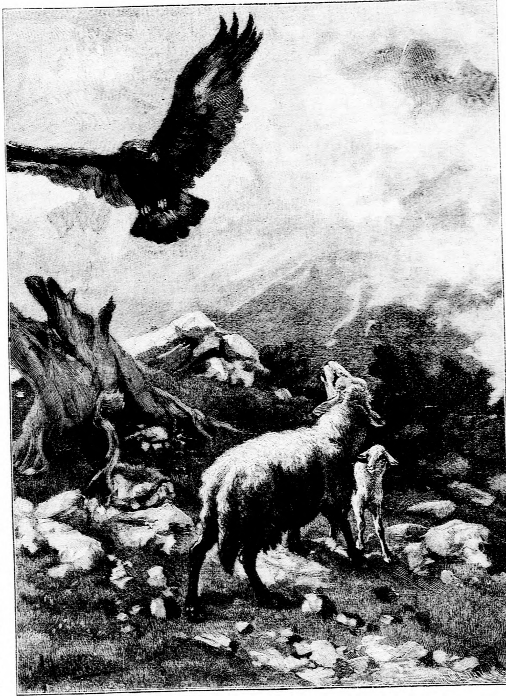
In Gefahr. Nach dem Gemälde von W. Gräbheim. (Mit Text.)

Der Wirklichkeit entnommen von E. von Briesen. Leutnant von Kreuzberg stand bei einem Infanterie-Regiment, das in einem kleineren Orte im Westen Deutschlands garnionierte. Ohne erteliche Zulage war es ihm nicht möglich gewesen, sich ohne Schulden durchzuschlagen, und manche bittere Stunde bereitere es ihm, wenn er daran dachte, wie er es stellen sollte, alle seine Gläubiger zu befriedigen.