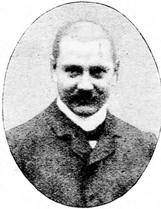
Graf von Beth, der neue Gouverneur von Lugo. (Mit Text.)

Einstmals — die ihm gestellte Frist ging in acht Tagen zu Ende — befand er sich in der Vorstadt und steuerte dem freien Felde zu, als er beim Passieren eines Parkeinganges plötzlich folgenden, von einer Kinderstimme herrührenden Ausruf vernahm: „Ach, Mamachen, sieh' doch mal dort jenen finsternen Offizier, gleicht er nicht auf ein Haar dem verstorbenen Papa?“