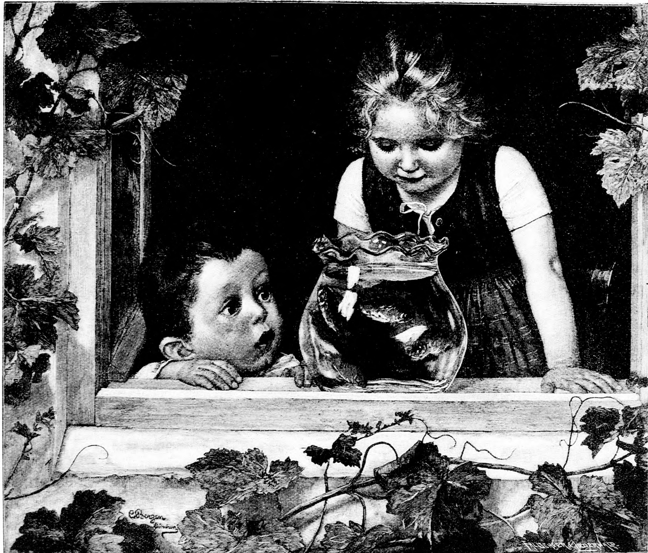
Goldfische. Nach dem Gemälde von C. von Bergen. (Mit Text.)