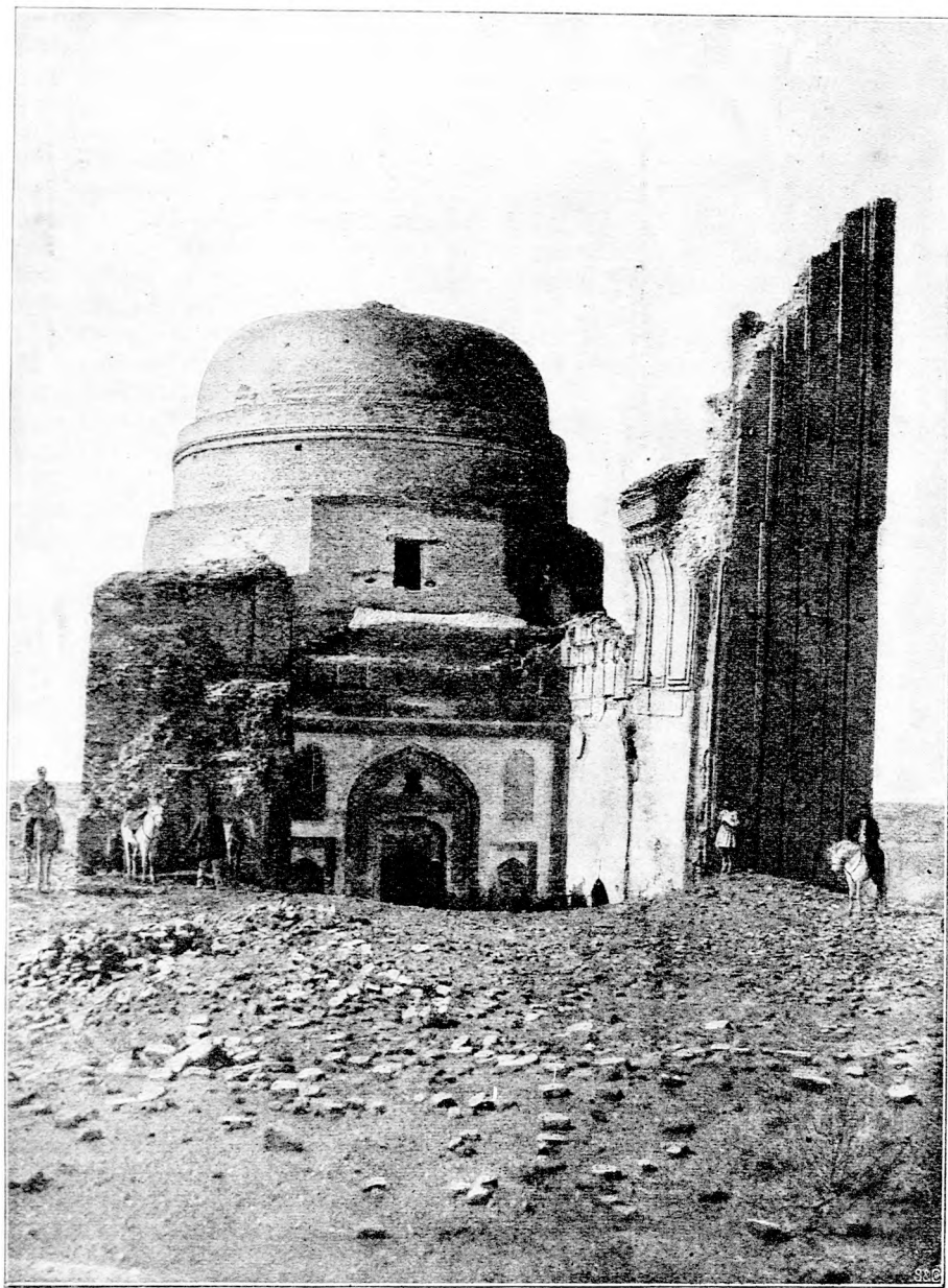
Monument an der Grenze von Persien, Rußland und Afghanistan. (Mit Text.)