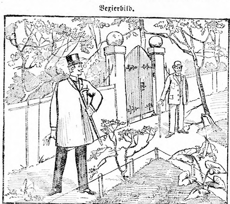
„Ach hätte mich so bedürft! Sollte der dort auch auf meine Ventranten? So mag sie nur sein!“