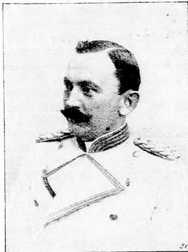
Hermann v. Wislmann. (Mit Text.)

Major Hermann v. Wislmann. Den bedeutendsten deutschen Afrikaforscher der Gegenwart, Major Hermann von Wislmann, den hochverdienten Pionier der deutschen Kolonialpolitik, hat ein tragischer Tod auf seinem Gute bei Pözen in Steiermark im Alter von nahezu 52 Jahren dahingerafft. 1896 legte er sein Amt als Gouverneur von Deutsch-Ostafrika nieder und 1899 zog er sich, nachdem er die Tochter eines rheinischen Großindustriellen geheiratet hatte, auf die von ihm erworbene Besitzung Weihenbach bei Pözen in Steiermark zurück. — Als Militär brachte er es nur bis zum Major, aber seine Leistungen in Afrika gehören der Geschichte an. Er wurde am 4. September 1853 zu Frankfurt a. d. O. geboren.