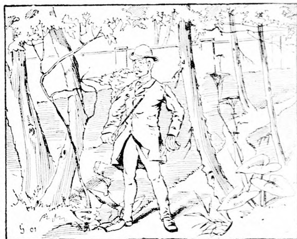
Wo ist der Wächter?