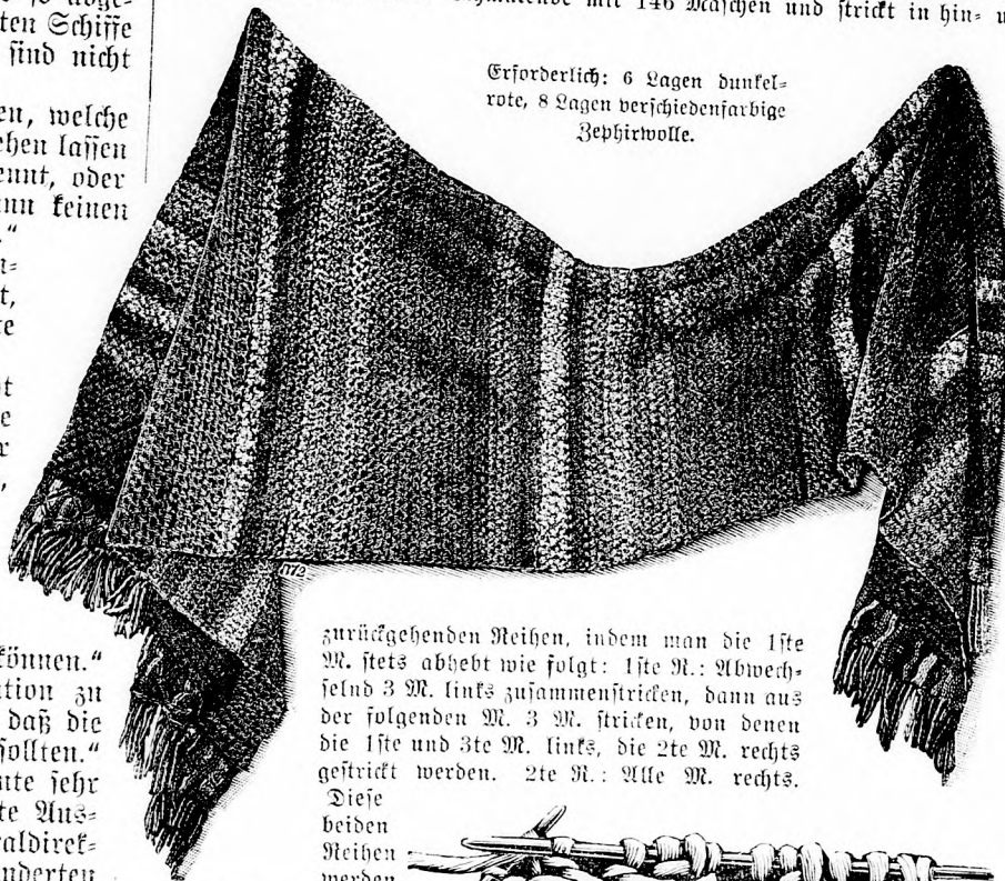
Erforderlich: 6 Lagen dunkelrote, 8 Lagen verschiedenfarbige Zephrinwolle.

Der Schal ist mit vierfacher Zephrinwolle in habscher, moderner Farbzusammenstellung 50 Zentimeter breit und 175 Zentimeter lang gestricht. Man beginnt an einem Schmalende mit 146 Maschen und strickt in hin- und