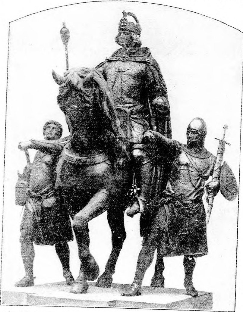
Denkmal Kaiser Ludwigs des Bayern auf dem Kaiser Ludwigsplatz in München. Modelliert von Ferdinand v. Miller. Nach einer phot. Aufnahme. (Mit Zug.)