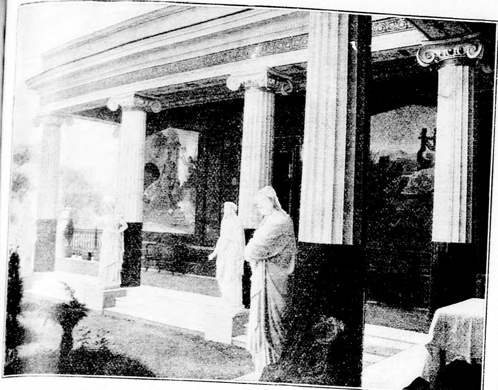
Das Achilleion auf Korfu. Nach einer photogr. Aufnahme. (Mit Text.)

Sierauf schoß er, und der Ast, den die ersten Strahlen der Sonne beleuchtete, war getroffen. — Jetzt war die Reihe an Morand. Alles wartete auf den Schuß, aber Morand erhob das Pistol