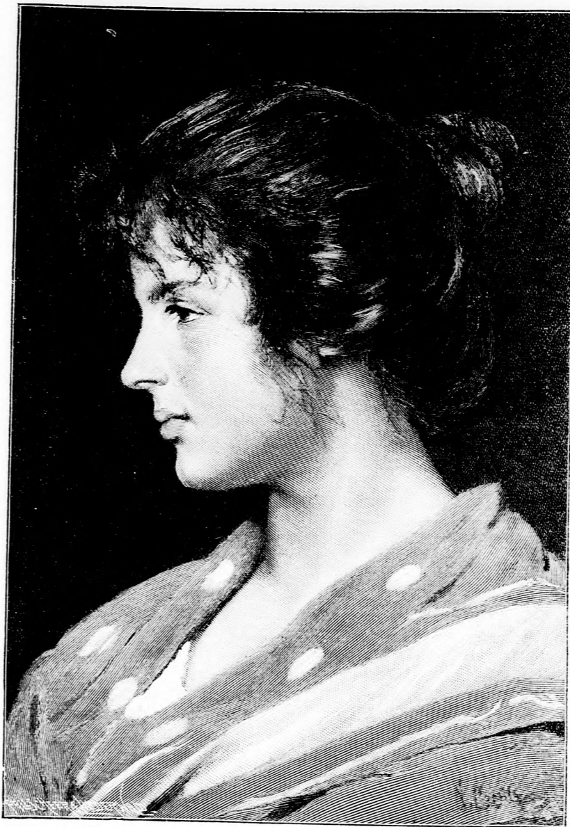
Lucia. Nach dem Gemälde von R. Coville.

„Verlassen Sie sich auf mich!“ sagte Morand empört, verließ seinen Platz und eilte über den Korridor zur Loge des Fremden.