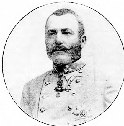
Erzherzog Friedrich von Österreich, der neue General-Truppeninspekteur der österreichisch-ungarischen Armee. (Mit Text.)

Erzherzog Friedrich von Österreich, der neuer-nannte General-Truppeninspekteur der österreichisch-ungarischen Armee, wurde am 4. Juni 1856 geboren. Der Eifer und die Hingebung, mit der er dem aktiven Truppendienst oblag, hat ihm das Vertrauen der Armee und wiederholte Auszeichnungen von seiten des obersten Kriegsherrn verschafft. Seit 1894 ist der Erzherzog, der im Kriegsjahr eine der ins Feld ziehenden Armeen zu führen hat, Feldzeugmeister.