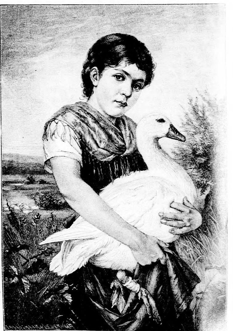
Verwundet. Nach dem Gemãlde von A. Weichlag. (Mit Fort.) Photographie und Verlag von Franz Hanfstaengl in München.

seines jungen Weibes schlang. „Aber wir wollen nicht an Sterben und Vergehen denken, für uns wird ewiger Liebesrühling sein.“ Taufend zärtliche Worte tauschend, war das junge Paar im Weiterstreiten an eine Lichtung gekommen. Dort unterbrach das Geschrei einer wild umherflatternden Dohle sichtbar den Abendfrieden. Die Schwarzrãcke schienen durch irgend etwas in einer wichtigen Beratung gestört worden zu sein. Beim Nãherkommen bemerkten die Gatten, daß dort ein Mann in Arbeiterkleidung, der ihnen den Rücken zugekehrt hatte, in übereifriger Hast grub und schaufelte. „Sehe ich recht — es ist Spitzgottis“, sagte Erwin erkannt. Er rief den Mann an.