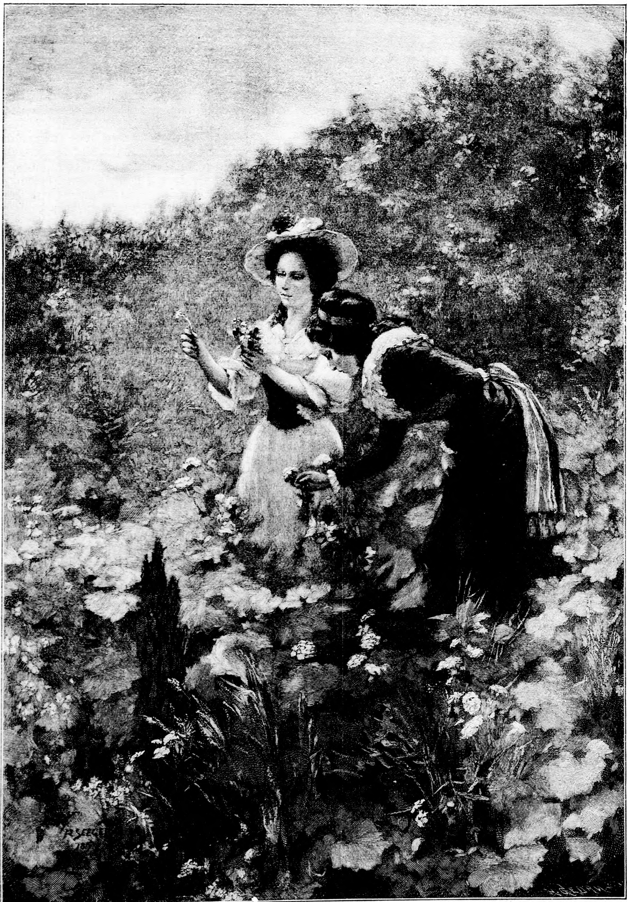
Am Feldrain. Rad. em Gemälde von H. Seeger. (Mit Text.)

ganz unabhängig von dem Andenken ist, das man ihnen widmet. Man will der Mitwelt zeigen, daß man sich so etwas leisten kann. Die selbige Menate hat übrigens das harte Urteil reichlich verdient; des Alten Sparantheit, ja Geiz dagegen ging bis zur Lächerlichkeit. Aus jedem Stückchen Leder, aus jedem verrosteten Nagel, den er auf dem Hofe fand, wußte er Kapital zu schlagen. Dabei hatte er nicht einmal Kinder, für die er hätte zu sorgen brauchen."