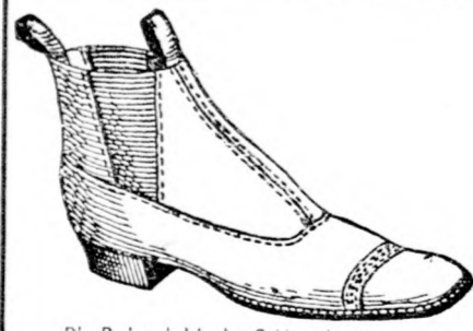
Die Preise sind in den Sohlen eingestempelt.

sind die Vorzüge unserer Fabrikate und bieten unsere Lager enorme Reichhaltigkeit in Schuhwaaren aller Art.