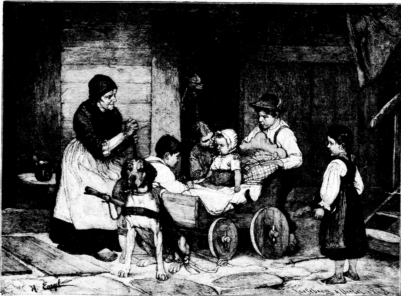
Zur Fahrt bereit. Nach dem Gemälde von G. Engel. (Mit Text.)

Im Saal ging es trotz der wogenden Menschenmenge sehr ruhig zu. Selbst diejenigen, welche nicht spielten, sondern augenscheinlich nur physiognomische Studien machen wollten, sprachen nur im Flüsterton, die Spieler aber saßen an den Tischen wie Bildsäulen.