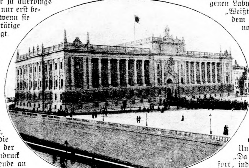
Der neue schwedische Reichstagspalast in Stockholm. (Mit Text.)