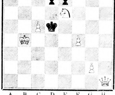
Seibstimmt in 2 Zügen.