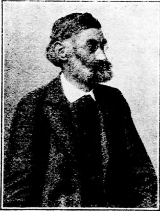
Professor Dr. Ernst Abbe f. (Mit Text.)