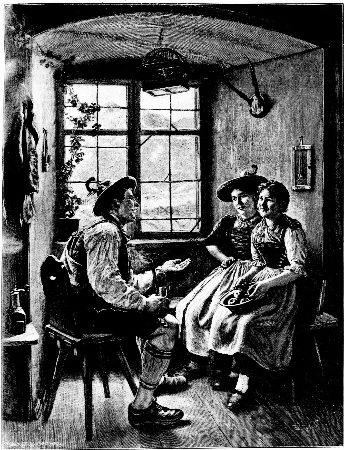
Eine lustige Geschichte. Nach dem Gemälde von E. Maun. (Mit Text.)

„Da, ha, ha! Köstlich!“ Ein glöckenbelles Lachen klang durchs Gemach. „Nun, Vetter Otto, was kehst du da, als kenntest du mich nicht? Oder hat dich meine Liebeserklärung plötzlich so schüchtern gemacht? Nun,