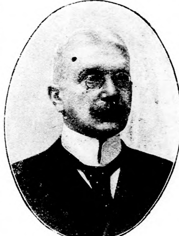
Freiherr von Gautsch, der neue österr. Ministerpräsident. (Mit Text)