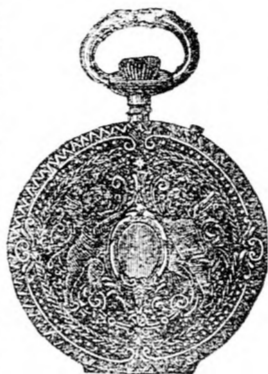
Nr. 190 C. Silber-Cylinder-Remontoir-Uhr, 50 Millim. Durchmesser, gravirt, solides gutes Werk fl. 5.—, Doppelmantel fl. 6.—

Uhrmacherei, Goldschmiederei und Optikerwaaren.