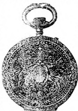
Nr. 190 C.

Uhrmacherei, Goldschmiederei und Optikerwaaren.