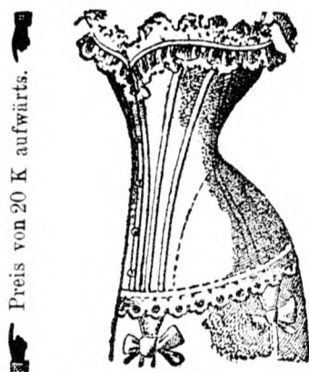
Preis von 20 K aufwärts.

k. k. österr. und grossherzoglich Luxemburgische Hoflieferantin und Hoflieferantin Ihrer Majestät der Königin von Württemberg.