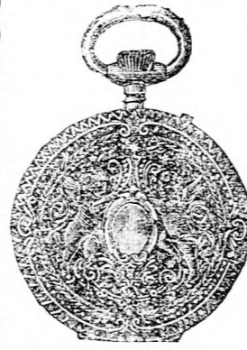
Nr. 190 C. Silber-Cylinder-Remontoir-Uhr. 50 Millim. Durchmesser, gravirt, solides gutes Werk fl. 5.25. Doppelmantel fl. 6.75.