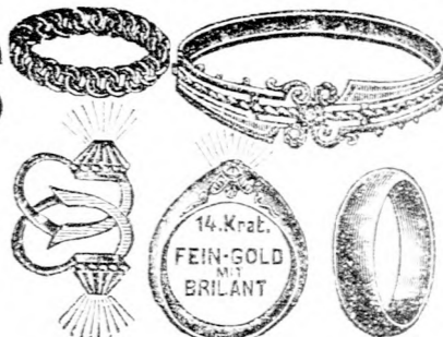
Nur gute, solide Waare.

Billige Preise, gewissenhafte Garantie. [154] 6