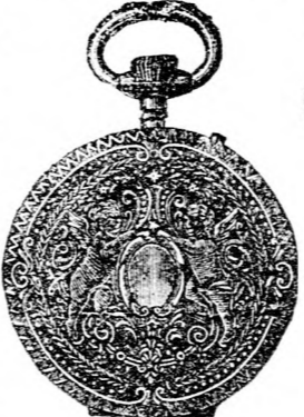
Nr. 190 C. Silber-Cylinder-Remontoir-Uhr. 50 Millim. Durchmesser, gravirt, solides gutes Werk fl. 5.25. Doppelmantel fl. 6.75.

Uhrmacherei, Goldschmiederei und Optikerwaaren.