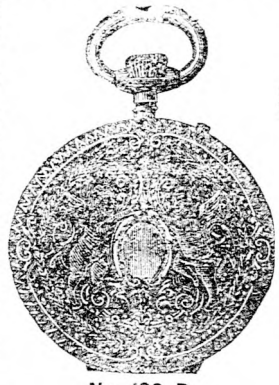
Nr. 190 B.

Uhrmacherei, Goldschmiederei und Optikerwaaren.