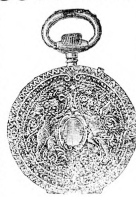
Nr. 190 B. Silber-Cylinder-Remontoir-Uhr, 50 Millim. Durchmesser, Doppelmantel, gravirt, mit neuer innerer Zeiger- stellung, solides gutes Werk fl. 7.75.