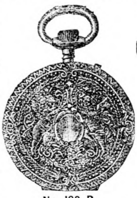
Nr. 190 B.

Uhrmacherei, Goldschmiederei und Optikerwaaren.