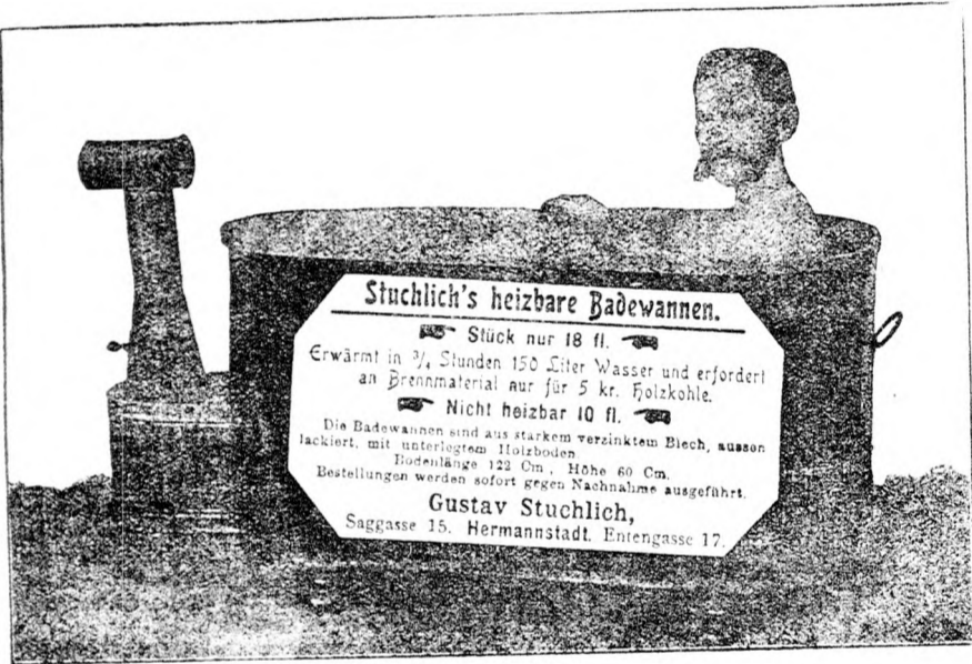
Stuchlich's heizbare Badewannen.

BADEWANNEN werden ausgeliehen per Tag 10 kr., per Monat 1 fl. 50 kr.