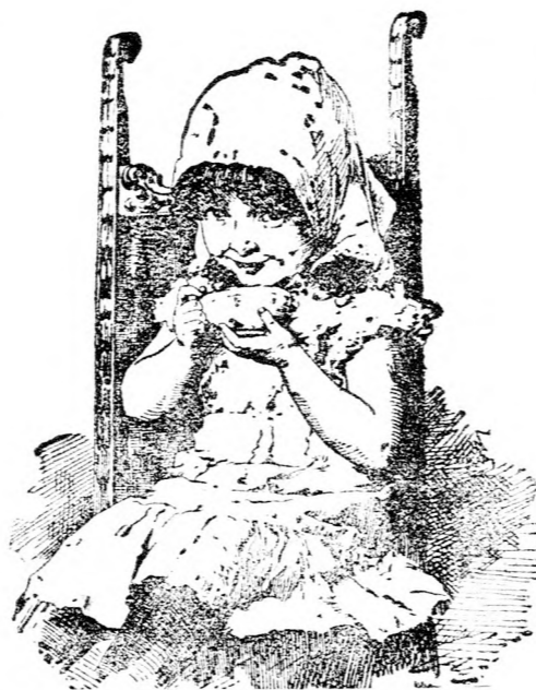
„Mir schmeckt das am besten!“

Wer trinkt Kathreiners Kneipp-Malzkafee?