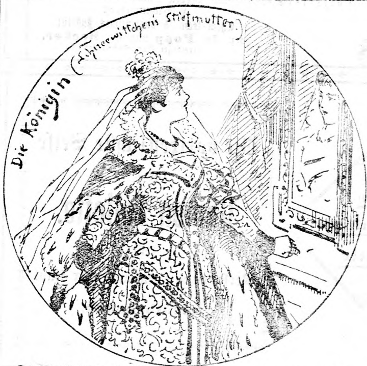
Die Königin (Schneewittchen's Stiefmutter)

Schlechte Seifen untergeben factisch Schönheit und Frische.