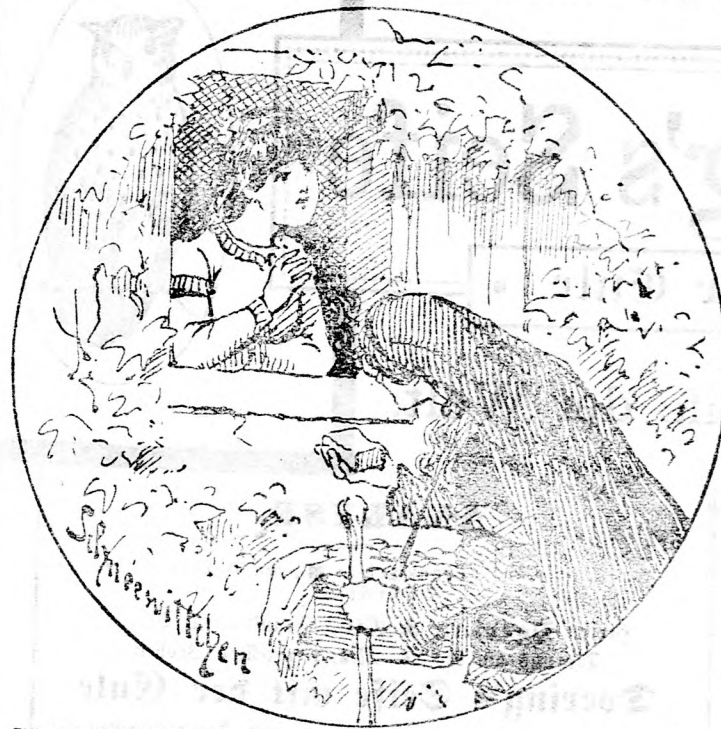
Schneewittchen's Stiefmutter als Hautreiniger: „Schönes Kind kauf' mir was ab, sieh' hier ist herrliche Seife, wer sich damit wäscht, bleibt immer schön.“ — „Meine liebe Frau, die Seife mag ich nicht, die ist schlecht, ich würde mich nur mit Doering's Seife mit der Zule, die ist die beste der Welt.“