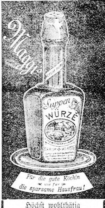
Für die gute Köchin wie für die sparsame Hausfrau! Höchst wohlthätig auch für Kranke und Schwache.

In allen Specerei- und Delicatesse-Geeschäften