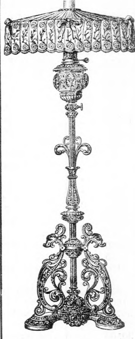
Ständer-Lampe mit Spitzenschirm.

Ditmar-Lampen hält jedes renommirte Lampengeschäft auf Lager.