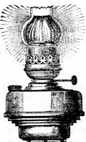
Astral-Lampen. Einsatz mit Brenner 20" mit 58 Kerzen Lichtstärke 30" " 104 " " "

Die Astral-Lampen können ihrer practischen Form wegen in die verschiedensten Lampengefäße eingesetzt werden.