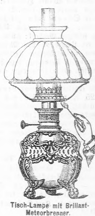
Tisch-Lampe mit Brillant-Meteorbrenner.

Alle Glas-Erfordernisse für Petroleum-Lampen in reichster Auswahl.