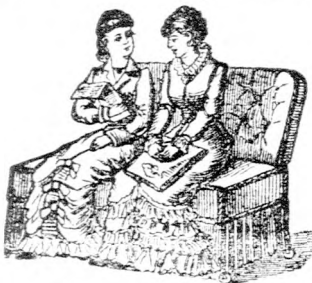
Als zwei Fauteuils

Patent für Oesterreich-Ungarn Nr. 17550 und 18857. Zu benützen am Tage als Sopha.