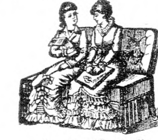
Als zwei Fauteuils

Das practischste Weihnachts-Geschenk ist Schöberl's berühmtes Sopha-Bett. Patent für Oesterreich-Ungarn Nr. 17550 und 18857. Zu benützen am Tage als Sopha.