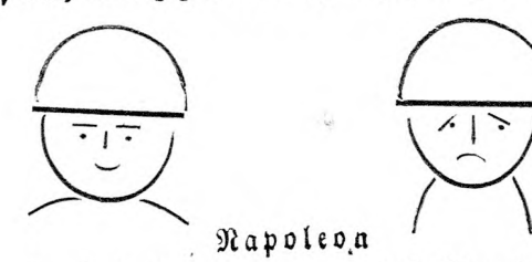
bei Austerlitz und Waterloo.