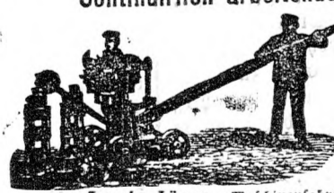
Louis Jäger, Maschinenfabrikant in Ehrenfeld-Cöln a. Rh.

empfehle meine Maschinen für Dampf-, Pferde- und Handbetrieb zur billigen Fabrication von allen Sorten Mauer- und Dachziegeln, Röhren etc. , besonders meine Continuirlich arbeitende Hand-Ziegelpressen , welche andern Fabrications-Methoden gegenüber die namhaftesten Vortheile und größte Ersparnis bieten. Dieselben bedürfen einer Bedienung von 2 Reuten zur Herstellung von 4000 prachtvollen Ziegeln und eignen sich auch vorzüglich zum Brechen von Trottoir- und Flurplatten, feuerfesten Steinen, Kalk- und Cement-sandsteinen, Schlackeniegeln etc., sowie zum Nachpressen d. halbtrocknen, vorgeformten Steinen. Prospecte gratis.