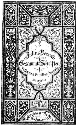
Erscheint in 100 illustr. Lieferungen à 25 kr. ö. W. = 50 Pf.